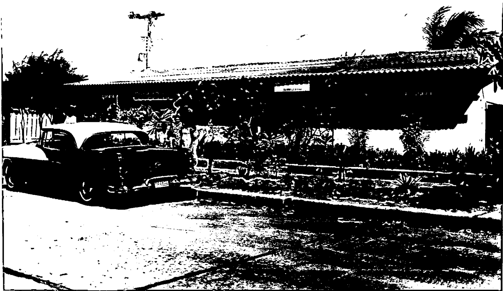
caseta comunal convertida en puesto de Salud.