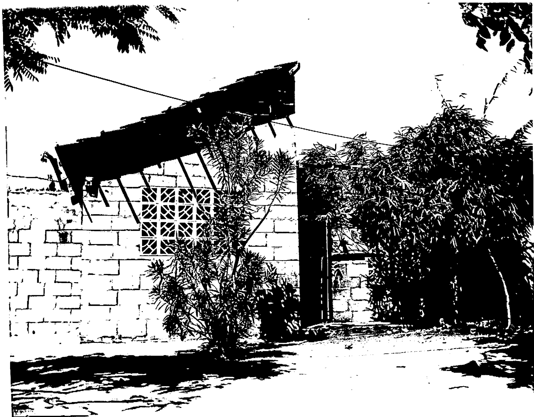
Vivienda Inicial hasta donde llegó el préstamo del I. C. T.