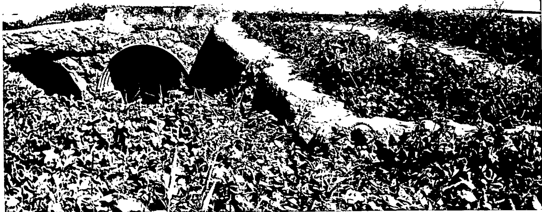
Loma Comunal. Rehabilitada por Acción Comunal.