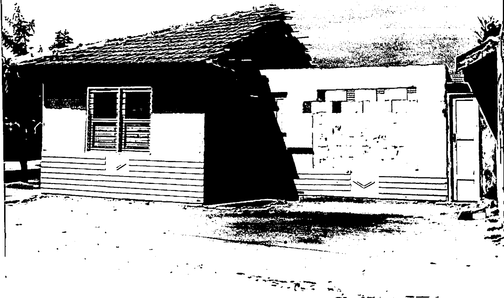
Vivienda Inicial con mejoras introducidas.