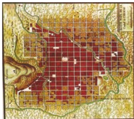
Foto 5. Caracas 1775.