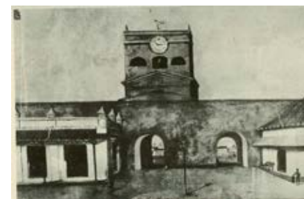
Foto 16. Ilustración de la Torre del Reloj, con solo dos de sus puertas. En 1905 se abrió la tercera puerta. (Archivo Fototeca Histórica de Cartagena).