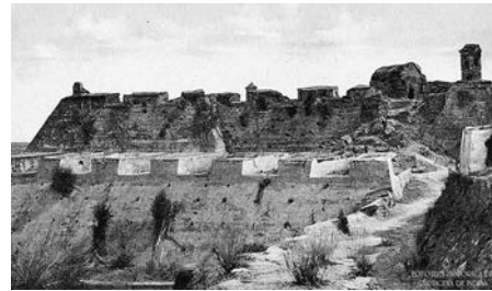
Foto 22. Castillo de San Felipe

En 1959, con la Ley 163, por la cual se dictan las medidas sobre defensa y conservación del Patrimonio Histórico, Artístico y de Monumentos Públicos de la Nación para la Protección del Patrimonio, se inicia el proceso de reconocimiento y declaratoria de Monumentos Nacionales, hoy bienes de interés cultural (BIC) del ámbito nacional, que se aplica a los centros históricos.