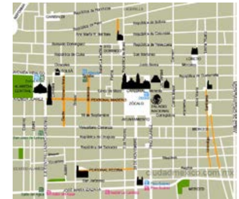
Foto 3. Centro histórico de México D. F. (mexico 20.05, 2012). Este centro histórico se ha consolidado como centro administrativo y cultural