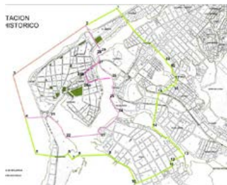
Foto 24. Delimitación de Periferia Histórica y área de influencia – PEMP 2010.