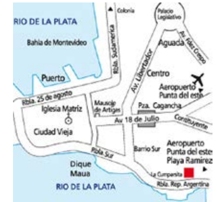
Foto 2. Mapa de Montevideo