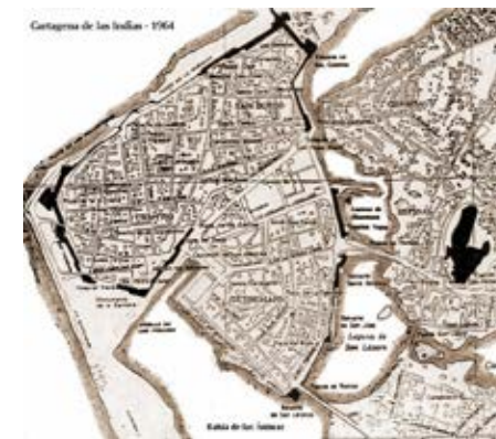
Foto 12. Plano del Centro Amurallado y Chambacú, 1964. Este plano registra el barrio de Chambacú, que fue erradicado en 1971, con miras a establecer condiciones urbanas que propiciaran el desarrollo del turismo, de acuerdo con los intereses inversionistas y del gobierno

de expansión. Se originaron cambios como el relleno del caño de San Anastasio para dar espacio a las vías del ferrocarril que más tarde dio paso a la urbanización La Matuna y se derribaron tramos de muralla interconectando la ciudad con el centro amurallado que se consolidó como su centro administrativo, económico, social, político y cultural.