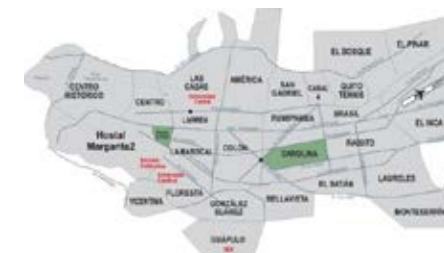
Foto 1. Mapa de Quito