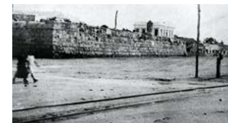
Foto 19. Baluarte de San Pedro Apóstol demolido entre 1916 a 1924.