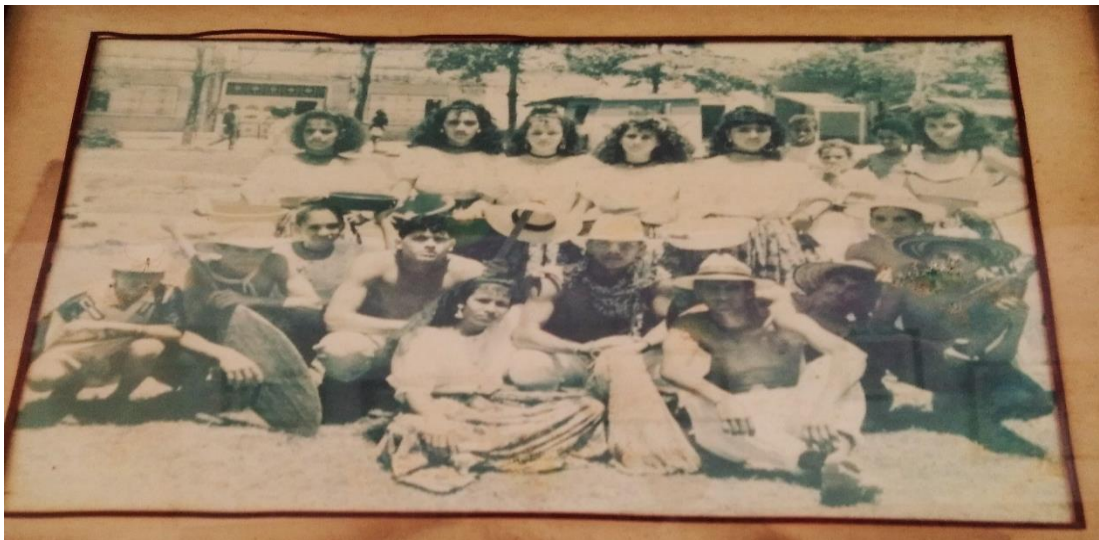
Anexo No. 2.