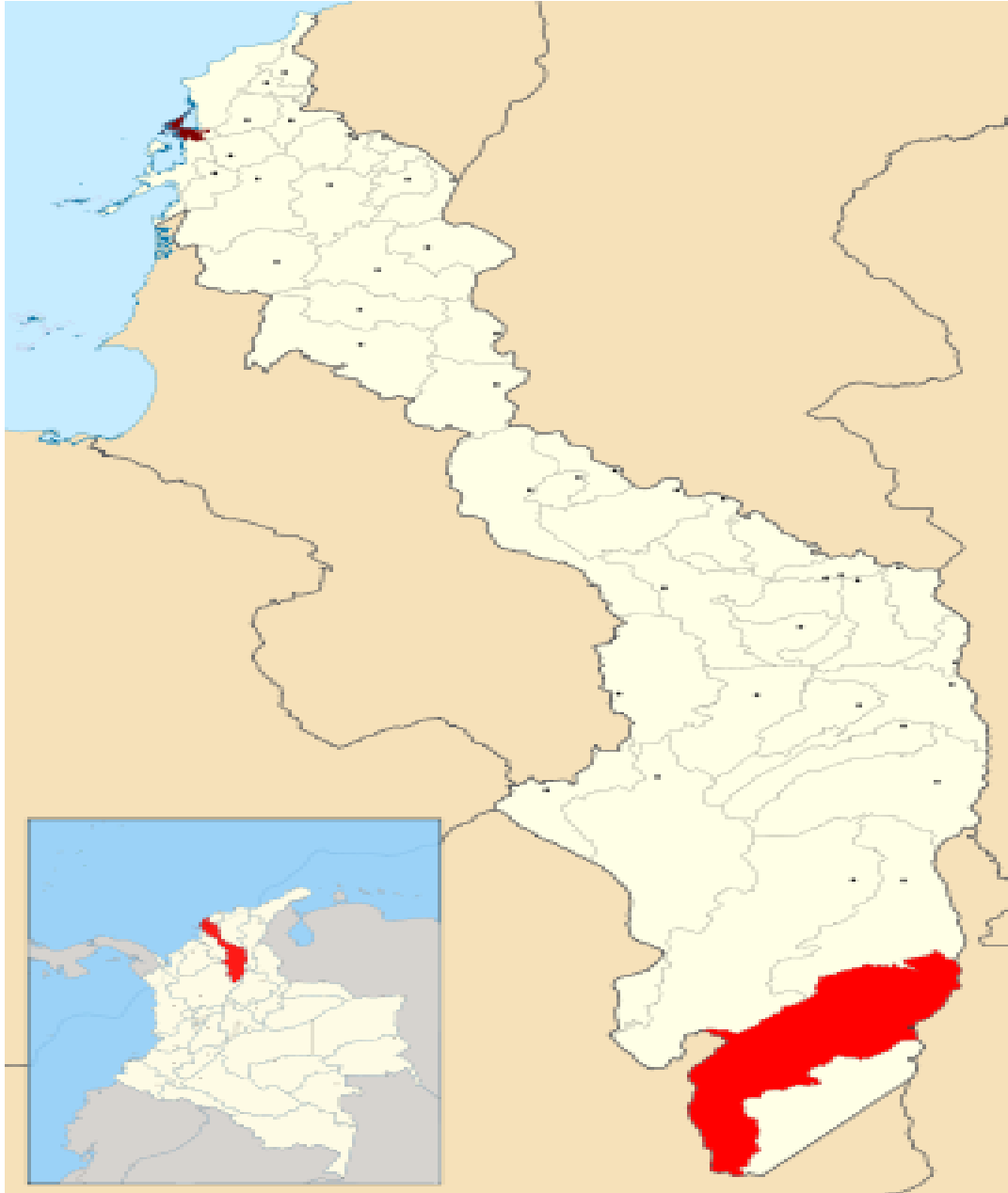
Mapa 1. Ubicación de San Pablo Sur de Bolívar