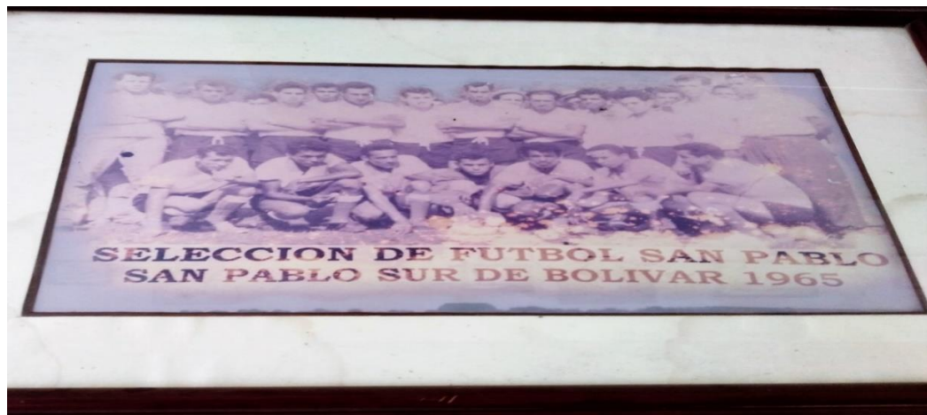
Anexo No. 7.