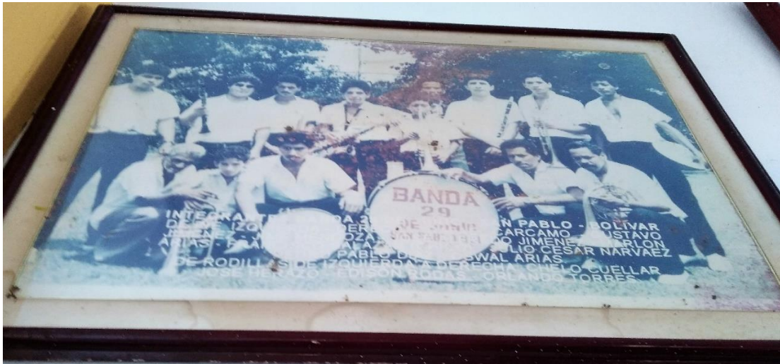
Anexo No. 6. Fuente: Cuadro Fotográfico de los primeros integrantes que formaron la Banda Papayera 29 de junio algunos ya fallecieron, archivo Casa de la Cultura, Biblioteca Pública Vicente Guaitero de San Pablo, en abril 2018.