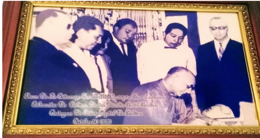
Anexo No. 1.