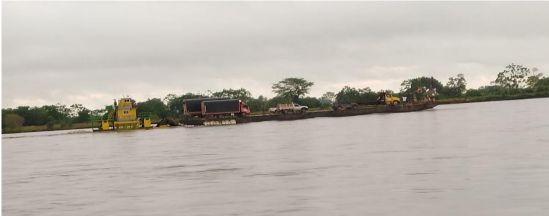
Puerto de San Pablo.