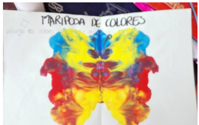
Imagen 2: resultado final del proyecto