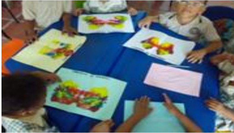
Imagen 3: exposición de trabajos y experiencias