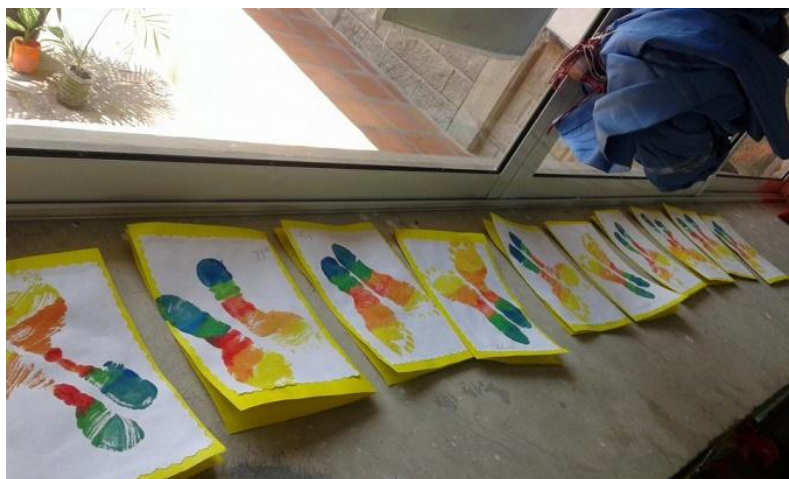
Imagen 9: pinturas hechas con los pies