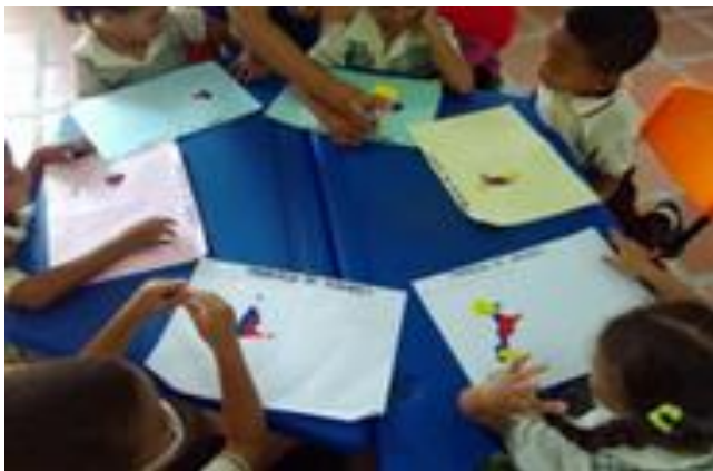
Imagen 1: Aplicación de colores primarios trabajo grupal