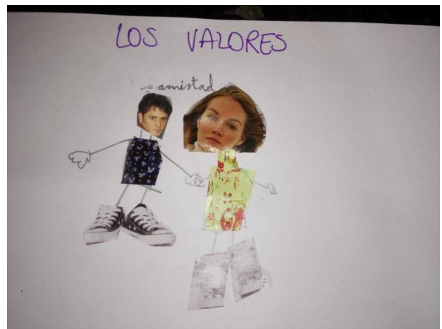
Imágenes 7 Y 8: representación de valores y explicación al grupo