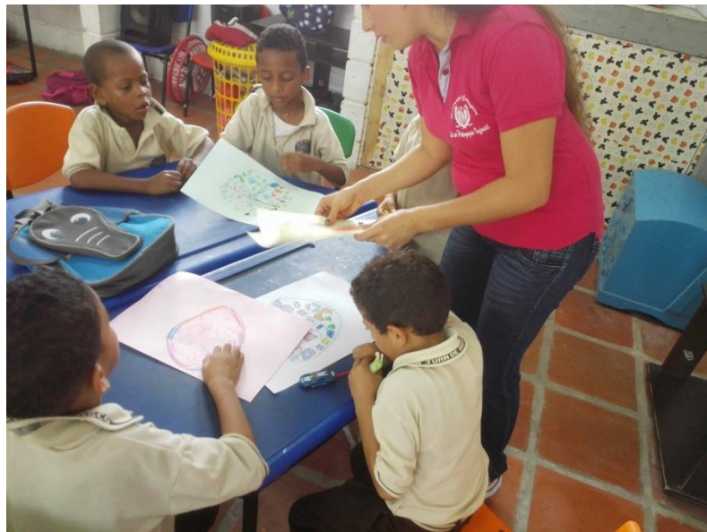
IMAGEN 4: exploración de formas para la realización de mandalas