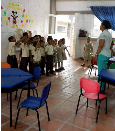
Imagen 5: repaso sobre los valores sociales y el comportamiento