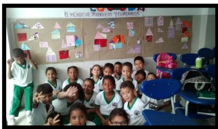
MURAL EL PAIS DE TRIANGULOS Y CUADRADOS 1