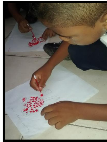
Creando el monstruo de la Rabia