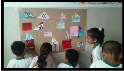
GRUPO A 1