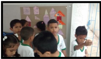
GRUPO B 1