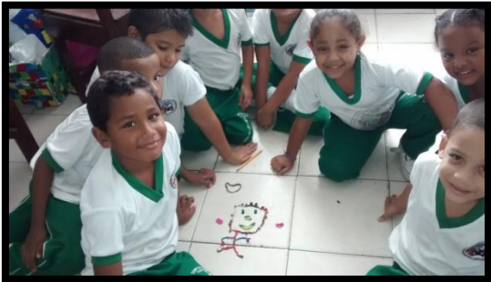
Emoción ALEGRIA 1