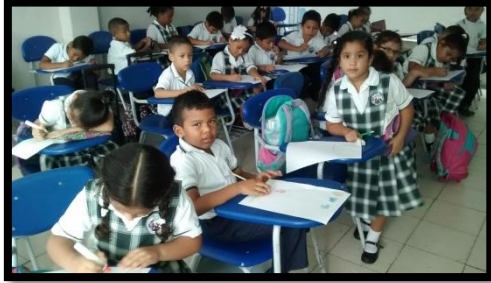
Dibujo libre mis emociones 1