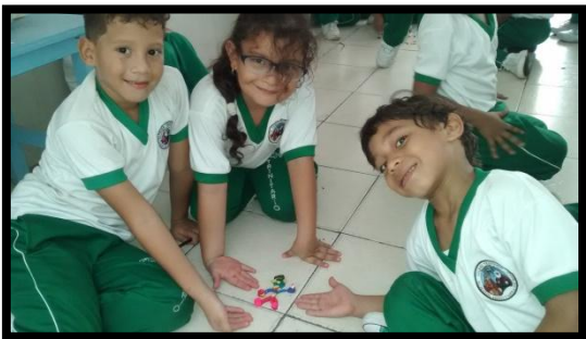
Personaje La emoción TRISTEZA 1