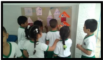
GRUPO C 1