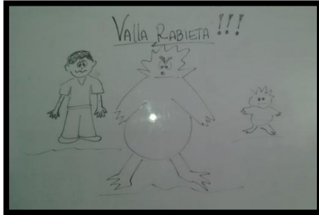
Valla Rabieta...!!! 1

Técnica: Puntillismo, rallas y garabatos