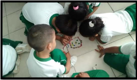
Personaje La emoción ALEGRÍA 1