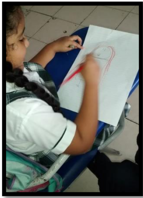
Dibujando la Alegría 1