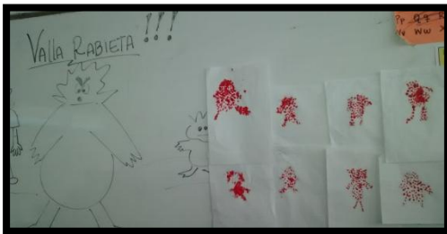
Creación de las Monstruos de la Rabia