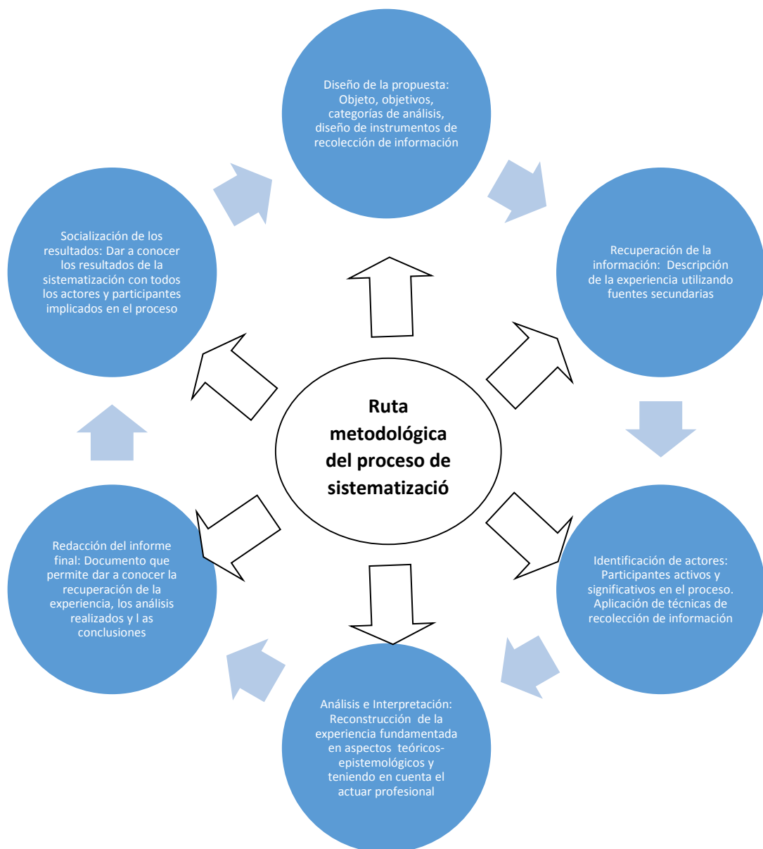
Tabla 3. Ruta metodológica