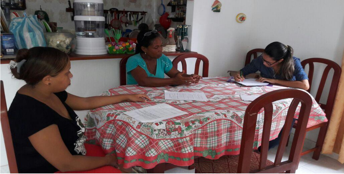
Fotografía tomada el día 19 de Septiembre de 2017, a mujeres pertenecientes a la Organización Para el Desarrollo Integral Vecinas de Arjona.