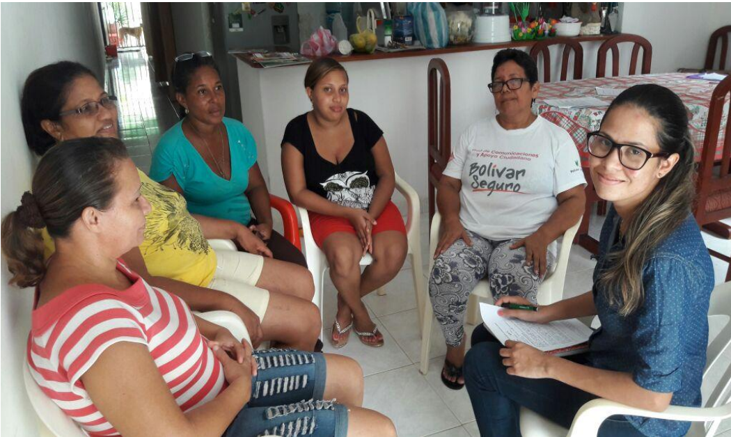
Fotografía tomada el día 19 de Septiembre de 2017, a mujeres pertenecientes a la Organización Para el Desarrollo Integral Vecinas de Arjona.