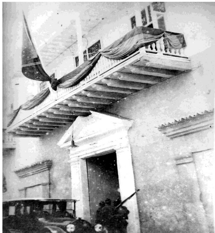
Foto de la Fachada en pleno funcionamiento de la casa CONSULADO de COMERCIO.