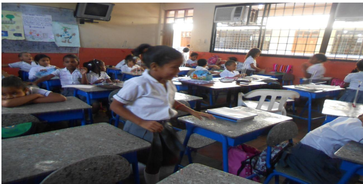
Estudiantes distraídos durante el desarrollo de las actividades escolares.