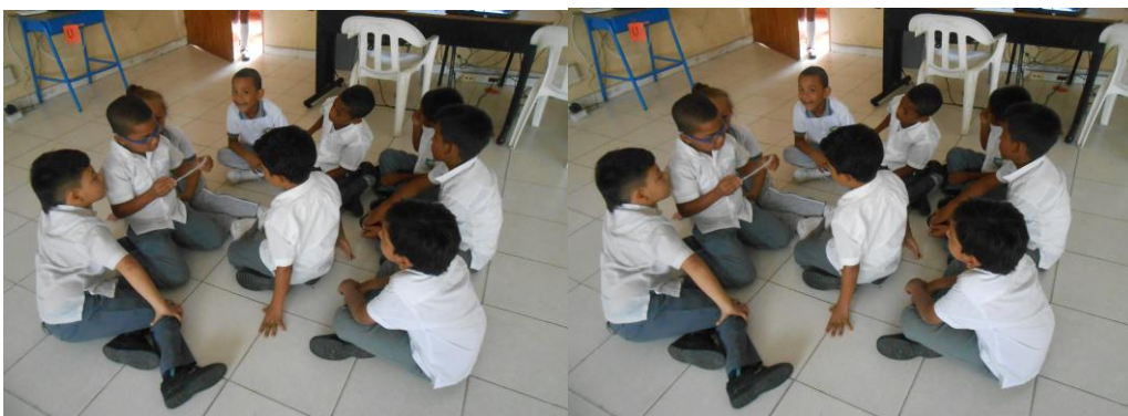
Imagen N° 6: Talleres en grupo.

Se realizó con el objetivo de afianzar las relaciones interpersonales.