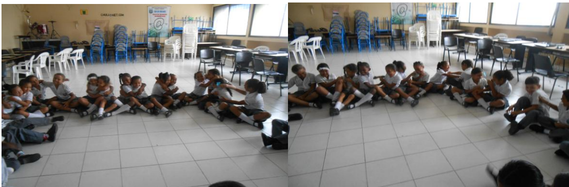
Imagen N° 4: conociendo a los demás

Esta dinámica consistía en saludar calurosamente y hacerle preguntas al compañero de al lado, por medio de una canción para conocer sus gustos y deseos. Esto se realizó con el objetivo de conocer un poco más al compañero.