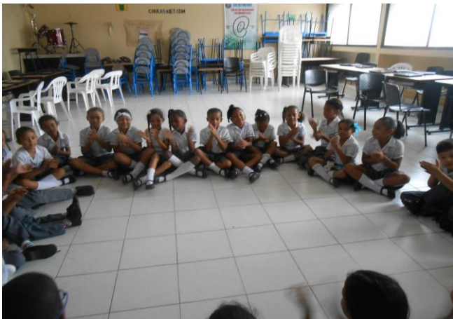
Imagen N°5: mesa redonda