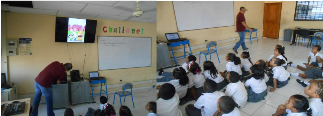
Imagen N° 3: video. La historia de Fito

Con este video acerca del bullying se quería hacer reflexionar a los estudiantes de las consecuencias que puede generar la violencia en la etapa escolar.