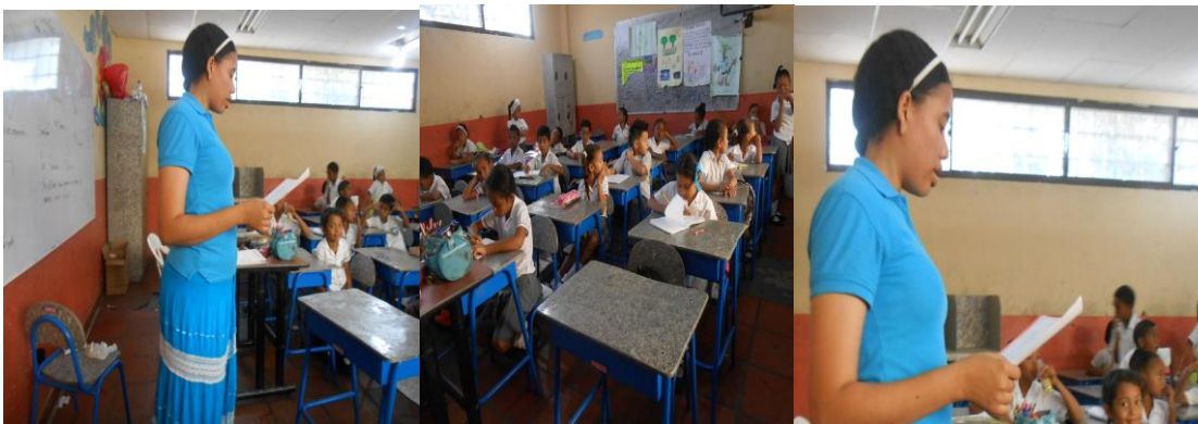
Imagen N° 1. Charla. Convivencia escolar y relato de cuento

Aquí se presentó una conceptualización y reflexión de convivencia escolar Con el fin de sensibilizar a los estudiantes de la falta de convivencia dentro del aula de clase.