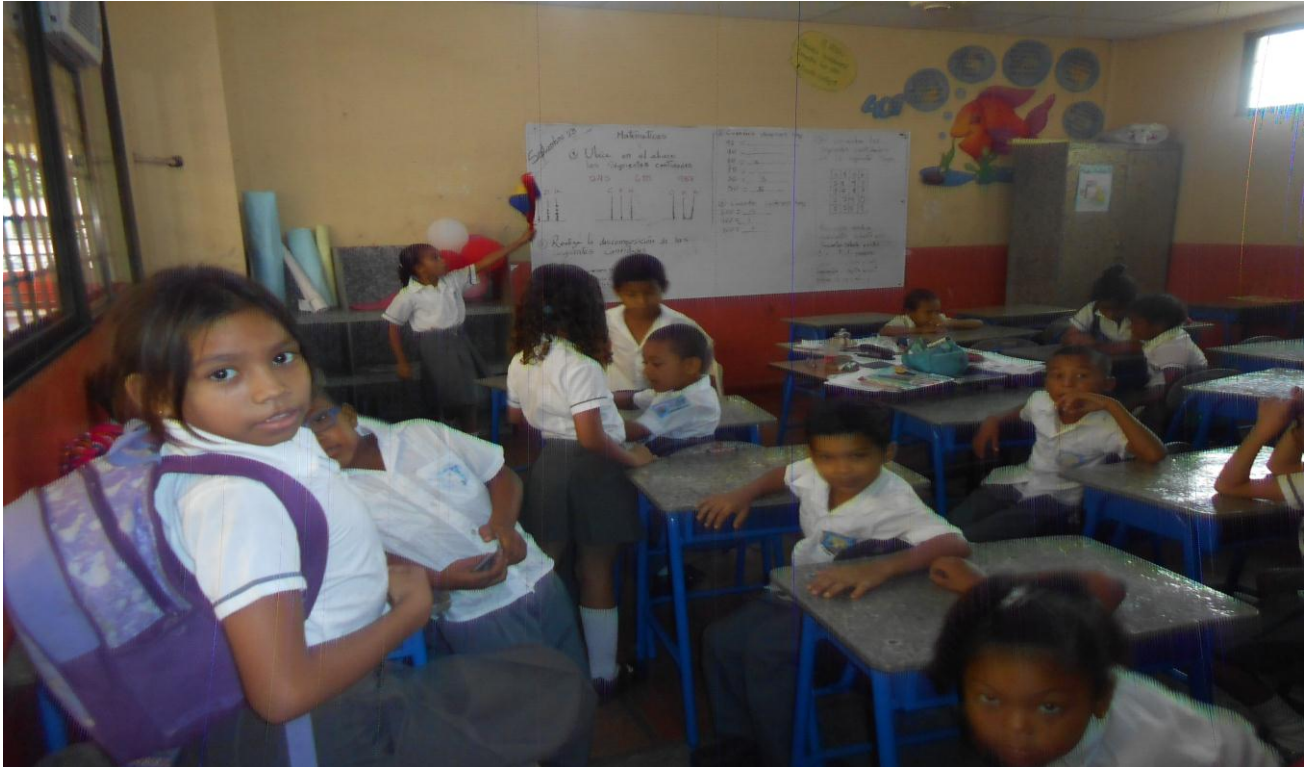
Estudiantes desmotivados durante el desarrollo de las actividades escolares.