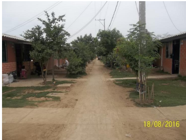
Fotografía 14. Calles Villas de Aranjuez