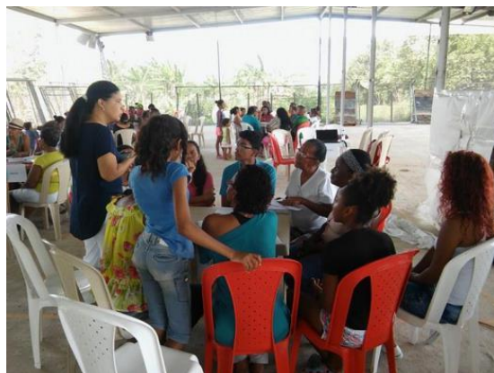
Fotografía 23. Mesas de trabajo, cancha de Tejo