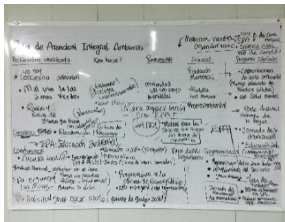
Fotografía 29. Mesas de trabajo Rutas de Atención Integral, instalaciones PES (a)