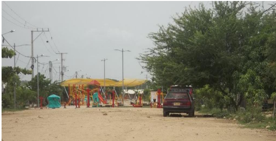
Fotografía 3. Parque Biosaludable, Sector Bolívar Villas de Aranjuez