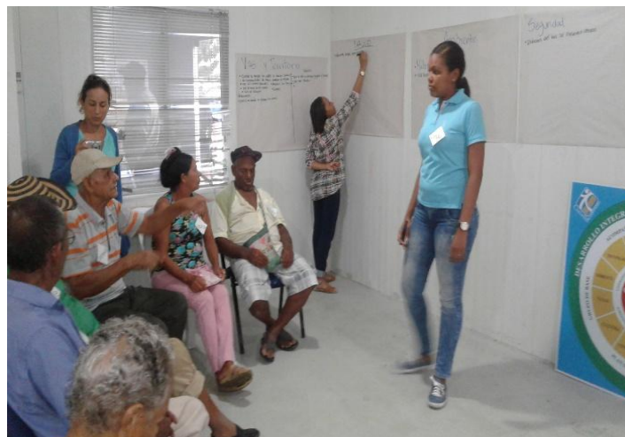
Fotografía 8. Grupo Focal Adulto Mayor, Salones FMSD