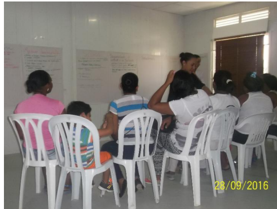
Fotografía 7. Grupos focales con Mujeres, Salones FMSD

construido los sujetos sociales alrededor de su territorio, además se utilizaron como técnicas de investigación social, la observación participante y el grupo focal.