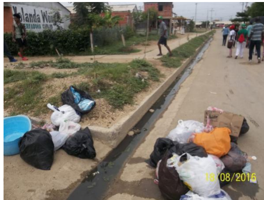
Fotografía 13. Basureros satelitales