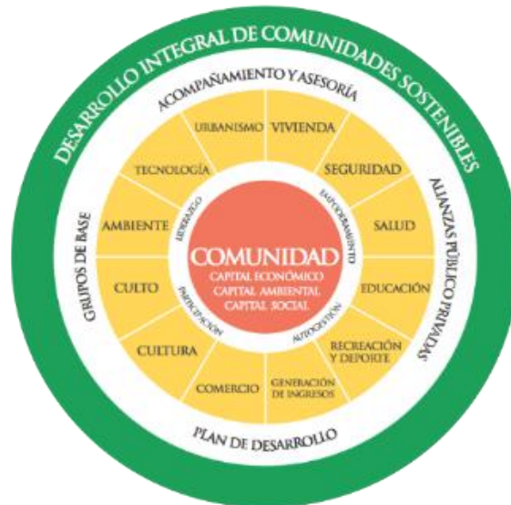
Gráfica 1. Modelo de Desarrollo Integral de Comunidades Sostenibles -DINCS