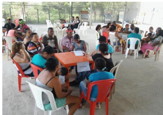
Fotografía 28. Mesas de trabajo cancha de tejo, VA (b)