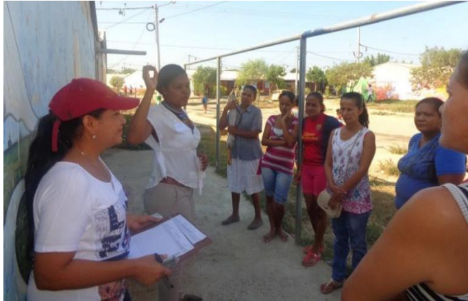
Fotografía 26. Sensibilizaciones, zonas comunes VA