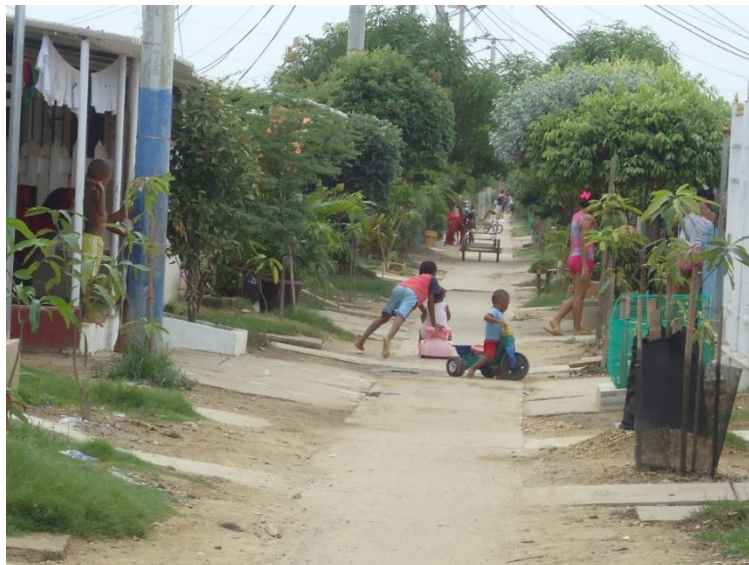
Fotografía 4. Calles de Villas de Aranjuez