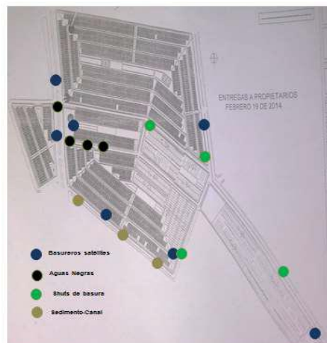
Ilustración 3. Cartografía ambiental