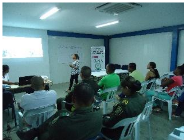
Fotografía 30. Mesas de trabajo Rutas de Atención Integral, instalaciones PES (b)