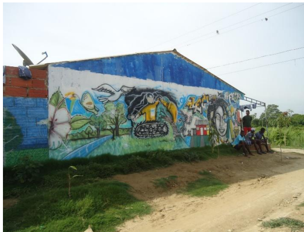
Fotografía 2. Mural Sector Caribe, Villas de Aranjuez

el territorio encontramos organizaciones de base como: Juntas de acción comunal, asociación de vecinos, grupo juveniles, grupo de adultos mayor, frentes de seguridad. Además, encontramos la presencia de algunas entidades como: la red unidos (PS), Corvivienda y el Programa de Naciones Unidas Para el Desarrollo. Dentro de sus características algunos sectores más comerciales que otros. 2