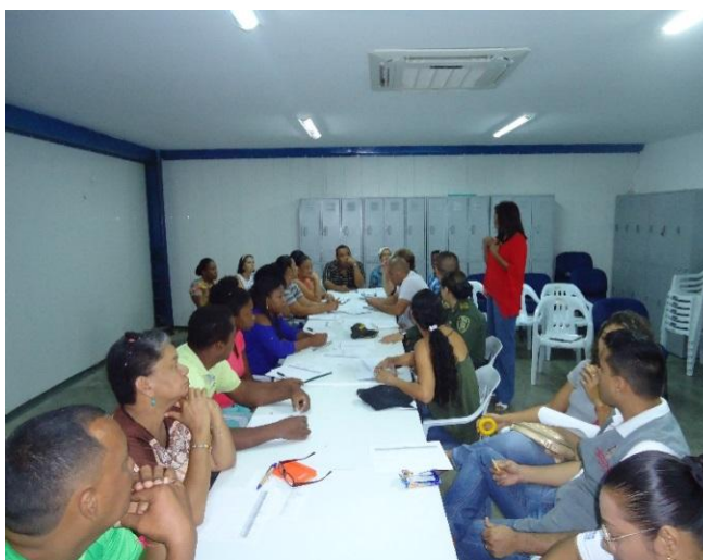
Fotografía 31. Mesas de trabajo rutas de atención integral, instalaciones PES (a)

Las mesas de trabajo se desarrollaron en cuatro días en dos momentos, en el primer momento la socialización del diagnóstico y el segundo la recopilación de la oferta institucional que fue socializada por cada entidad según correspondía a la problemática identificada. En las mismas se contó con la asistencia de 170 asistentes.