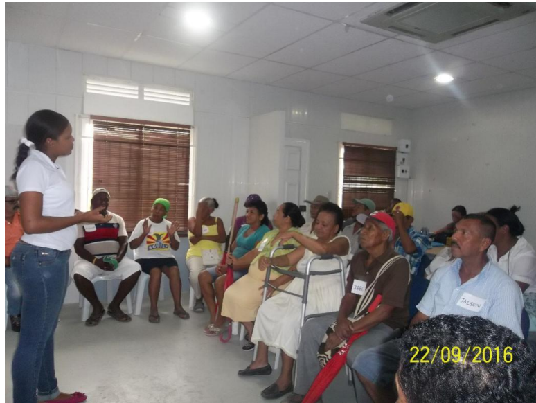
Fotografía 10. Grupos Focales Adulto Mayor, Salones FMSD