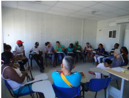
Fotografía 22. Mesas de trabajo, salones FMSD

Los planes de desarrollo para que se ejecuten deben tener el compromiso político para llevarlo a cabo y un excelente soporte financiero. Estos dos elementos se logran por la capacidad de concertación que se tenga logrando el compromiso no solo político para llevarlo a cabo, sino también de entidades privadas, empresarios y de toda la participación de cada uno de los integrantes de la Junta en su gestión.