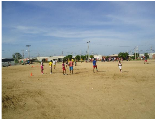
Fotografía 6. Cancha, Sector Península