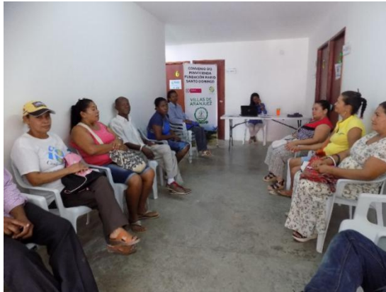
Fotografía 21. Mesas de trabajo e inscripciones en instalaciones del PES, Ciudad del Bicentenario