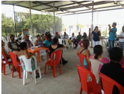
Fotografía 27. Mesas de trabajo cancha de tejo, VA (a)

Las mesas de trabajo se desarrollaron durante 4 horas por 2 días en la cancha de tejo del sector caribe, con la asistencia de 134 personas.