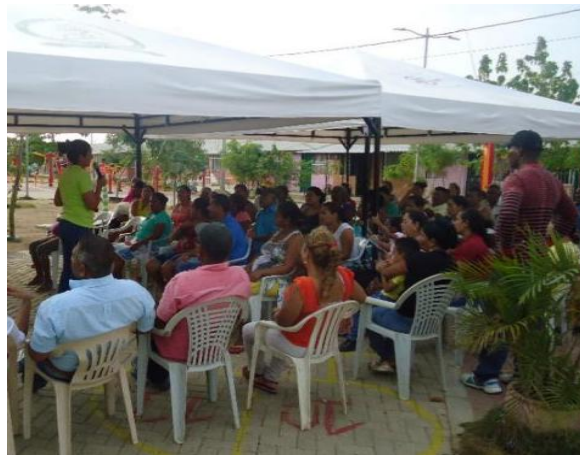
Fotografía 1. Socialización Parque Biosaludable, Min. Vivienda