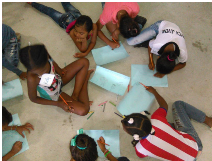
Fotografía 9. Grupo focal con Niños y Niñas, Salones FMSD