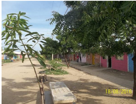
Fotografía 5. Viviendas Villas de Aranjuez

valoración cualquier bien natural que promueva un flujo de servicios ecológicos susceptible de valor económico a lo largo del tiempo.