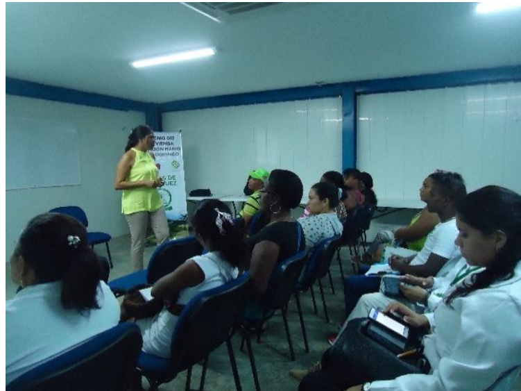
Fotografía 34. Rutas de atención integral, instalaciones PES (b)