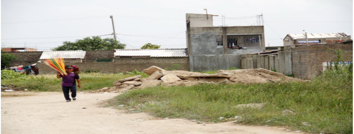
Foto 6. Infraestructura Barrio Villa Zuldany

Fuente: http://www.eluniversal.com.co/cartagena/villa-zuldany-no-tiene-vias-de-acceso-132013