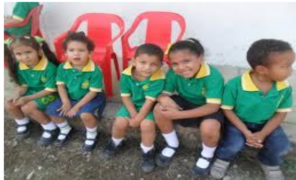
Foto 2. Colegio Juan de Dios Núñez

Fuente: https://www.google.com/search?q=colegio+juan+de+dios+cartagena&espv=2&rlz=1C1NNVC_enCO491CO502&biw=1366&bih=662&source=Inms&tbn=isch&sa=X&ved=0ahUKEwjiN85KyjM_RAhVC5yYKHbuYAq8Q_AUICSgE&dpr=1#imgrc=sCQV3xuZ36BqWM%3A