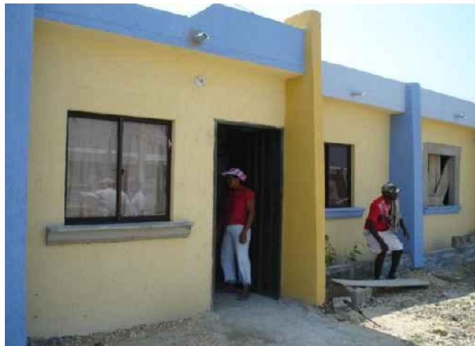
Foto 5. Viviendas Barrio Villa Zuldany

Fuente: https://www.google.com.co/search?q=casas+barrio+villa+zuldany+cartagena&espv=2&biw=1280&bih=918&source=lnms&tbm=isch&sa=X&ved=0ahUKEwjnhIaU1pfSAhXGJiYKHxhABmIQ_AUIBygC