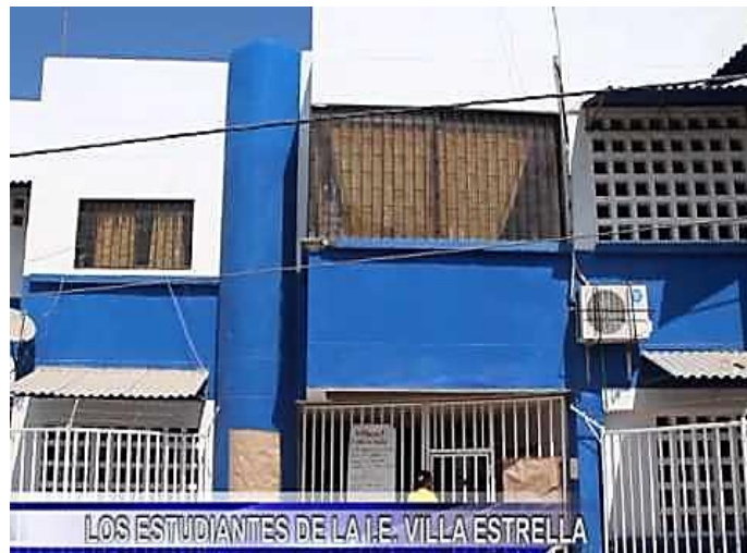
Foto 1. Institución Educativa Villa Estrella

Fuente: https://www.google.com/search?q=Instituci%C3%B3n+Educativa+Villa+Estrella&espv=2&riz=1C1NNVC_enCO491CO502&biw=1366&bih=662&source=lnms&tbn=isch&sa=X&d=0ahUKEwjn3KjggM_RAhXH8CYKHWazBTQQ_AUIBygC&dpr=1#imgrc=Zup7G98_NNv3FM%3a .