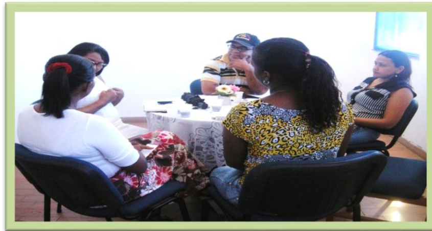
Foto 7. Reuniones de Concertación

Con relación a la metodología tratada en esta etapa, bajo el componente de Promoción, se realizaron visitas a actores claves, identificados al momento de visitas y aplicación del instrumento, seguidamente se verificaron números de teléfonos de actores, en el directorio creado, se efectuaron llamadas telefónicas a actores para concertar reuniones, donde se socializo el proyecto y se les invitó a formar parte del primer grupo interinstitucional comunitario para trabajar en conjunto y dinamizar procesos comunitarios.