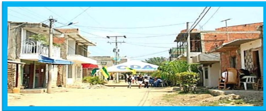
Foto 3. Vivienda Villa Estrella

Fuente: https://www.google.com/search?q=vivienda+villa+estrella+cartagena&espv=2&rlz=1C1NNVC_enCO491CO502&biw=1366&bih=613&source=Inms&tbn=isch&sa=X&ved=0ahUKEwji_MHEkc_RAhXL4CYKHadIBMMQ_AUIBygC&dpr=1#imgrc=2mLLHe15pL5ZuM%3A