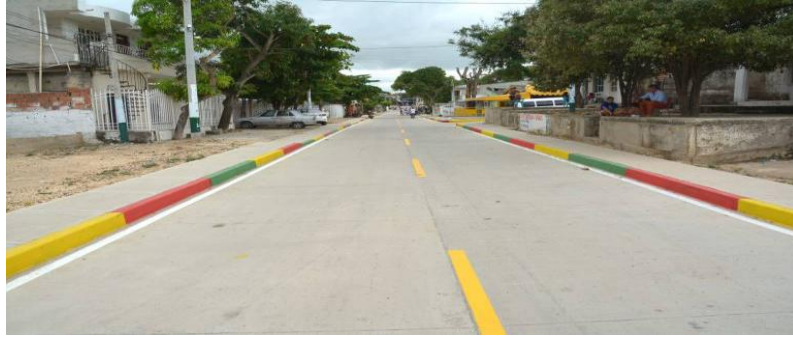
Foto 4. Infraestructura Barrio Villa Estrella