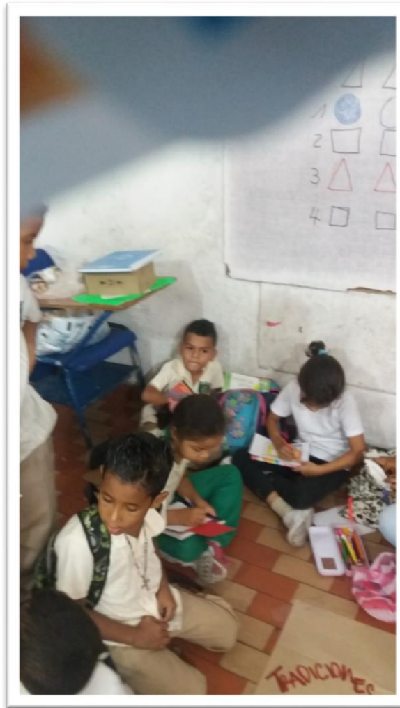
Estudiante realizando la actividad