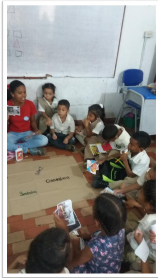
Practicante dando la explicación de la actividad