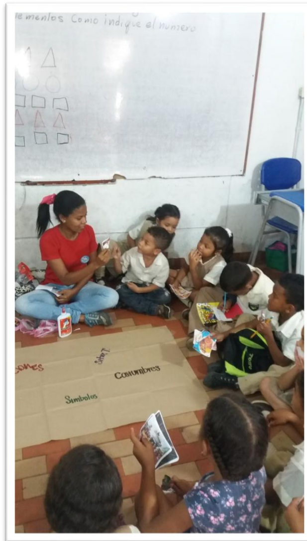
Estudiantes atentos a la actividad propuesta