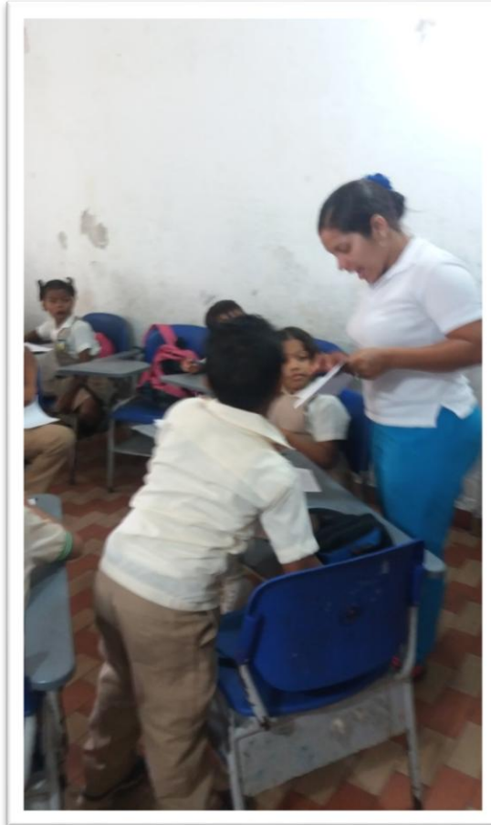
Practicante de pedagogía explicando la actividad.