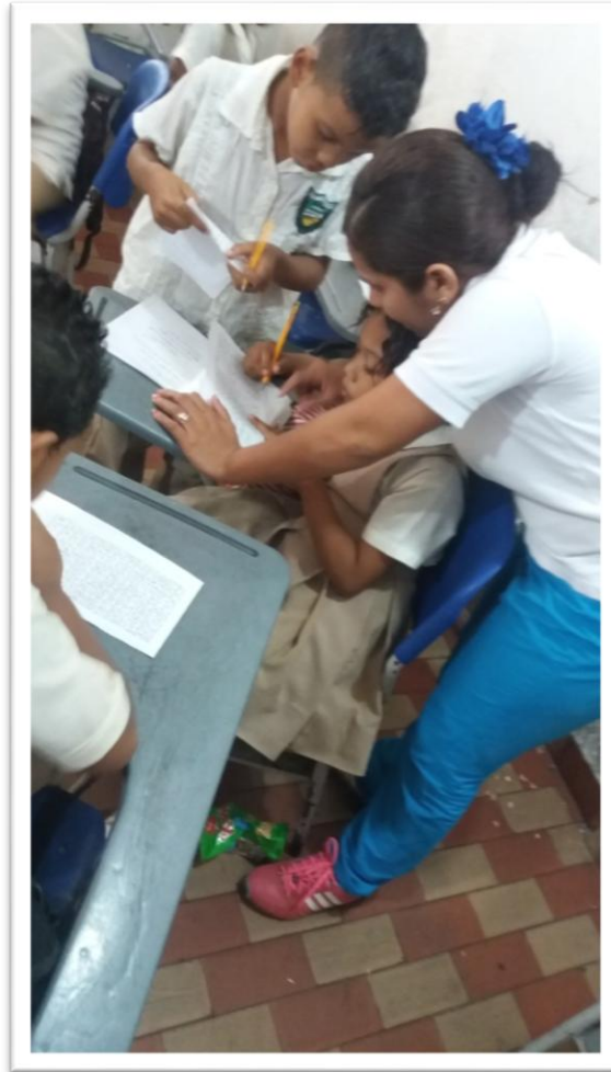
Practicante realizando el acompañamiento durante las actividades