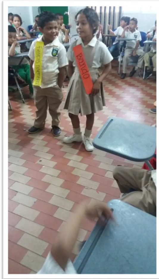
Desarrollo dela actividad propuesta