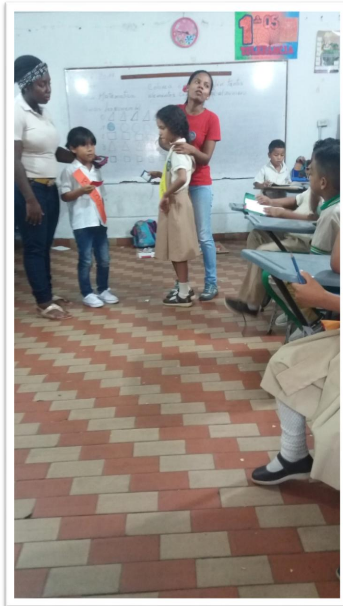
Estudiantes participando de la actividad.