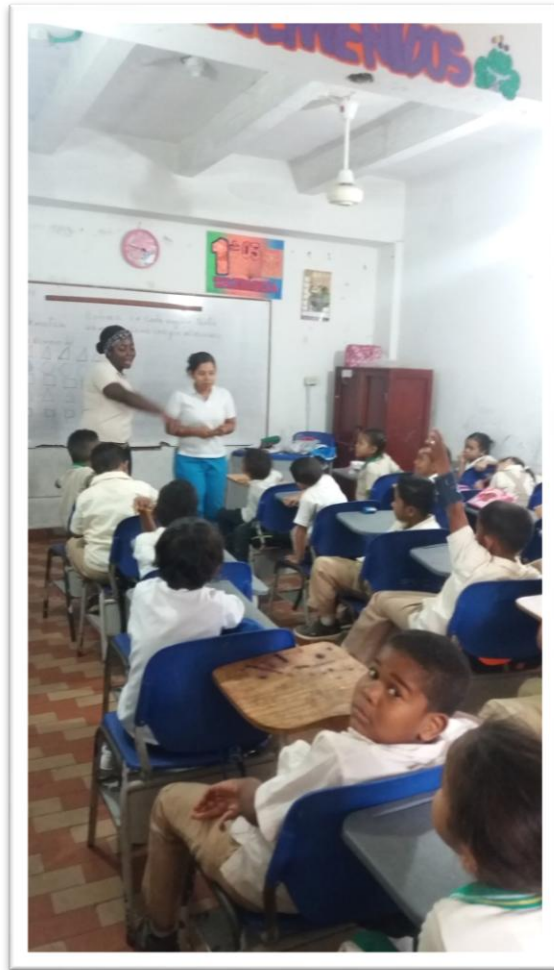
Practicantes de pedagogía dictando las reglas de la actividad