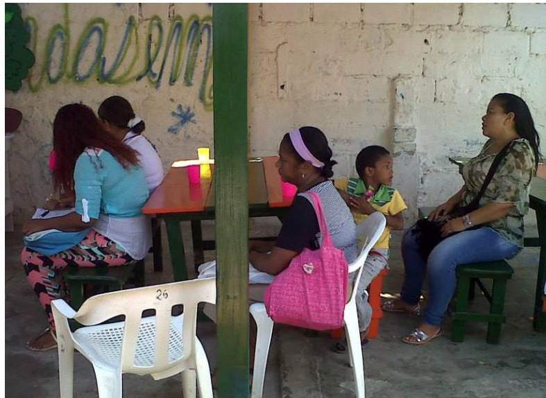
Fotografía tomada por la autora a cuatro madres de familia en FUNDASEM que esperaba la salida a la comunidad.

promoción de la no vulneración de derechos en las personas en especial niños, niñas y adolescentes.