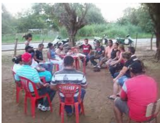
Fotografía tomada por la autora en la reunión en el barrio Nariño, con los habitantes del sector.