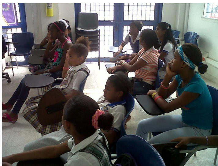
Fotografía tomada por la autora durante la presentación del proyecto en FUNDASEM a los NNA del programa.

La fase de sensibilización consistió en motivar la participación y el compromiso de las familias y los NNA, en el proceso de acompañamiento para llevar a cabo las acciones en la comunidad para el respeto y pleno cumplimiento de los derechos de los NNA, las cuales fueron acciones de promoción, educación y prevención a fin de contribuir a la mejora de su calidad de vida.