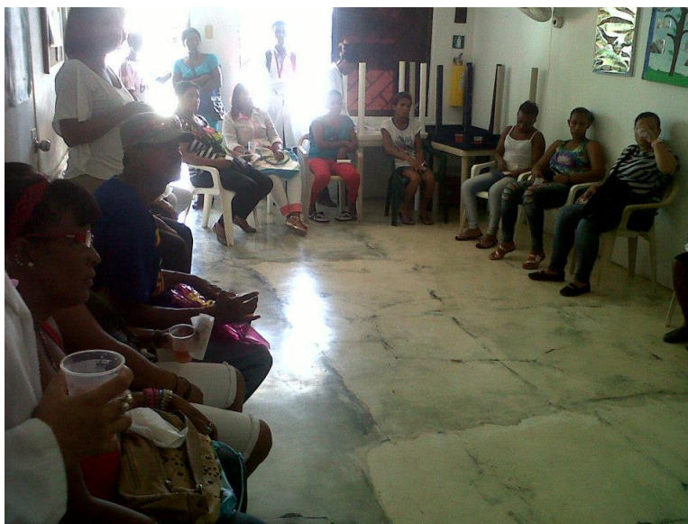
Fotografía tomada por la autora durante la capacitación conociendo todo sobre derechos humanos en FUNDASEM con las familias participantes del proyecto.

En esta actividad la formación es entendida como un planteamiento de preguntas que son las que, en definitiva, orientan la dinámica. Entre los interrogantes fundamentales se encuentra: ¿cuáles son las diferentes concepciones de los Derechos Humanos? , ¿qué actores sociales sustentan unas posiciones y quiénes otras? , ¿por qué asistir a la reconstrucción histórica sobre el origen y evolución de estos derechos? , ¿cuáles son los mecanismos jurídicos de defensa? y, ¿cómo implementar una denuncia ante casos de violación de Derechos Humanos? Estas fueron las preguntas orientadoras para el desarrollo de la actividad educativa, es decir no fueron preguntas hechas a la población, fueron estas las que sirvieron como hilo conductor para el desarrollo de las actividades que fueron abordadas posteriormente.