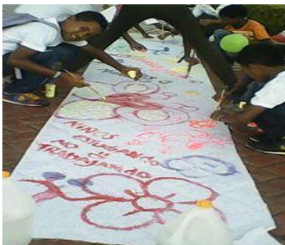
Fotografía tomada por la autora en la creación de carteles en el parque.