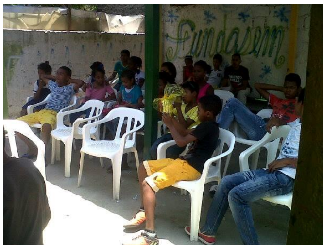
Fotografía tomada por la autora durante la actividad formativa protegiendo sus derechos en FUNDASEM con los NNA del programa.

Las actividades formativas y de capacitación en Derechos Humanos que se crearon, surgieron del interés de retomar el recorrido en el camino de formación como conocedores de sus derechos para incentivar en ellos el empoderamiento y la plena exigibilidad ante las entidades correspondientes y a si realizar las respectivas denuncias.