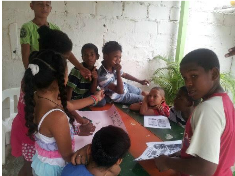
Fotografía tomada por la autora en FUNSASEM en la hora de creación.

“Todos somos hermanos cuidémonos, juntos hacemos mas, familia, estado y comunidad”