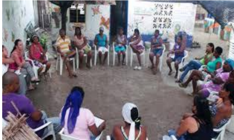
Fotografía tomada por la autora en el barrio Torices sector la unión en la actividad “mis vecinos conocen mis derechos”.

Esta actividad se realizó en sitios acordados con algunos representantes de la comunidad. La metodología implementada fue participativa que partió de sus conocimientos previos y de una manera práctica facilitar la reflexión sobre lo que piensan que es el trabajo infantil, como lo observan en su cotidianidad y el porqué es necesaria su erradicación teniendo en cuenta la vulneración de los derechos de la infancia y la adolescencia que este conlleva. A partir de este primer momento, se generó un espacio de diálogo que permitió plantear que se podría lograr o hacer en conjunto con la comunidad. Para ello se organizaron grupos de cinco personas que debían trabajar sobre los siguientes aspectos: