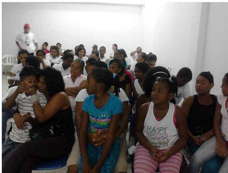
Fotografía tomada por la autora en la actividad formativa en la biblioteca de FUNDASEM.