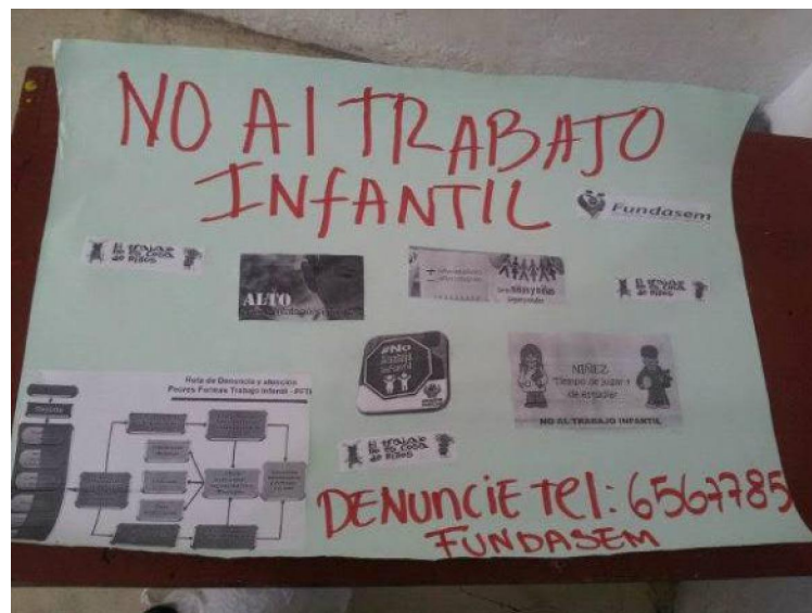
Fotografía tomada en FUNDASEM a los carteles creados por las familias y los NNA para la campaña.