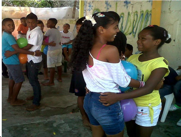
Fotografía tomada por la autora en actividad lúdica con los NNA en FUNDASEM.

La participación fue activa además del interés por la temática tratada y la asistencia fue buena.