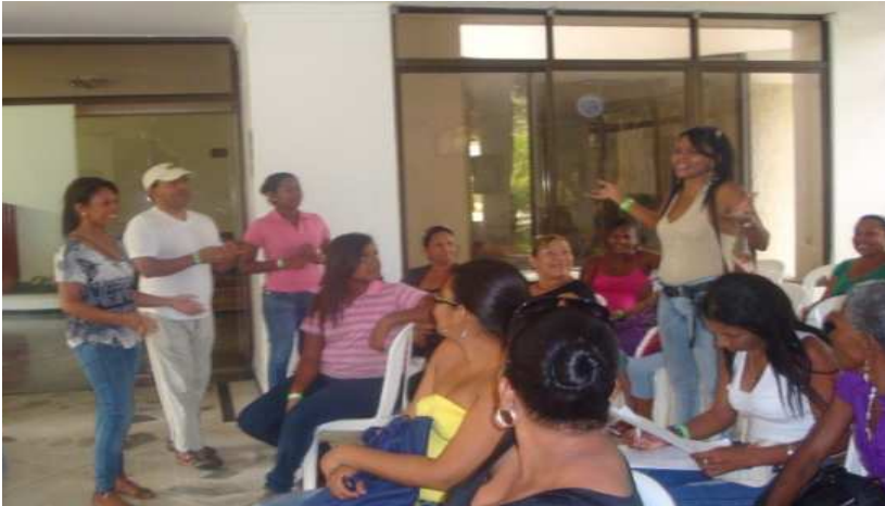
Imagen 1. Actividad de integración: “aprendiendo a valorarme”

Primer Encuentro Formativo “Rescatando El Valor De La Mujer”. Grupo De Viudas Y Madres De Héroes Caídos En Acción.