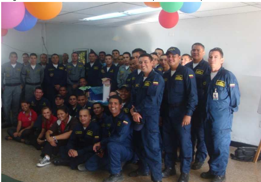
Imagen 17. Asistentes al encuentro formativo paternidad responsable.