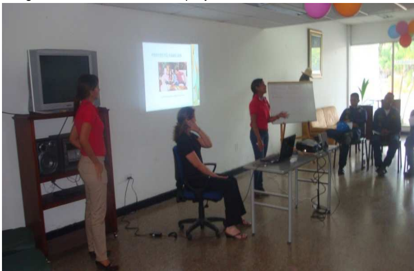
Imagen 12. Dirección del Taller proyecto familiar. ARC Caldas.

TERCER ENCUENTRO FORMATIVO: "APRENDIENDO A VALORAR MI FAMILIA". ARC CALDAS.