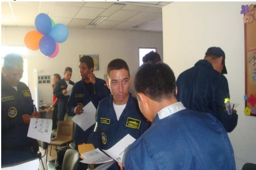
Imagen 4. Dinámica: “la pelota preguntona” .ARC Padilla

BRIGADA DE ATENCIÓN Y ORIENTACIÓN SOCIO LABORAL. “LA CONVIVENCIA Y EL BUEN TRATO EN EL TRABAJO”.