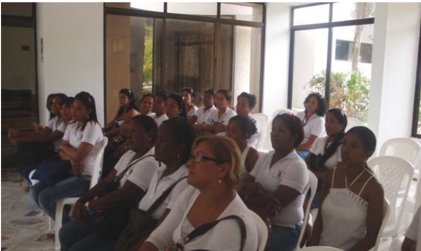
Imagen 2. Taller “manejo del duelo”