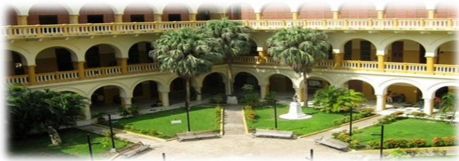
Ilustración 1. Universidad de Cartagena, sede San Agustín Cra. 6, #36-100, Calle de la Universidad