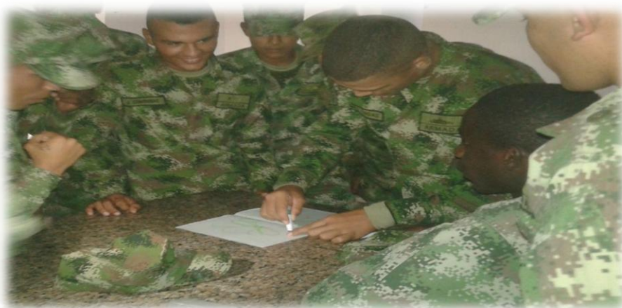
Ilustración 6. Taller Buen Trato