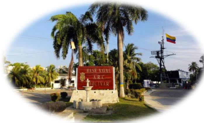
Ilustración 2 Base Naval ARC " Bolívar"