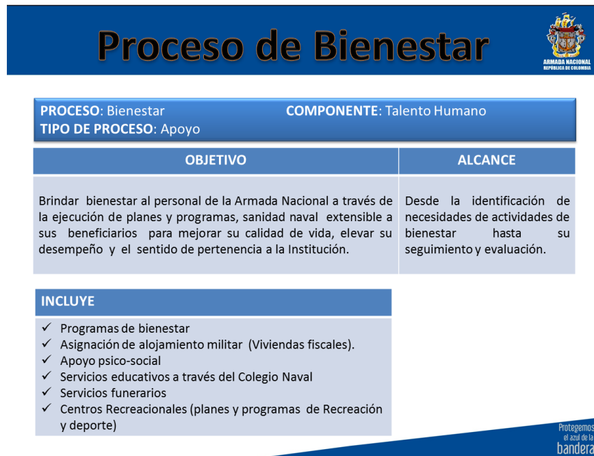
Ilustración 3. Generalidades del proceso de Bienestar

MISIÓN. El departamento de bienestar social BN1 a través de un esfuerzo continuo implementará métodos de control interno, calidad total y desarrollo organizacional que permitan brindar una atención integral al usuario con proyección a su familia, por intermedio de los servicios de educación y bienestar social.