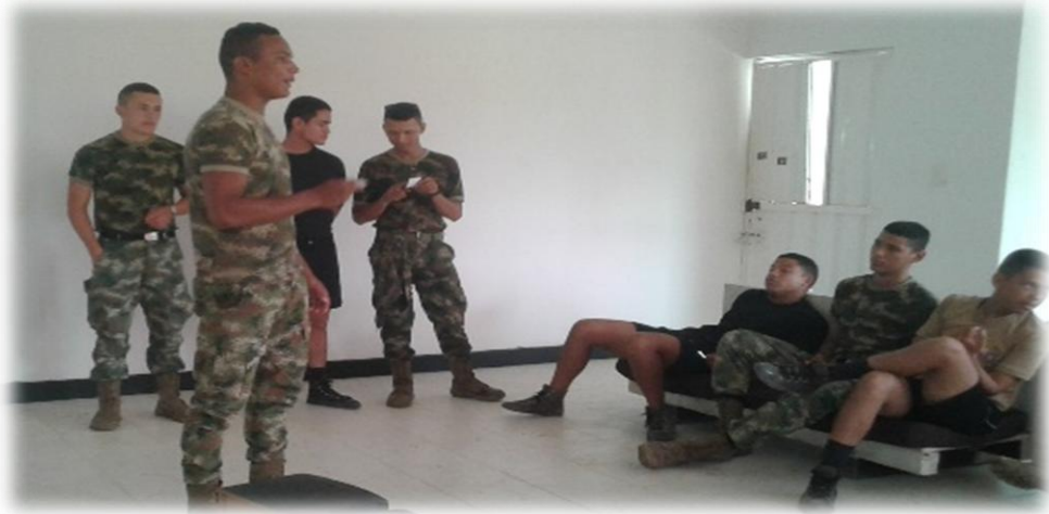
Ilustración 5 Infantes de Marina Regular de La Compañía de Seguridad Estación Naval Tierra Bomba

Acreditación Institucional de Alta Calidad Resolución 2583 del 26 de febrero de 2014. Ministerio de Educación Nacional