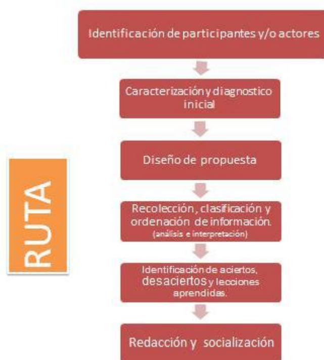
Gráfica 1. Metodología

En la presente sistematización, la intervención profesional de trabajo social, se realizó principalmente con niños y niñas de 2 a 5 años y sus familias, por ello esta misma está respaldada a través de teorías, leyes, políticas y autores.