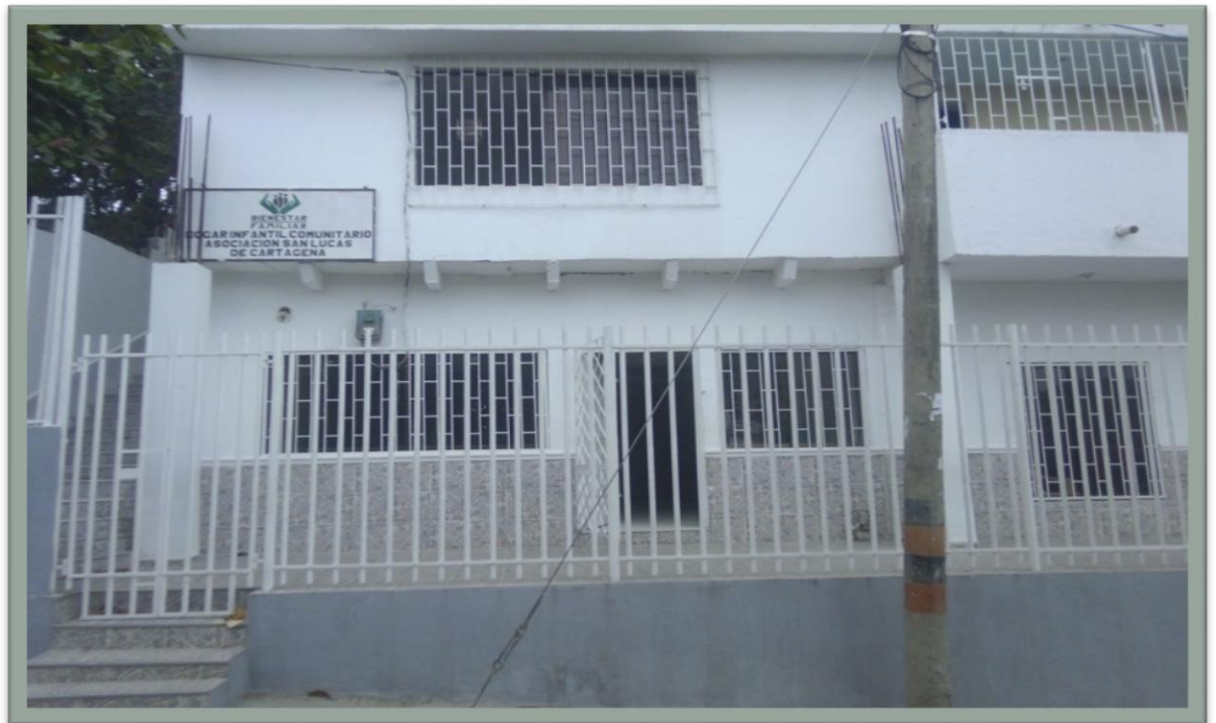
Imagen 1: Hogar Infantil San Lucas de Cartagena