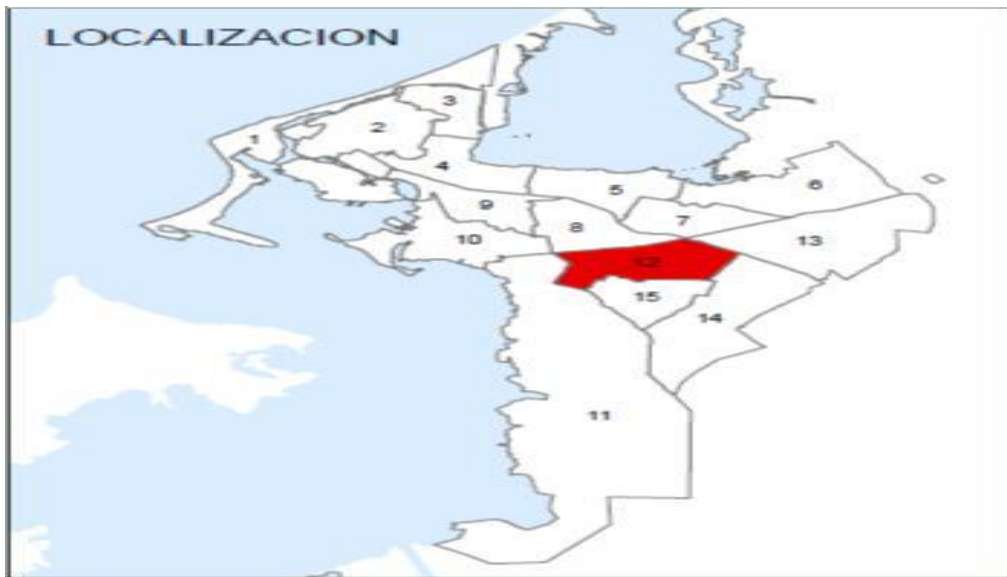
Imagen 2: Localización del HIC San Lucas Cartagena

Los 85 niños y niñas hacen parte de 82 familias, residentes en los barrios, El Carmelo, San Pedro Mártir, entre otros barrios aledaños. Según el presente cuadro se puede evidenciar que el 52 % de la población beneficiaria del programa es femenina y el 48% es masculino, lo que indica que la población mayor activa es de género femenino, sin embargo no es relevante la diferencia entre ambos géneros.