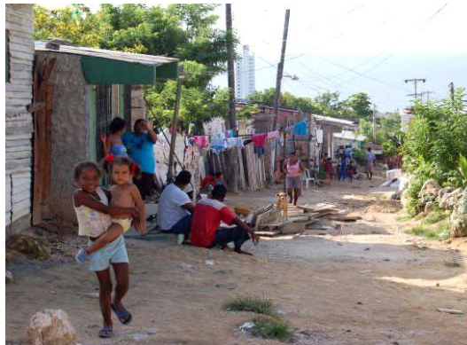
Imagen 3. Comunidad

Expendio de drogas, sitio de consumo de adictos y punto de vigilancia de ladrones que asechan en las noches a los transeúntes, es en lo que se ha convertido el lugar donde la Virgen de El Zapatero presencia todo. Las 24 horas del día, esta Virgen es confidente de los crímenes que sus moradores cometen. Delitos silenciados y que pasan desapercibidos a pesar de que muy cerca opere un CAI de la Policía.