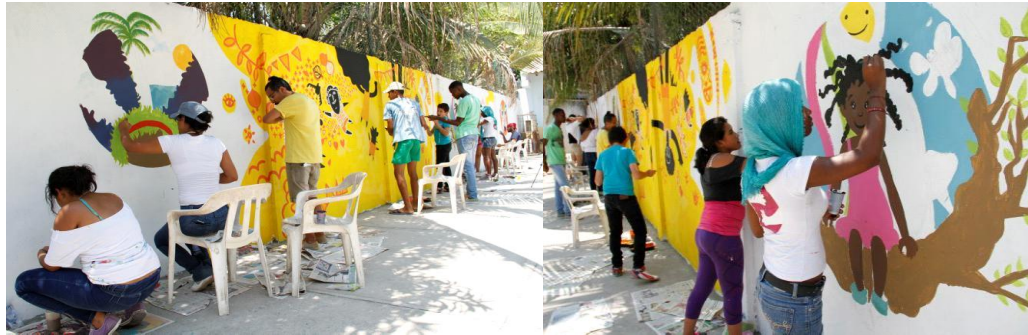
Imagen 4. Murales