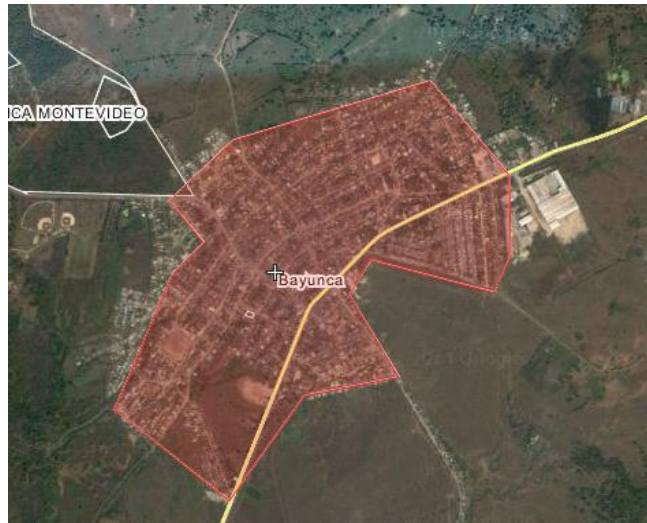
Imagen 4. Ubicación Bayunca