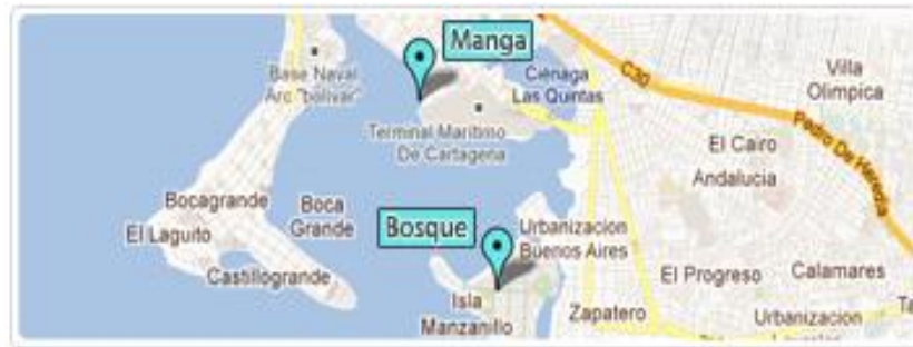
Imagen 1. Ubicación Barrio El Zapatero