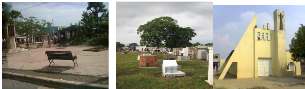
Imagen 6. Lugares de Bayunca

Plaza de Bayunca, cementerio de Bayunca e Iglesia de Bayunca, 2016.