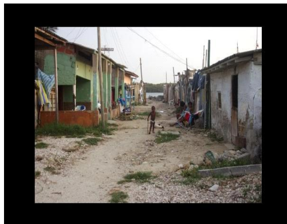
Imagen 2. Calles del Barrio

El barrio El zapatero está localizado al sur este de la Isla de Manzanillo, a orilla del Caño del Zapatero, colinda con los barrios Manzanillo, a su derecha el barrio Gustavo Lemaitre que lo separa una calle y hacia la parte de abajo con Cartagenita también separado por una calle. El barrio es habitado por personas de estrato bajo, está conformado por casas y tiendas informales y algunos establecimientos también informales. La principal ocupación de las personas que habitan aquí es la pesca artesanal y negocios ilegales (venta de droga y prostitución).