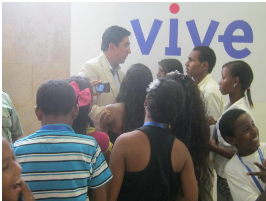
Tomada por: Laura Padilla, 5 de Septiembre de 2012