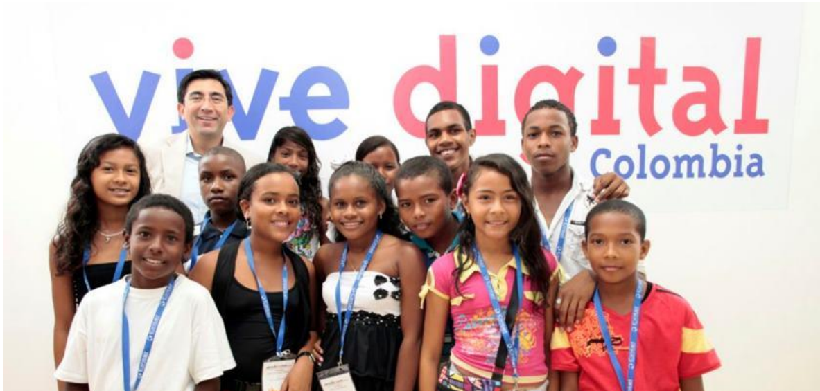
5 de Septiembre de 2012