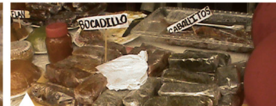
Dulces típicos de mango