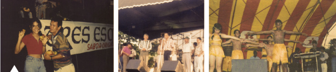
Antiguas tarimas patrocinadoras, animadores musicales y grupos de baile malaganeros