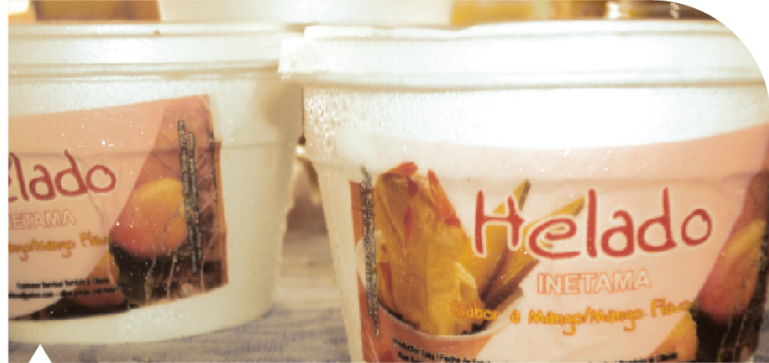
Helado a base de mango realizado con estudiantes del colegio bachillerato de Malagana

parte de esta realización, encontrando que el pueblo malaganero espera que su fiesta sea reconocida por su valor cultural para reforzar el sentido de identidad de la misma, pero observando que se ha llegado, para ellos, a un escalón muy bajo por la falta de organización y compromiso del comité organizador y la población en general; se anhela y se espera una festividad llena de riqueza cultural ligada a la exaltación del fruto, que es el eje principal de la celebración.