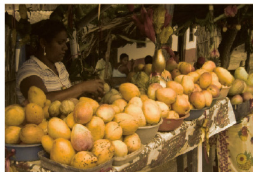
Beisbol, danza Son de Negros, reinas y mango

Su gente es alegre y mestiza, por toda la mezcla racial y cultural que se dio allí en los inicios del pueblo. Se manifiestan culturalmente como profanos y religiosos, apoyando el concepto de su verdadero nombre "San Marcos de Malagana" , celebran su fiesta religiosa, pero también disfrutan de su mayor celebración cultural en el mes de mayo que es el exponente principal de su identidad cultural: