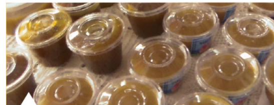
Arequipe de mango