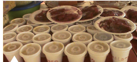
Postres de mango