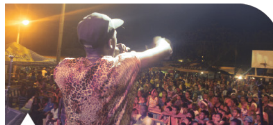
Artista urbano en el marco del festival XXIX