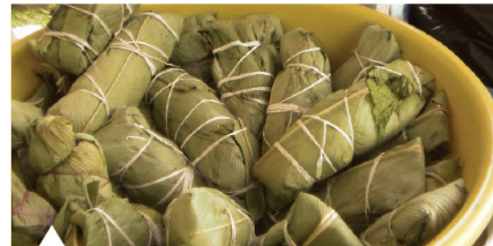
Bollos de mango