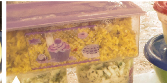
Arroz de mango