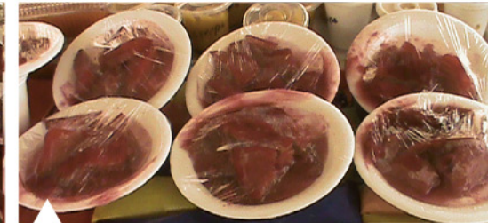
Mango en tentación