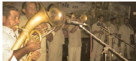
Banda II de Noviembre Rabo Largo

Entre risas, danzas, folcklore y cultura, en 2011 se llega a las "Bodas de Plata" del Festival en su versión número XXV, fue un momento cumbre. A partir de aquí el Festival se conecta al internet. Fotografías, noticias, personajes destacados, sitio propio e invitados especiales, movilizan a la comunidad por espacios para cada subgrupo que forma la junta: artesanos, cocineras, músicos y modelos.