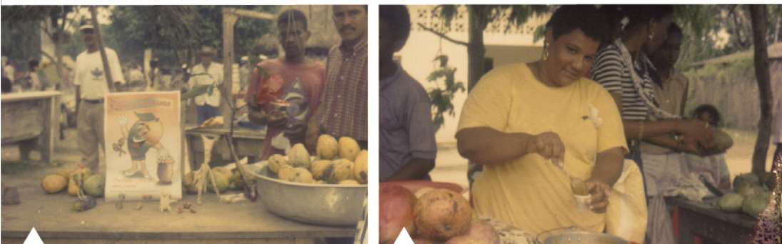
Antiguo puesto de venta de mango