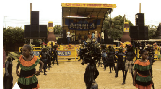
Grupo de danza infantil Son de Negros