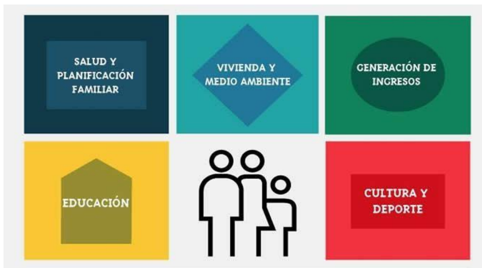
Grafica 1. Modelo de Recuperación Integral Fundación Granitos de Paz