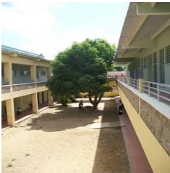
Sede San José Claveriano