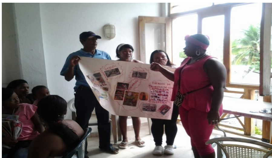
Encuentros de familias

Los avances que se lograron fueron por un lado la sensibilización y el inicio del proceso de las capacitaciones de los líderes y lideresas del corregimiento de la Boquilla sobre la ESCNNA y el papel que como veedores cumplen a la hora de disminuir los casos ESC, igualmente se logró la sensibilización de los padre, madre de la importancia de que los NNA reciban atención integral para la superación de la situación de ESC que se ha vivido, también se logró la vinculación de algunos padre, madres y/o responsable de los NNA en los espacios de encuentros de familia y la participación activa en los mismo.