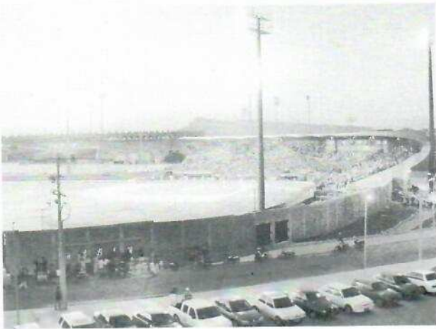
Foto Cortesía: Libro Memorias Históricas del Béisbol de Bolívar y Cartagena - Año 1956 - Estadio Once de Noviembre de Cartagena (Partido de la Liga de Béisbol Profesional Colombiano)

Cartagena, mar de alegrías y recuerdos, vivió esa identificación plenamente con los equipos de Getsemaní y San Diego en sus años de consolidación. El béisbol en el Caribe, tanto aficionado como profesional, creaba héroes, aglutinaba comunidades, creaba rivales y generaba recursos. Sus múltiples estructuras creaban oportunidades para equipos y jugadores talentosos, apoyados por la sociedad.