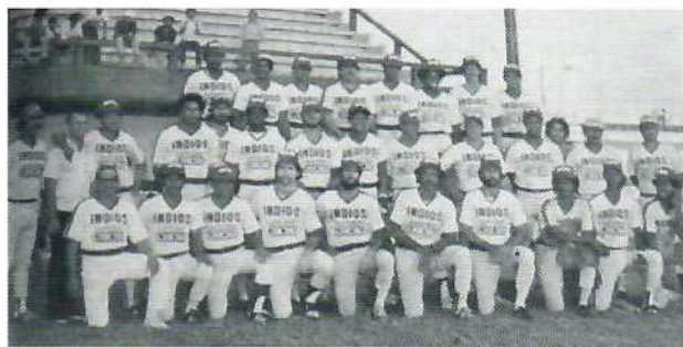
Foto Cortesía: Libro Historia del Béisbol Profesional en Colombia, Autor Raúl Porto Cabrales - Equipo Indios de Cartagena, campeón en 1948.

Fue negociado por Sammy Stewart el 17 de diciembre de 1985 a los Baltimore Orioles, asignado a las ligas menores al Rochester Red Wings en 1986; siendo relevado al equipo de Ligas Mayores, ese mismo año hasta 1987, acumulando 64 juegos, 8 carreras y 27 hits.