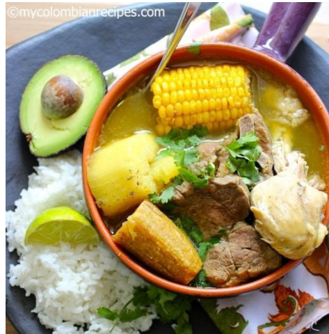
Ilustración 4. Sancocho Trifásico / Three Meats Sancocho (tomado de página web my colombian recipes: Dinho, 2013)

En la página web de My Colombian Recipes, se puede encontrar la receta escrita en inglés y en español; esto puede aprovecharse para que el profesor haga ejercicios de comparación.