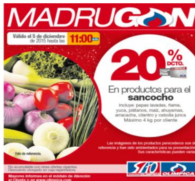
Ilustración 1. Anuncio publicitario supermercado Olímpica

El texto que escogimos para llevar a cabo la propuesta es un anuncio publicitario virtual del supermercado Olímpica, que hace alusión a la oferta de los alimentos relacionados con la preparación de un plato típico de la ciudad: el sancocho.