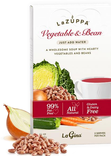
Ilustración 3. Anuncio de caja de sopa instantánea

▪ En nuestra búsqueda, no vimos anuncios semejantes en otras partes del mundo; los más cercanos se refieren a venta de sopas ya preparadas como la que se muestra en la siguiente ilustración. Este puede ser un motivo de conversación sobre diferencias culturales.