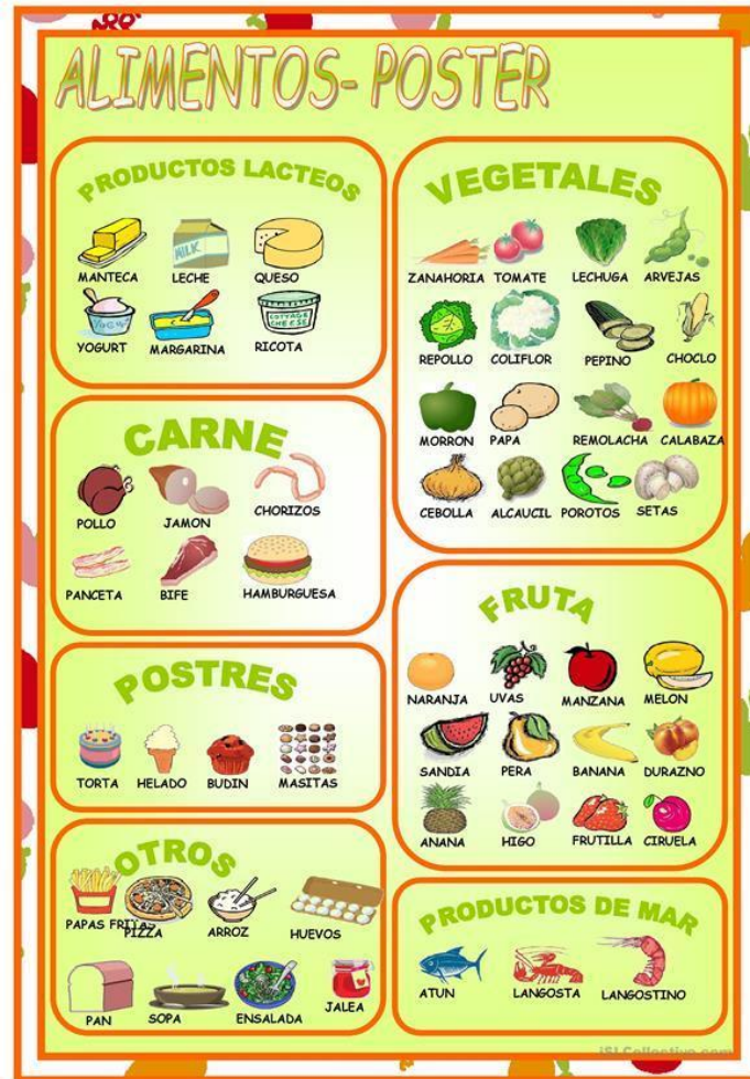
Ilustración 2. Poster alimentos (tomado de página web islcollective: ALIMENTOS - POSTER, 2011)

▪ Llevar la propaganda de Olímpica y compararla con las de sus países, desglosando su estructura como texto (el profesor debe definir y analizar las partes de una propaganda junto a sus estudiantes), compararlo con el vídeo y con una receta, opcionalmente. Introduciendo así el tema de los géneros textuales.