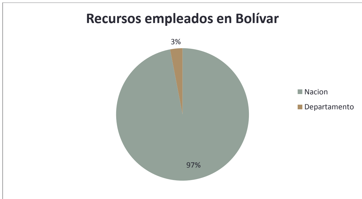
Grafico 3. Recursos empleados en atención de la Ola invernal 2010-2011 en el Departamento de Bolívar

Fuente: Informe de rendición de cuentas periodo 2008-2011 y Colombia Humanitaria.