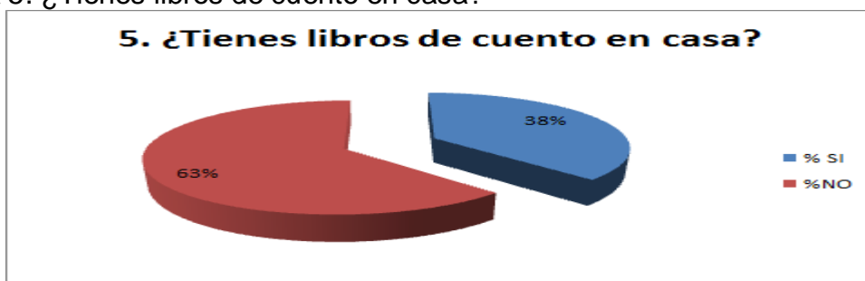
Gráfica 5. ¿Tienes libros de cuento en casa?

La gráfica N° 5 indica que el 38% de los estudiantes encuestados si tiene libros de cuentos en casa, lo que refleja una falta de cultura en la lectura. Por otro lado, el