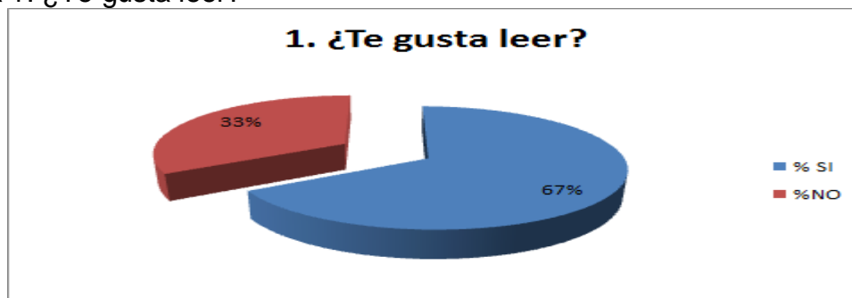
Gráfica 1. ¿Te gusta leer?

En el análisis de la tabla 1 sobre la opinión de los estudiantes sobre su afición por la lectura se observa que al 67% de los estudiantes si les gustaría leer. Al 33% no les gusta leer.