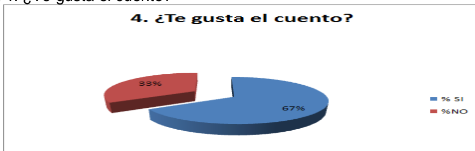
Gráfica 4. ¿Te gusta el cuento?

En la gráfica 4 se observa que al 67% de los estudiantes les gusta leer cuentos y el 33% restante dijo que no. Hay algo positivo en las respuestas y es que a la mayoría les gustan los cuentos lo cual es favorable para motivarlos a leer y también desarrollaren la escritura.