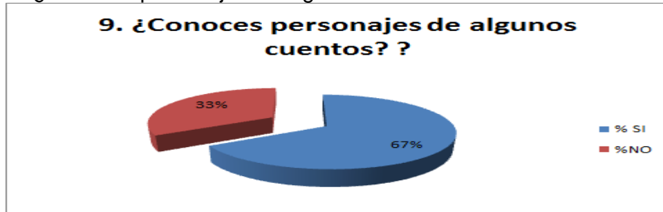
Gráfica 9. ¿Conoces personajes de algunos cuentos?

En el gráfico N°9, el 67% de los estudiantes encuestados dijo que si conoce personajes de algunos cuentos como caperucita roja, mientras que el 33% restante dijo que no. Como se trata de implementar actividades lúdicas con los niños y niñas una de estas podrían ser las dramatizaciones en las cuales ellos representen e los personajes de los cuentos que lean.