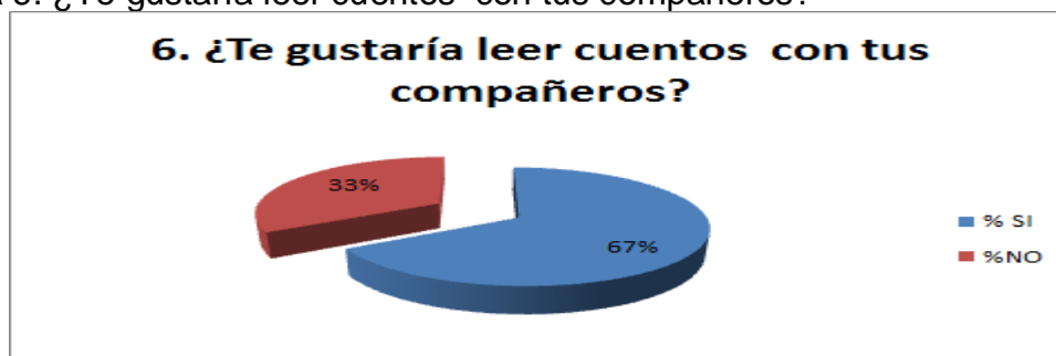
Gráfica 6. ¿Te gustaría leer cuentos con tus compañeros?

En la gráfica 6 se observa que al 67% de los estudiantes si les gusta leer cuentos en compañía de sus compañeros de clase. Lo que puede servir de estrategia para iniciar los procesos de lectura y escritura. Asimismo el 33% de ellos dijo que no les gusta leer en compañía. Por lo tanto, se debe aprovechar que a la mayoría de niños-as les agrada leer cuentos o que se los lean y sería muy provechoso que el docente del área de castellano, frecuencia esta actividad para reforzar los procesos de lecto escritura.