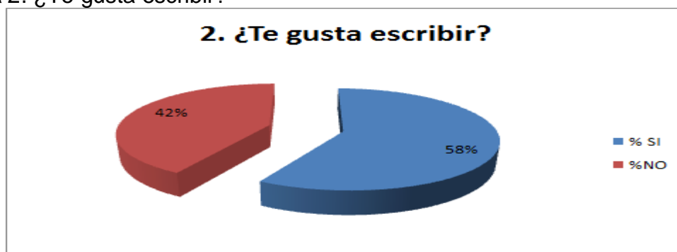
Gráfica 2. ¿Te gusta escribir?

En la tabla y gráfica 2 sobre la pregunta ¿Te gusta escribir?, el 58% de los estudiantes dijo que sí. El 42% dijo que no. Es posible que los estudiantes que respondieron que si estén rodeados de una cultura de lectura y escritura y eso influya en ellos y los motive a escribir.