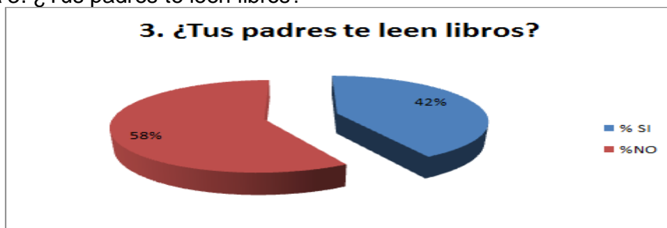
Gráfica 3. ¿Tus padres te leen libros?

En el gráfico N° 3 correspondiente a la pregunta ¿Tus padres te leen libros? Observamos que el 42% de los estudiantes contestó que sí son motivados por sus padres para que lean libros en casa textos. Mientras que el 58% restante dijo que no o hacen. Es evidente que hay un gran número de padres que no motivan a sus hijos a leer, lo cual es preocupante ya que deben ser los primeros en motivar y