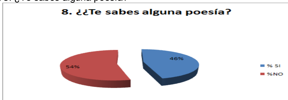
Gráfica 8. ¿Te sabes alguna poesía?

En la tabla y gráfica 8 sobre ¿Te sabes alguna poesía?, el 46% de los estudiantes dijo que sí. El 54% dijo que no se saben ninguna poesía. Es posible que a través de la poesía se enriquezca el vocabulario de los estudiantes y con ella se facilite la adquisición de sonidos que posibilitaran una mejor asimilación de los sonidos de las letras y los grafemas y con ello se motiven a leer y escribir.