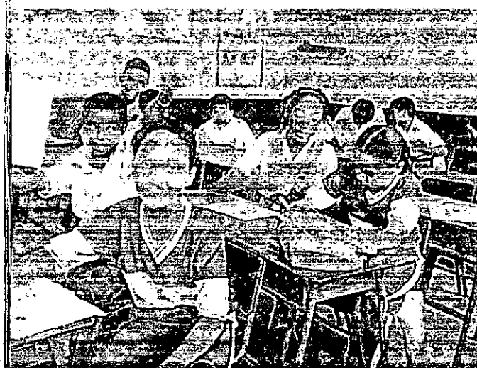
Realización del proyecto de vida

El proyecto de vida es el plan que una persona se traza a fin de conseguir un objetivo, nos permite realizar un diagnostico sobre nuestra situación actual