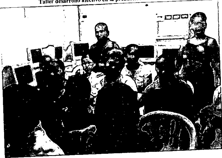
Taller agresividad en los hijos