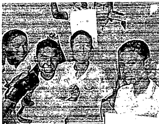
Taller amor y responsabilidad

El concepto de valores se enfoca en la cualidad que percibimos en los seres, consistente en una relación de sentido político entre dicho seres y algún campo de la realización humana. En concordancia el objetivo se cumplió dado que los estudiantes conocían los valores pero no lo asimilaban o practicaban en sus vidas, las estrategias aplicadas en los talleres fueron un apoyo fundamental para generar motivación e iniciativa de los estudiantes en practicar los valores.