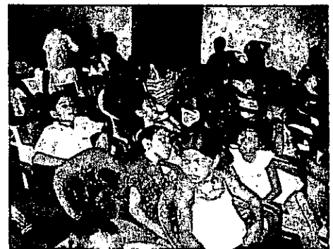
Niños y niñas observando la película Sherek