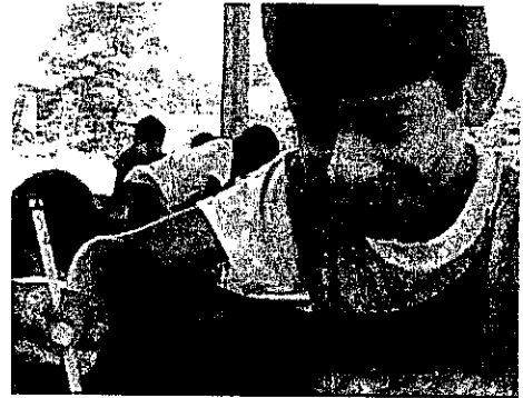
Realizando el taller de Yo Amo a mi Colectivo