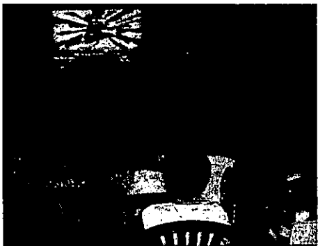
Niños y niñas de los colectivos Rabolargo y el Páramo en un Cine Foro