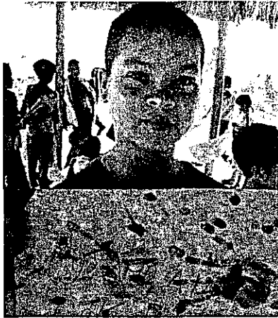
Niño mostrando su trabajo