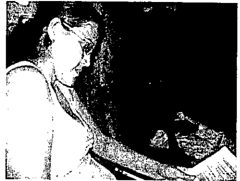
Aplicación de encuestas a los padres y madres de familia de los barrios Rabolargo, las Margaritas y el Páramo