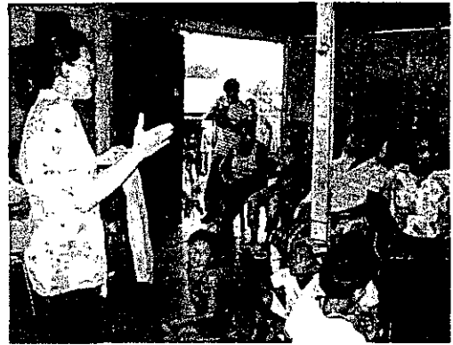
Reunión con padres y madres de familia barrio Las Margaritas