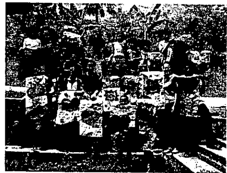
Colectivo Lluvia de Estrellas