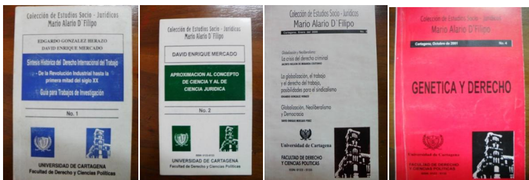
Carátulas de las revistas de la Colección de Estudios Socio Jurídicos Mario Alario D'Filipo No. 1, 2, 3, y 4.