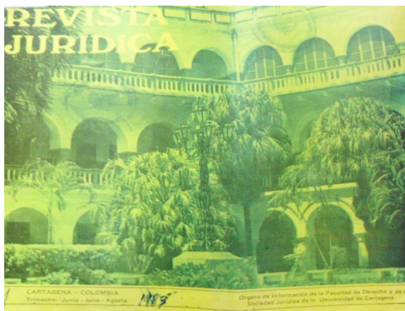
Portada de la Revista Jurídica No.1. Biblioteca José Fernández de Madrid (Hemeroteca) Universidad de Cartagena