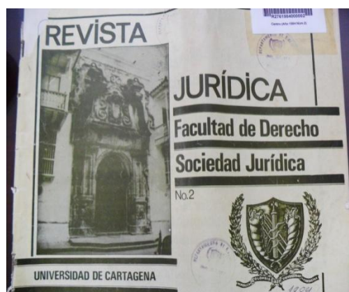
Portada de la Revista Jurídica No.2. Biblioteca José Fernández de Madrid (Hemeroteca) Universidad de Cartagena