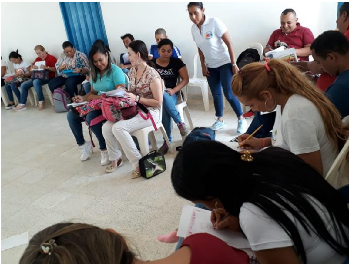
Imagen 3.1: Talleres formativos docentes. Semana de desarrollo institucional. "Leer desde las diferentes disciplinas"