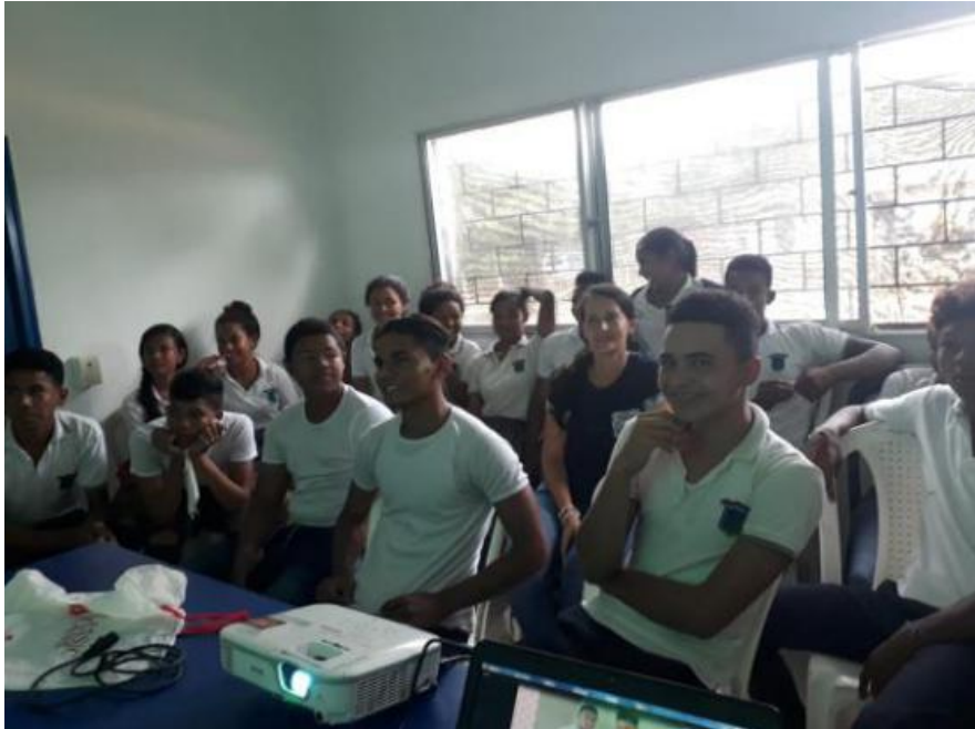
Imagen 5. Estudiantes I.E Las Flores en socialización pruebas

En la actualidad el desempeño o rendimiento de los estudiantes involucra elementos importantes en el análisis que se hacen en las pruebas internas y externas. Prueba de ello, son los bajos resultados de las pruebas “Saber 3, 5 y 9” en los aprendizajes de los componentes semántico, sintáctico y pragmático, pues los estudiantes no leen fluidamente, no identifican la tipología-silueta textual, no extraen informaciones implícitas y explícitas, no prevén temas, intención comunicativa al producir un texto, entre otros, de acuerdo a los resultados pruebas saber 2017 – preguntas incorrectas por competencia publicado por el ICFES en su página institucional y reflejado en las siguientes imágenes.