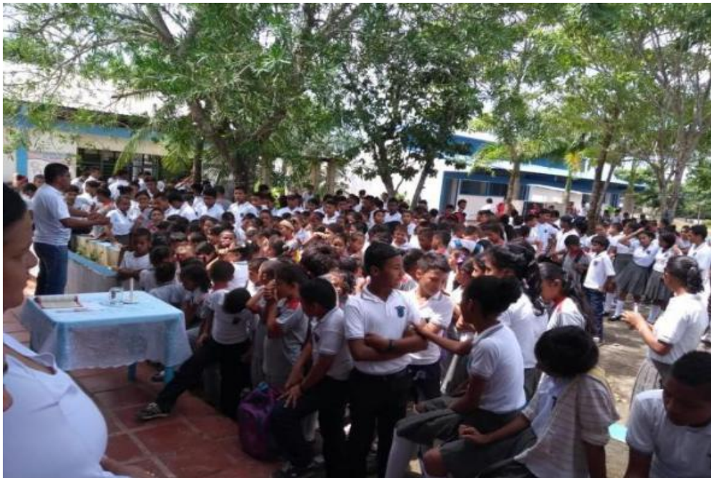
Imagen 6. Estudiantes I.E Las Flores Proyecto

El cuerpo estudiantil de la institución es de 678, distribuidos entre las seis sedes de básica primaria, secundaria y media. Los rangos de edades oscilan entre los cinco hasta los diecinueve años. En el género masculino son 392 y femenino 286 estudiantes. El proceso de aprendizaje según sus ritmos y estilos varía, de acuerdo al interés que le genere el desarrollo de una clase y al