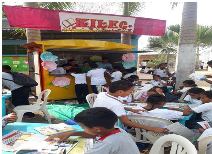
Imagen 1.1. Kiosco Kilec. Presentación del material periodico el merididiano de Córdoba