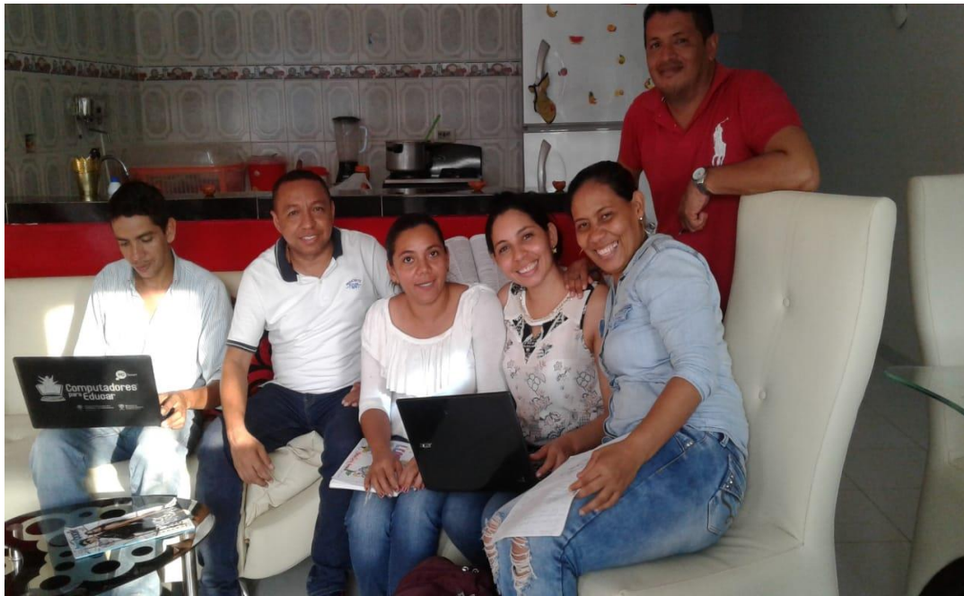
Imagen 8. Encuentro maestrantes y tutor para determinar la problemática a intervenir

El presente relato narra la experiencia de lo que ha sido el proceso investigativo, partiendo desde sus etapas, hasta las diferentes actividades planteadas en el marco del plan de acción. Cabe señalar que dicha investigación no sigue un orden lineal como es el caso de muchas investigaciones en campo educativo, pues ella se enmarca dentro del paradigma de la investigación acción pedagógica, a través de un ciclo constante de reflexiones que invitan a replantear la praxis educativa. Por esta razón, el ejercicio de indagación parte de la observación, análisis y reflexión de las prácticas de aula, las dinámicas institucionales y el contexto sociocultural.