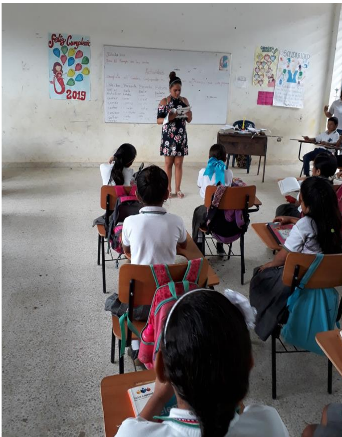
Imagen 1.9: Padres E. Actividad erase una vez