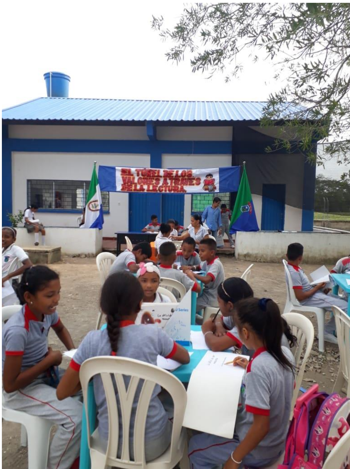
Imagen 1.3. Kiosco Kilec. Tunel de los Valores a través de la Lectura