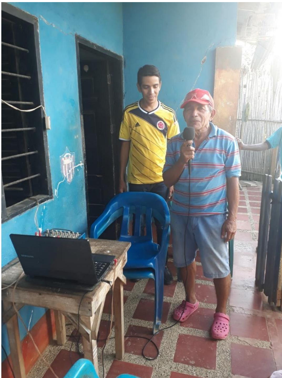
Imagen 1.6. Un rato con Tío Conejo.