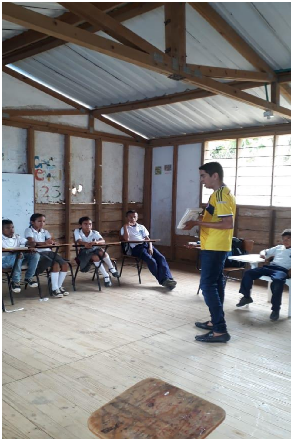
Imagen 1.5. Mochilas Viajeras. Sede Aguas Dulces.