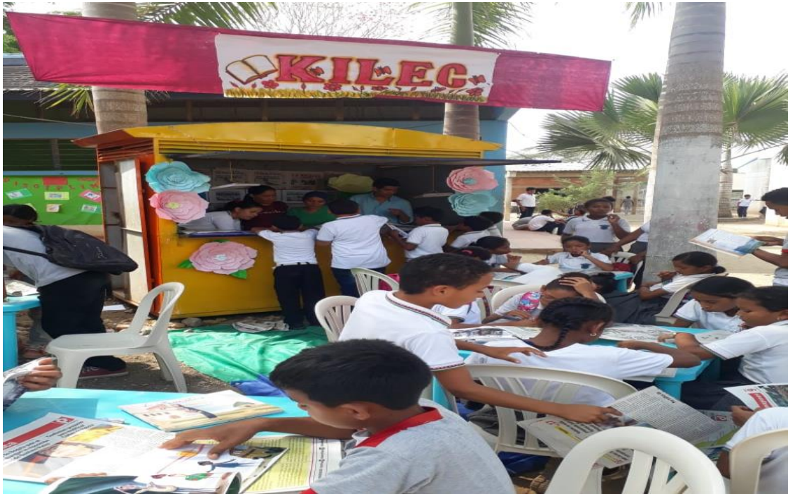
Imagen 10. Apertura kiosko Kilec

Kiosco para la lectura. Estrategia pensada al aire libre que permite el fortalecimiento de la lectura a través del disfrute y placer de la misma. El kiosco está dotado de textos y lecturas de interés como son los periódicos y artículos de opinión, revista, comic y los textos de la Colección Semillas, estos últimos ofrecidos mediante de la estrategia “lectura a la carta”, donde se les ofrece un abanico de títulos de libros que permiten despertar el interés y curiosidad por leerlos.