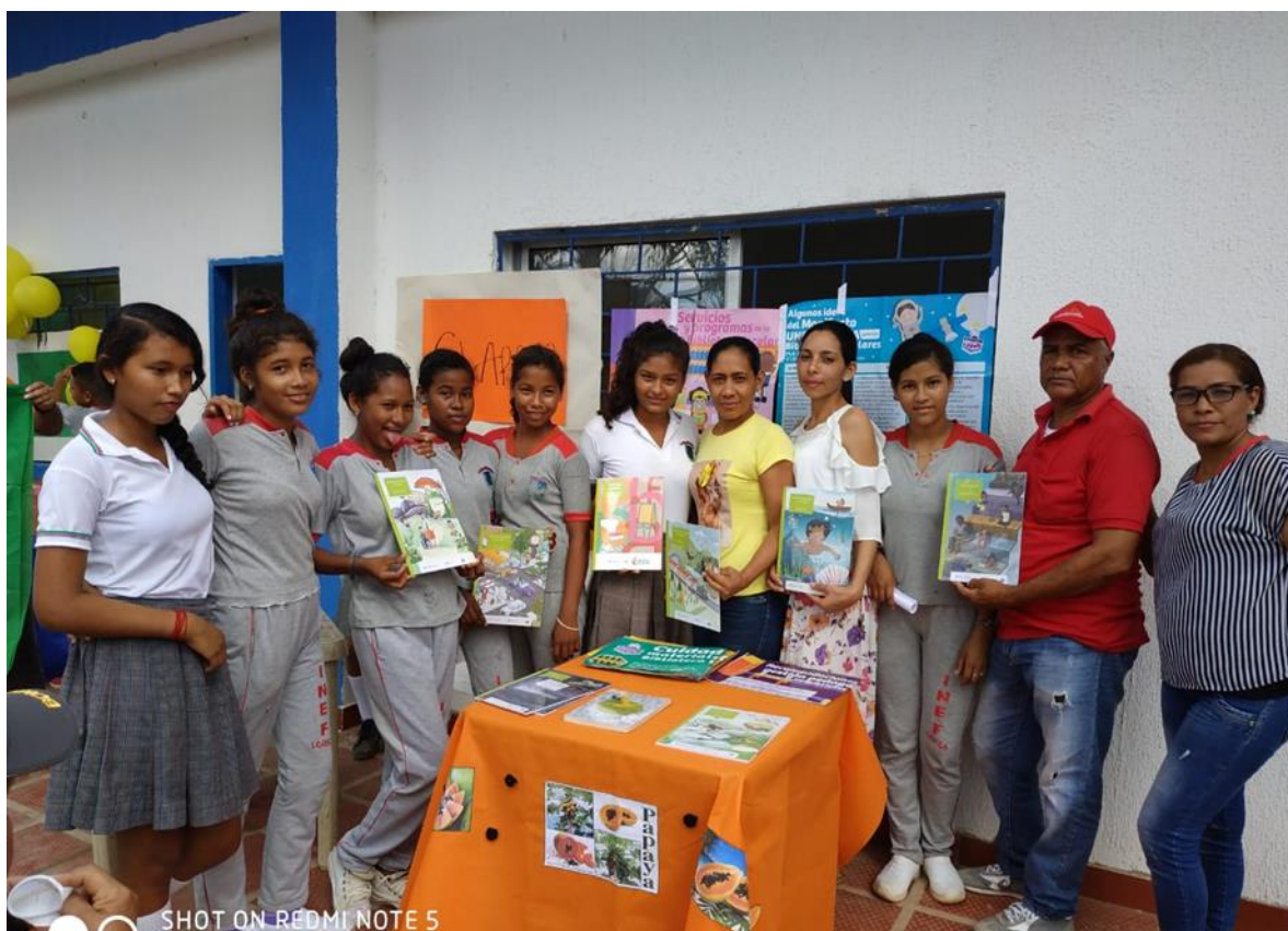
Imagen 1.3. Kiosco Kilec. Donación de Libros