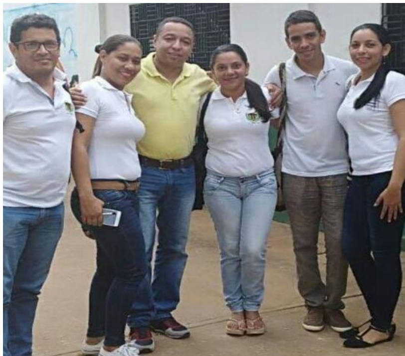
Imagen 1.1. Encuentro con el Tutor.