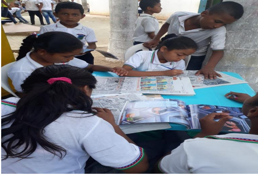
Imagen 9. Jornada de lectura de secundaria a primaria

Es una estrategia creada para el fortalecimiento de la comprensión lectora, cuya finalidad es acercar al estudiante en el mundo de la lectura y la imaginación a partir del disfrute de la misma. Por esta razón, se diseñaron dos actividades como: Kilec (Kiosco para la lectura) y Mochilas Viajeras, las cuales articuladas afianzaron el hábito lector, la motivación por la lectura y las competencias comunicativas