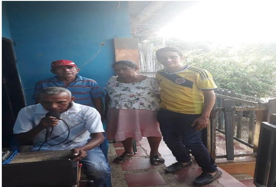
Imagen 13. Un rato con tío conejo en la emisora local

En la apertura de esta estrategia, “Un rato con tío conejo”, el grupo de maestrantes asumen el reto de acompañar a los abuelos que fueron a compartir su sabiduría popular de cuentos tradicionales alusivos al gran protagonista Tío Conejo, uno de los más famosos dentro de la tradición oral y que aún en este contexto sigue vivo gracias a la oralidad que se conserva en las zonas rurales del territorio cordobés. Para ello, uno de los integrantes del grupo hizo la intervención para hacer la invitación de escuchar en horas de las tardes, que generalmente las familias se encuentran reunidas descansando de las labores domésticas y del campo, las narrativas para darle cabida a la imaginación y recreación que se van tejiendo con cada una de las palabras expresadas por la voz quebrantada de los narradores, símbolo del pasar de los años, pero con un rigor de experiencias vividas y una pasión para fortalecer la oralidad de los cuentos populares anónimos de tío conejo.