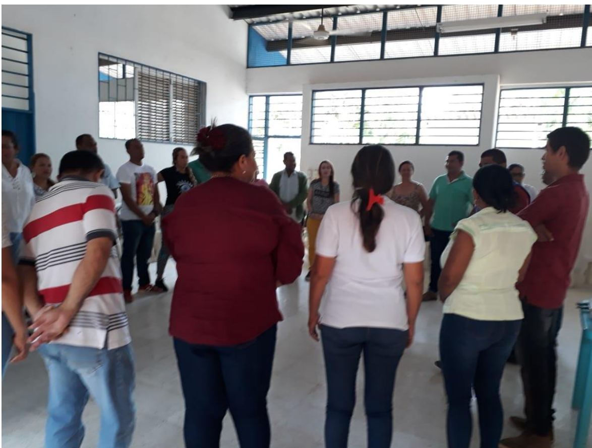
Imagen 3.1: Compartiendo un Texto de una manera diferente.