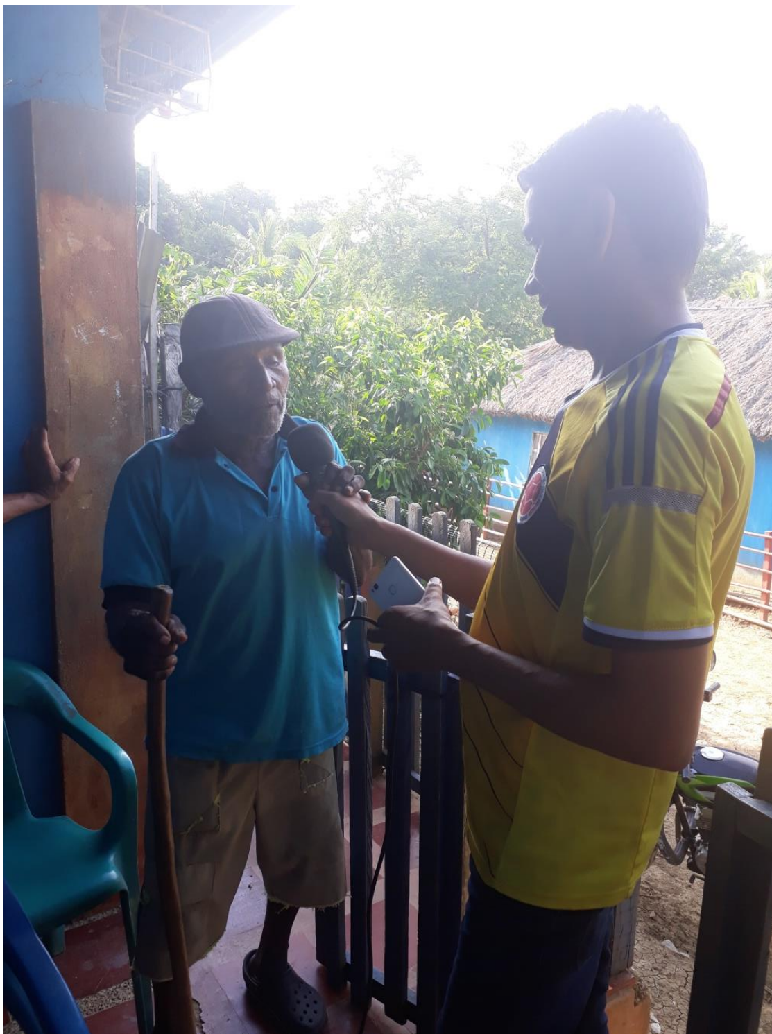
Imagen 1.6. Un rato con Tío Conejo.