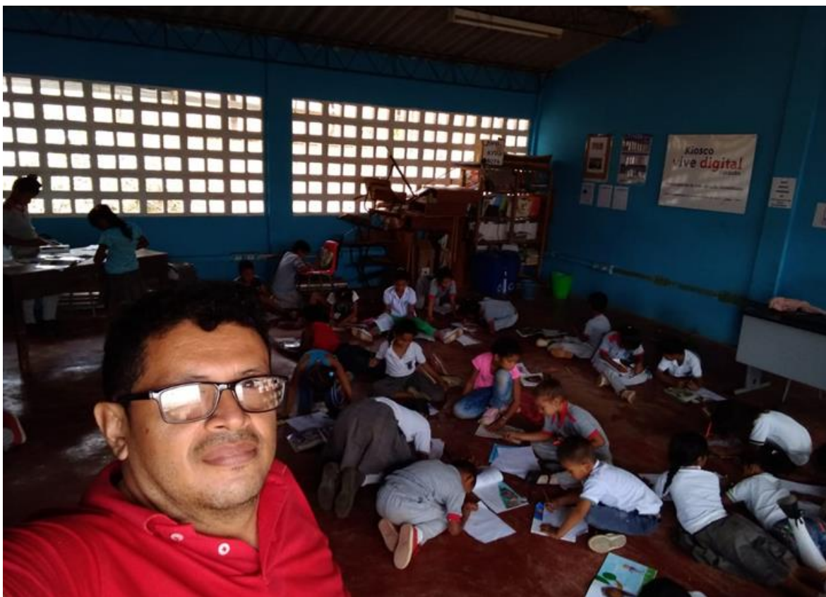
Imagen 1.4. Mochilas Viajeras. Sede el Diamante.