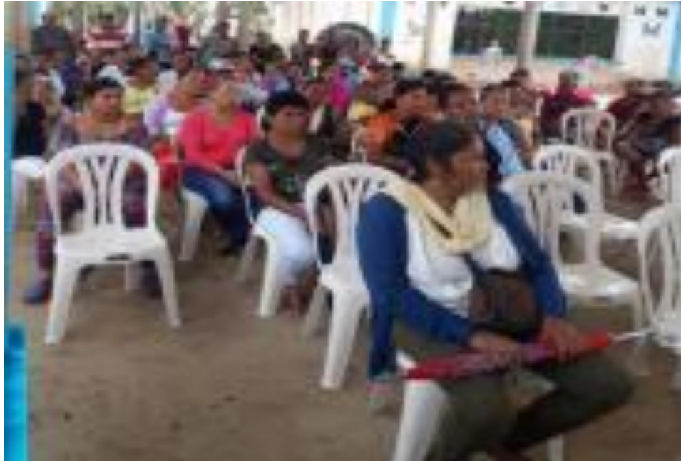
Imagen 7. Padres E. socialización del proyecto y actividad de lectura

Los núcleos familiares, que constituyen la comunidad educativa las Flores, están conformados en su gran mayoría por familias disfuncionales, integradas por abuelos, tíos, primos o parientes que se encargan de la crianza y educación de ellos, quienes trabajan en actividades propias del campo devengando menos de un salario mínimo mensual.