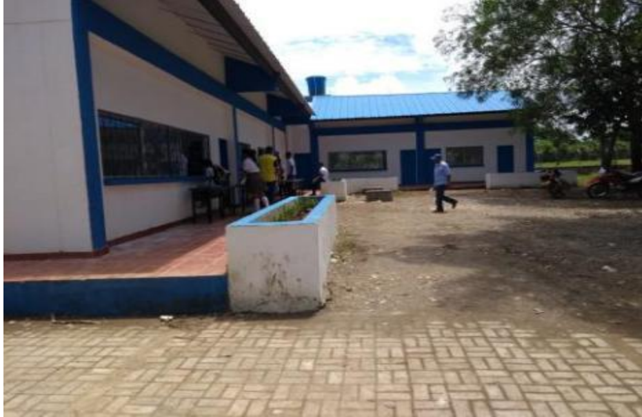
Imagen 3. Contexto Institución educativa Las Flores

Según lo establecido en el Proyecto Educativo Institucional (PEI), la Institución Educativa Las Flores, tiene como misión formar una persona íntegra y competente para responder a las dinámicas del mundo actual, contribuyendo a la construcción y difusión del conocimiento, mediante la implementación de la jornada única, el fortalecimiento de las áreas básicas, la flexibilidad de sus modelos y las competencias en su entorno social, respetando la diversidad étnica y el apropiamiento de la cultura.