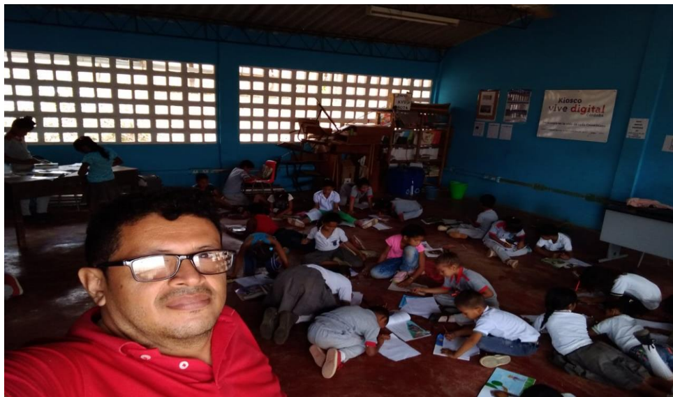
Imagen 12. Socialización mochilas viajeras

Al igual que Kilec, lo que se pretende con las Mochilas Viajeras es que la lectura llegue hasta la casa como mecanismo para incentivar a padres y estudiantes en el proceso lector. Estas mochilas llegan a las sedes en su etapa inicial por el grupo de maestrantes, quienes dan a conocer la estrategia, su metodología y las metas que se pretenden alcanzar con dicha actividad. Para tal fin se establecieron mochilas (Diamante, azul; Marcos Fidel, verde; Aguas Dulces, beige; San José de Bijao, fucsia; Bajo Grande, morada) que identifican y simbolizan las diferentes sedes por las cuales van a circular. De esta manera, con el apoyo de 10 estudiantes del servicio social, quienes prestan sus funciones como “mediadores de la lectura” (que por sus características son competentes lectores) fueron los encargados de continuar transportando las mochilas a las diferentes sedes, donde cada profesor se encargó de distribuir los libros que ellas contienen, democratizando la lectura por niveles. Para tal propósito, se utilizaron los libros de la colección de semilla, que en su gran mayoría son libros narrativos e ilustrativos.