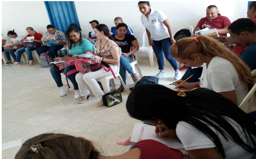
Imagen 15. Taller formativo docentes en tipologías textuales

Estrategia encaminada a la auto reflexión de las practica pedagógica, busca que los docentes se conviertan en agentes transformadores en el que hacer pedagógico, desarrollan las habilidades que potencialicen un proceso lector con una intencionalidad.