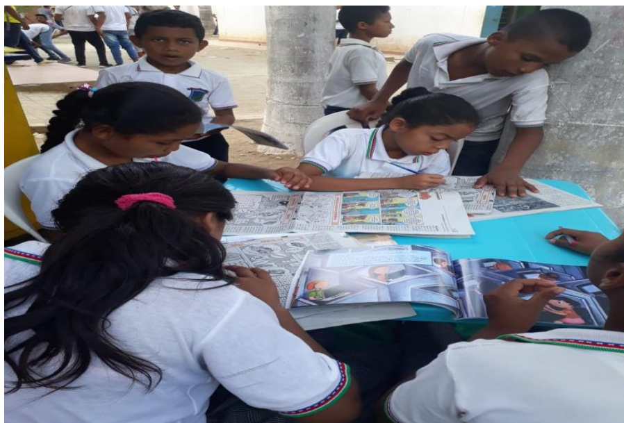
Imagen 1.2. Kiosco Kilec. Lectura de Textos.