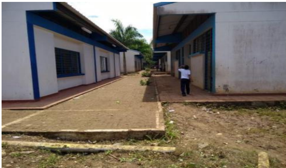
Imagen 2. Contexto Institución Educativa Las Flores