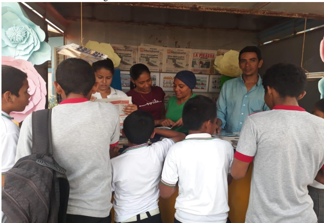
Imagen 1.3. Kiosco Kilec. Prestamos de Libros.