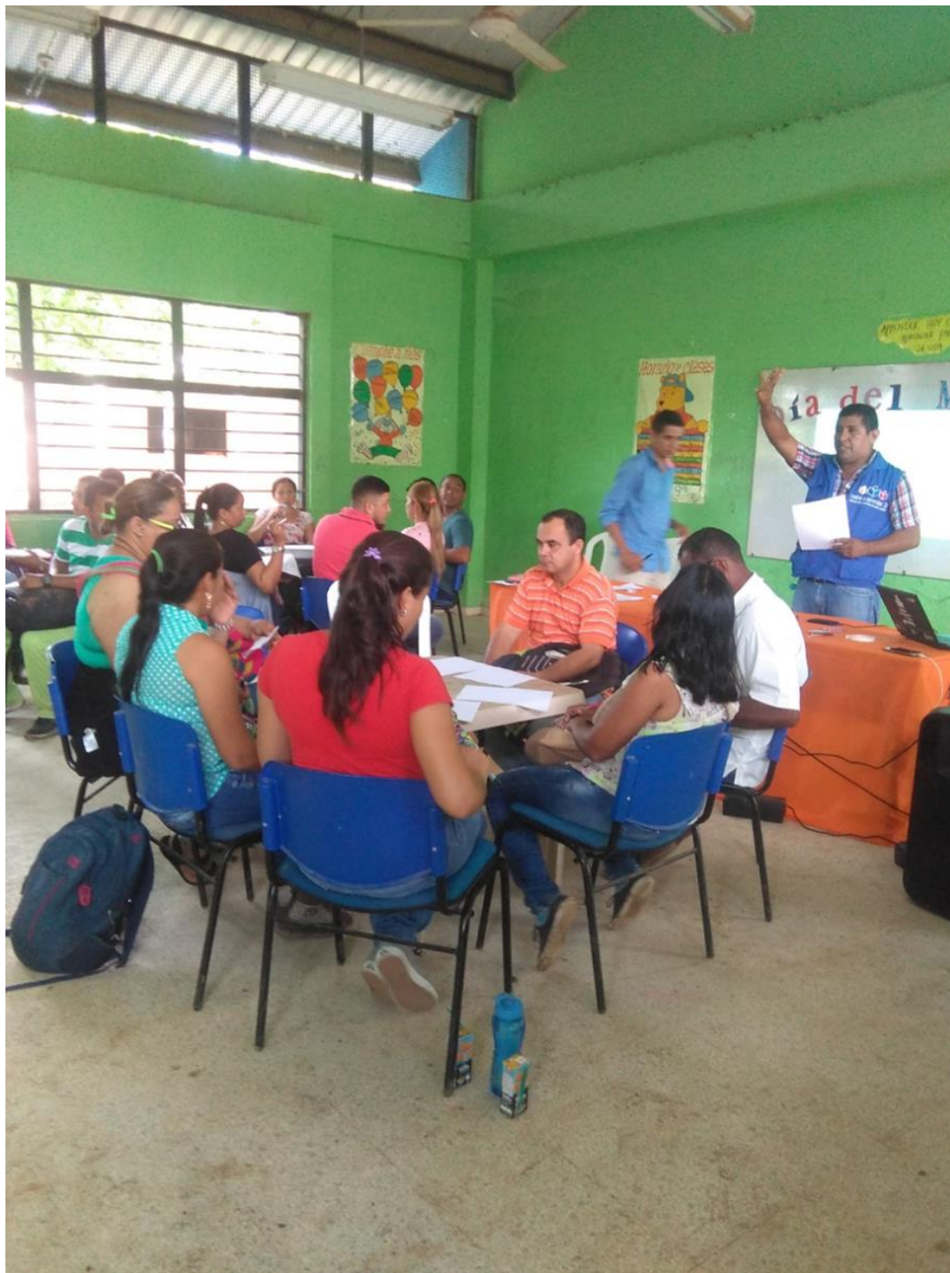
Imagen 3.1: Talleres formativos docentes.