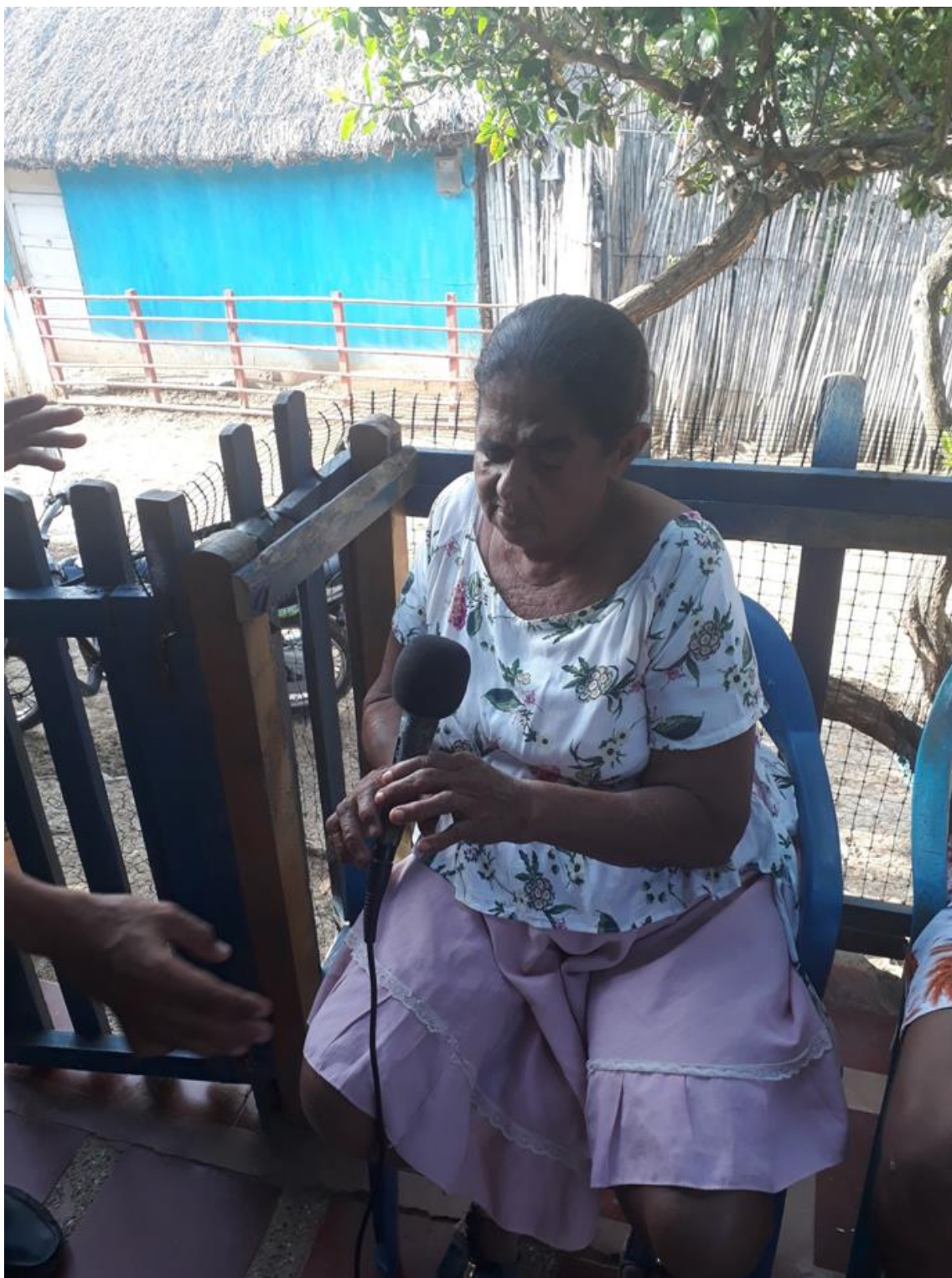
Imagen 1.6. Un rato con Tío Conejo.