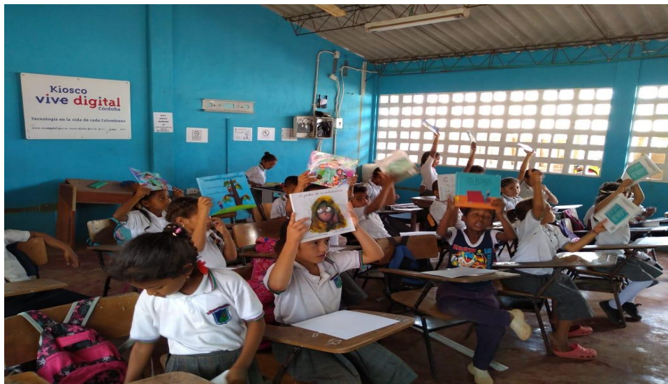
Imagen 11. Entrega mochilas viajeras