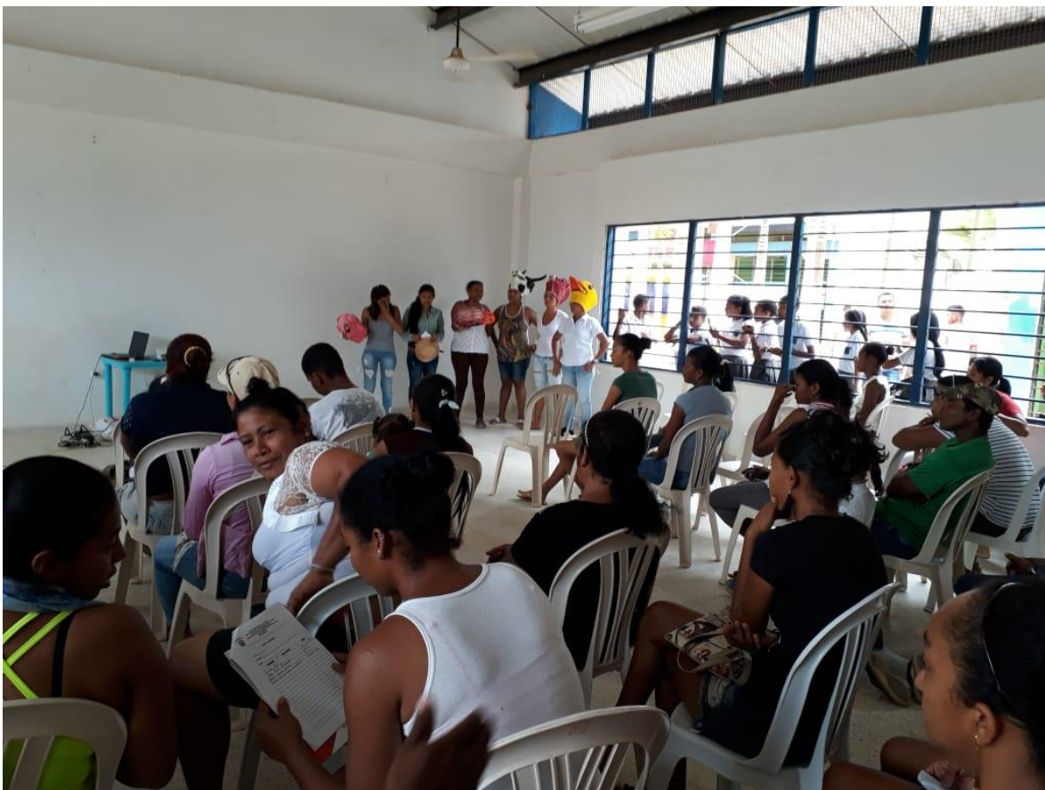
Imagen 1.8: Padres E. Asamblea general de padres Familia. “Recreacion teatral cancion animales de la granja”.