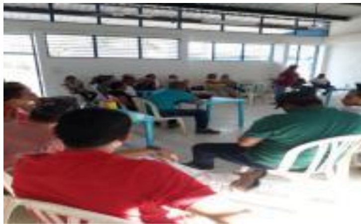
Imagen 4. Docentes I.E Las Flores socialización proyecto