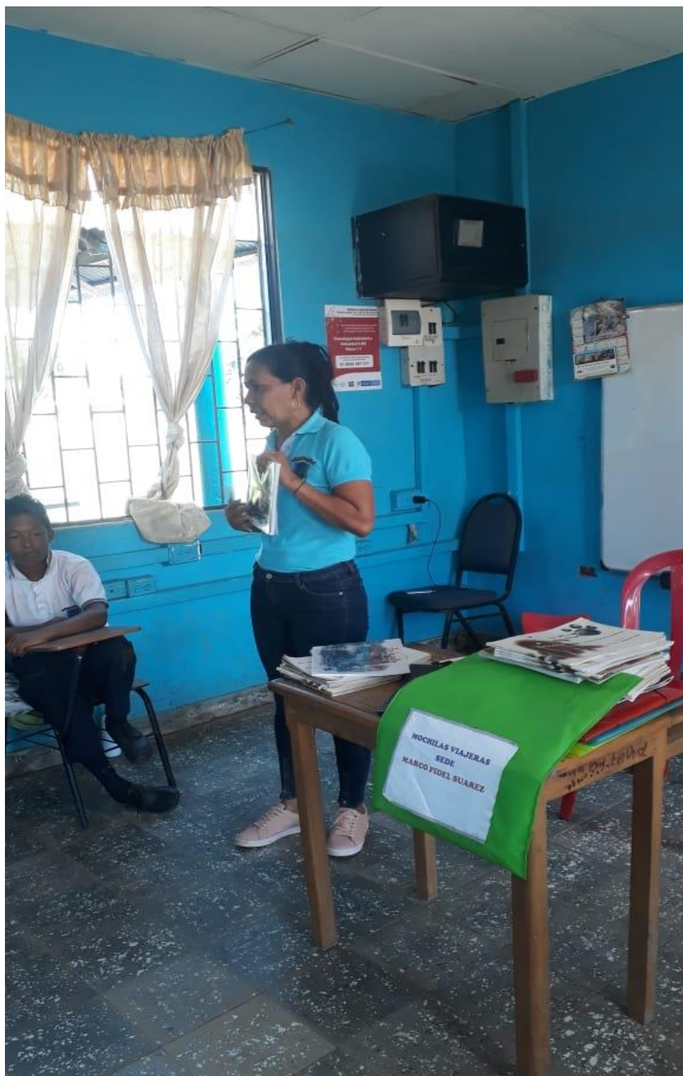
Imagen 1.6. Mochilas Viajeras. Sede Marcos Fidel.