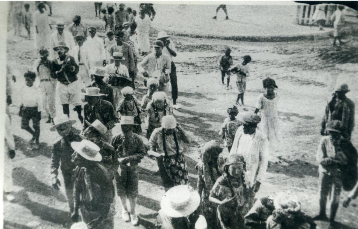
Comparsa de las fiestas novembrinas en 1940.

Para la década de los cuarenta, aún se conserva cierto celo por homenajear a quienes fueron