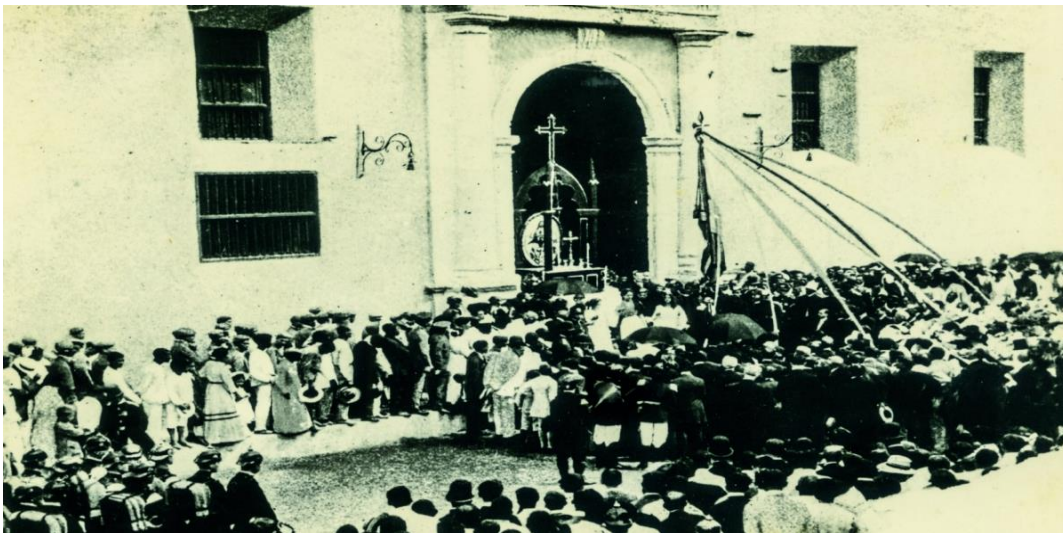
El Centenario. 1911.

En esta intervención aún se evidencia el imaginario de las Fiestas de Independencia como conmemoración de un evento patrio y se resaltaba que tan importante era para el pueblo cartagenero el hecho de recordar las hazañas y sacrificios de nuestros próceres. El pueblo se regocijaba grandemente ante la magnitud de tal evento, ya que este representaba la libertad de la podían disfrutar, por tal hecho, año tras año llevaban a cabo la conmemoración de esa fecha.