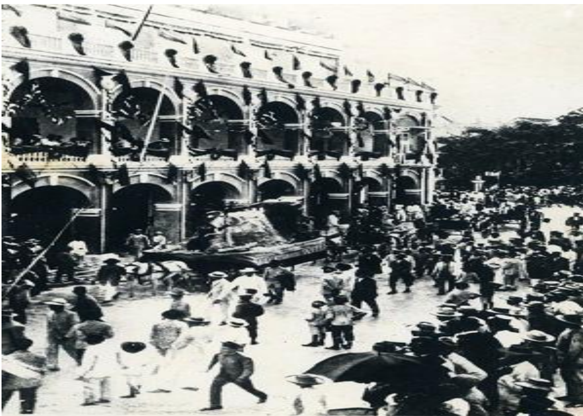
Desfile del centenario de la independencia de Cartagena, 1911. Fototeca Histórica de Cartagena Plaza de la Proclamación 1911 (Banrepcultural, Cartagena, reinas, fiesta e independencia)

desarrollo y que se quería celebrar por todo lo alto el Centenario. Algunas de las obras inauguradas para esa época fueron el Monumento a la Bandera, el Parque del Centenario, el Teatro Municipal, la estatua de Noli Me Tanguere, la cual significa “No me toquéis”, entre otras obras, que fueron construidas bajo el gobierno de Rafael Núñez que en ese momento ejercía su segundo mandato presidencial 20