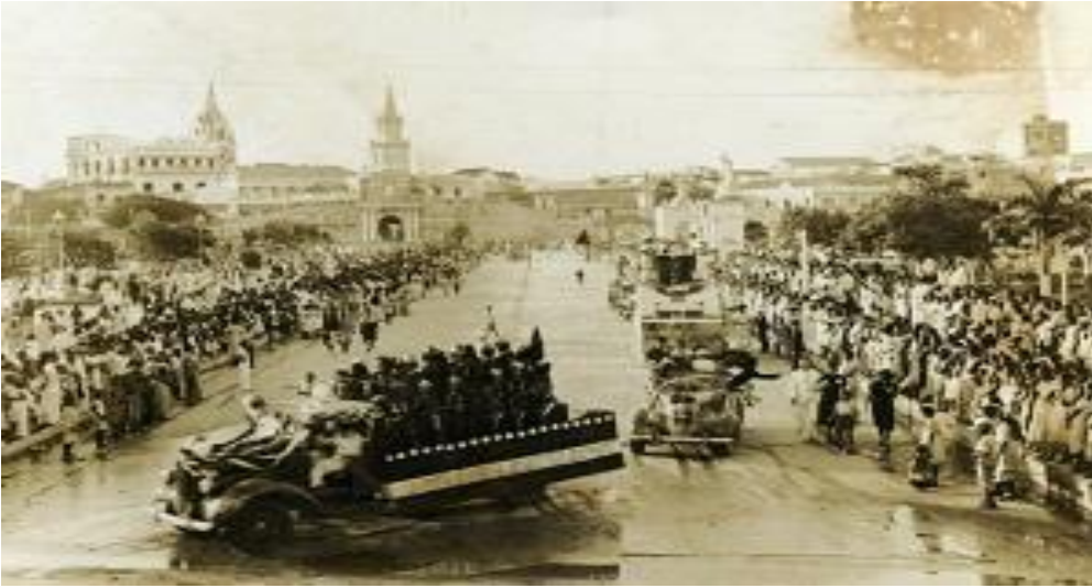
Batalla de flores en el Camellón de los Mártires durante la celebración del 11 de noviembre de 1938 (Banrepcultural, Cartagena, reinas, fiesta e independencia)

En este punto, la elite es la encargada de la ejecución de los diferentes eventos festivos, lo que a su vez también implican complejas relaciones sociales. Esto permite considerar que