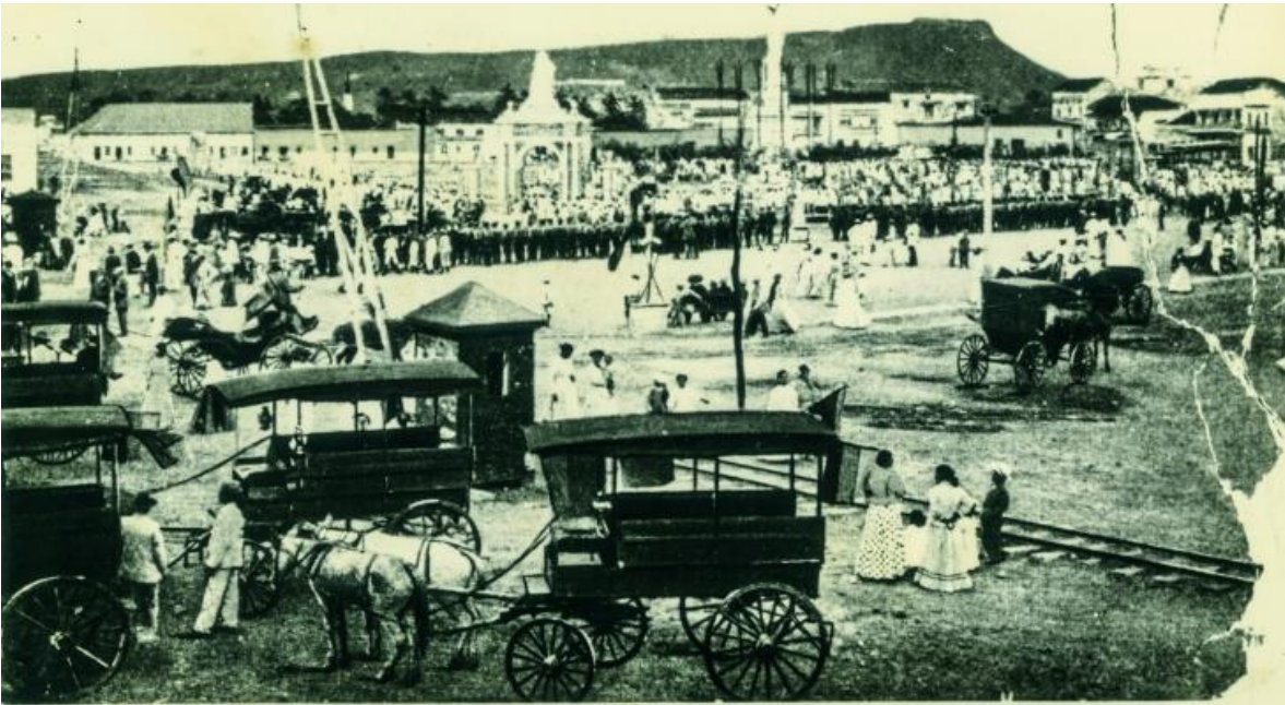
El Centenario. 1911. Fototeca Histórica de Cartagena de Indias

En 1909, el Gobernador del Departamento realiza una alocución en donde magnifica la hazaña de nuestros próceres libertadores, e invita a dar una viva a la Republica y a su noble cuna el 11 de Noviembre de 1811, diciendo