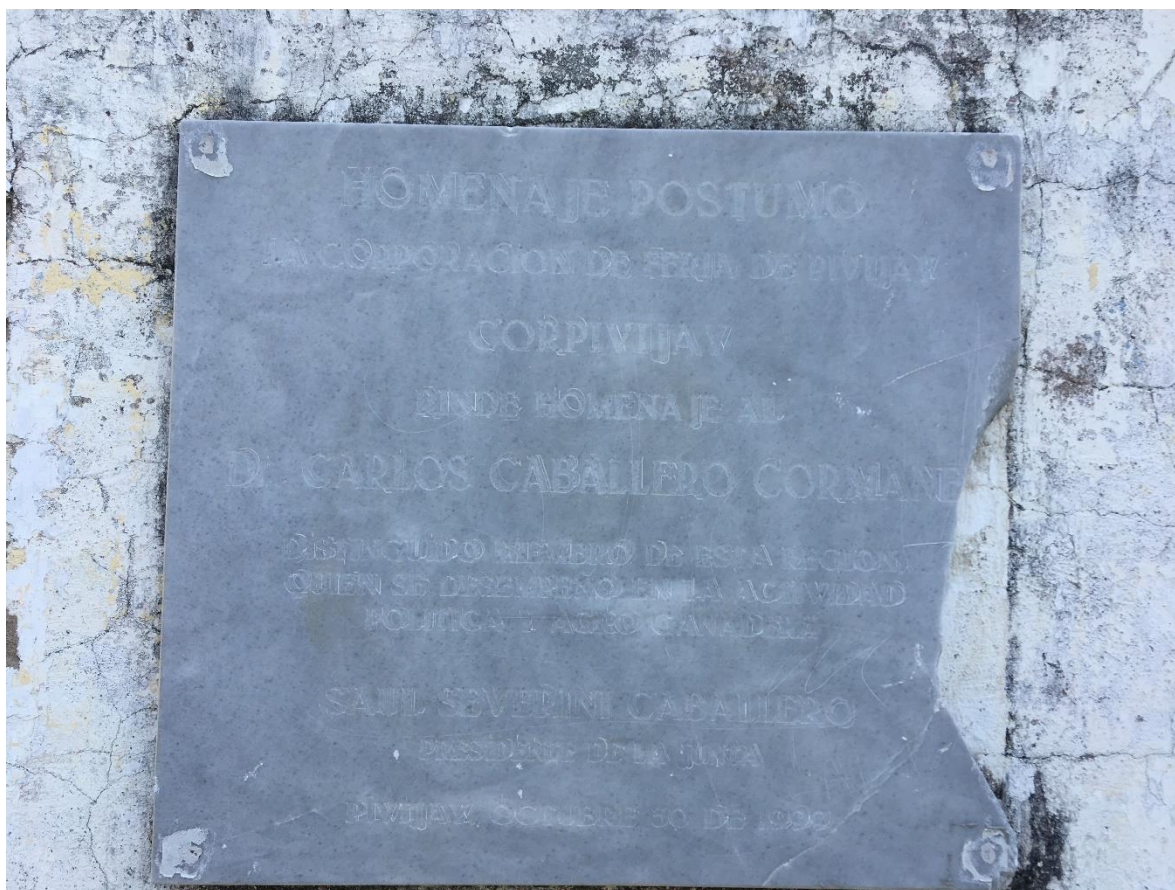
(Imagen 1) Homenaje póstumo, Feria ganadera

Un evento que atraía a los foráneos y residentes del pueblo era las riñas de gallos, apasionados por este espectáculo se congregaban en la feria donde jugosas sumas de dinero se colocaban en juego. Cabe resaltar que Pivijay siempre ha tenido una tradición por este arte y en escenario como este se demostraba su pasión por ello.