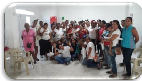
Ilustración 8. Taller: competencias de un líder