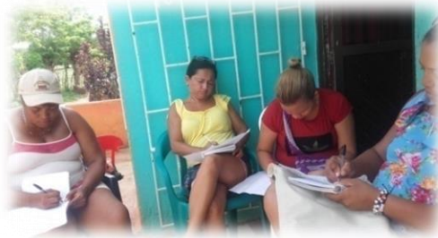
Ilustración 1. Entrevista a líderes sobre funcionamiento del programa