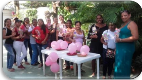
Ilustración 6. Grupo base conformado