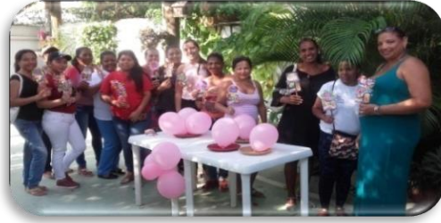
Ilustración 17. Grupo base conformado