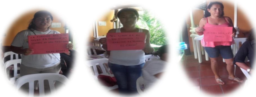
Ilustración 14. Actividad lúdica pedagógica