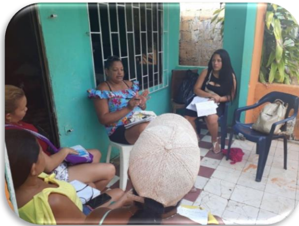
Ilustración 16. Conformación del grupo