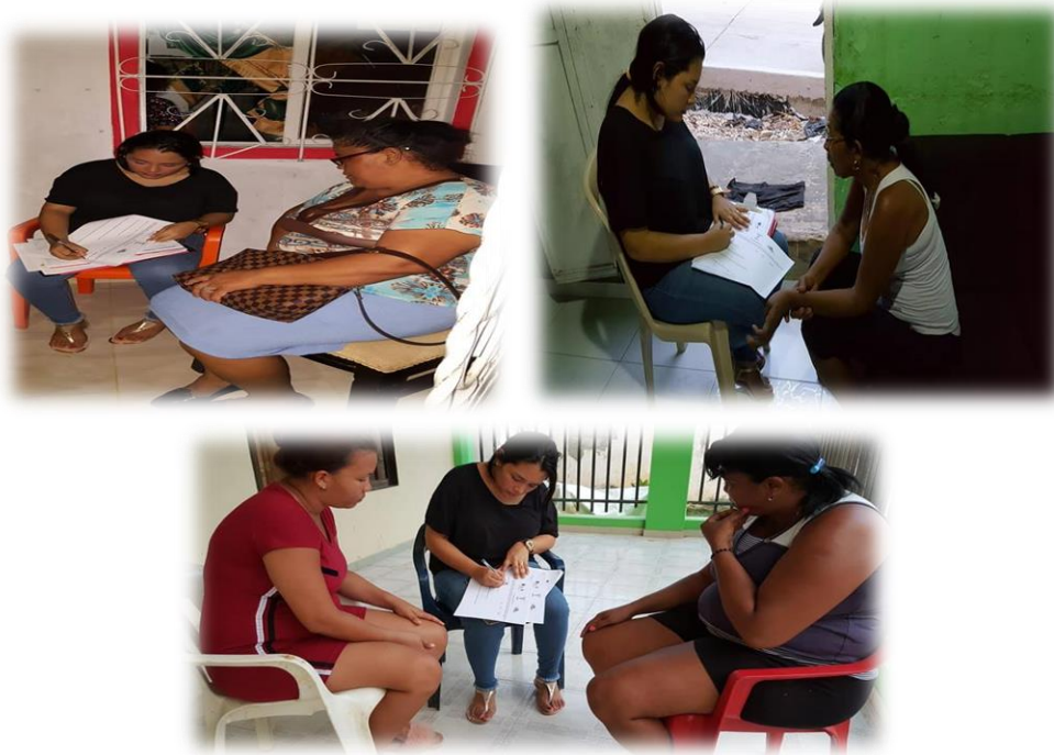
Ilustración 18. Entrevistas de recuperación de aprendizajes y experiencias.