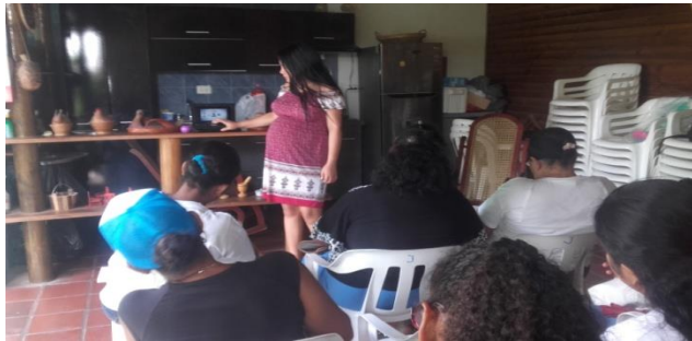
Ilustración 15. Video sobre la temática de participación ciudadana