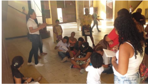
Ilustración 9: Caracterización