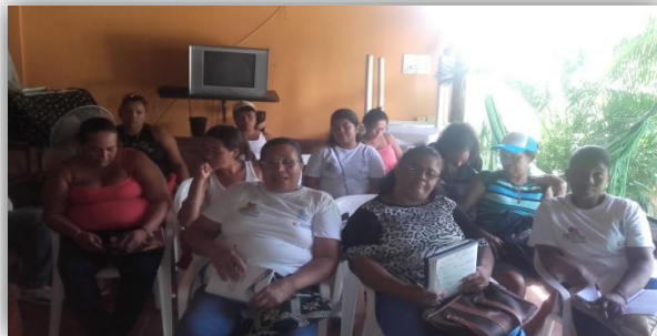
Ilustración 11. Taller: Como motivar a mi comunidad