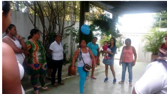
Ilustración 10. Dinámica interactiva