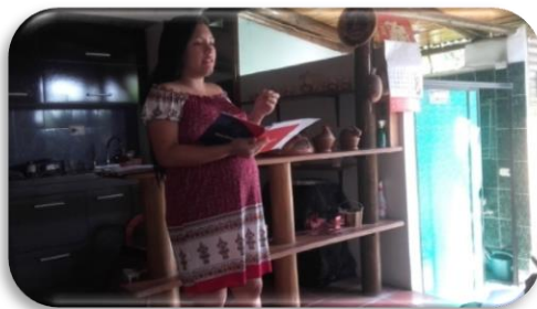
Ilustración 4. Capacitación: liderazgo comunitario Ilustración 5. Capacitación: liderazgo

Primeramente se realizaron dinámicas para crear un buen ambiente entre las líderes participantes, donde se presentaron y contaron la mejor experiencia que habían tenido como líderes. Luego, por medio de las técnicas interactivas se llevó a cabo la socialización de las diversas temáticas y poco a poco las madres fueron cambiando la concepción que tenían sobre liderazgo y el ejercicio de este.