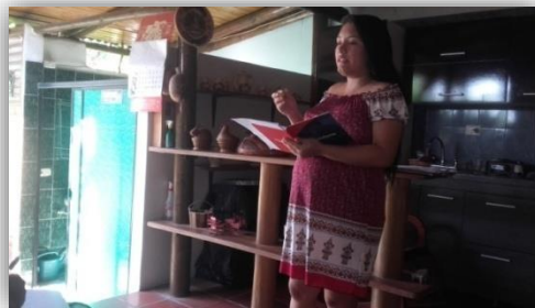
Ilustración 12. Capacitación: Liderazgo