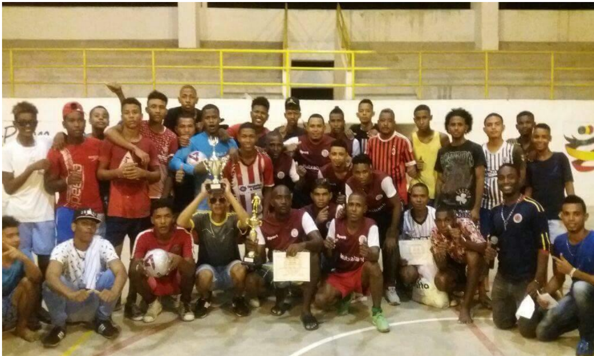
Imagen 1. Final Campeonato “Construyendo sueños”