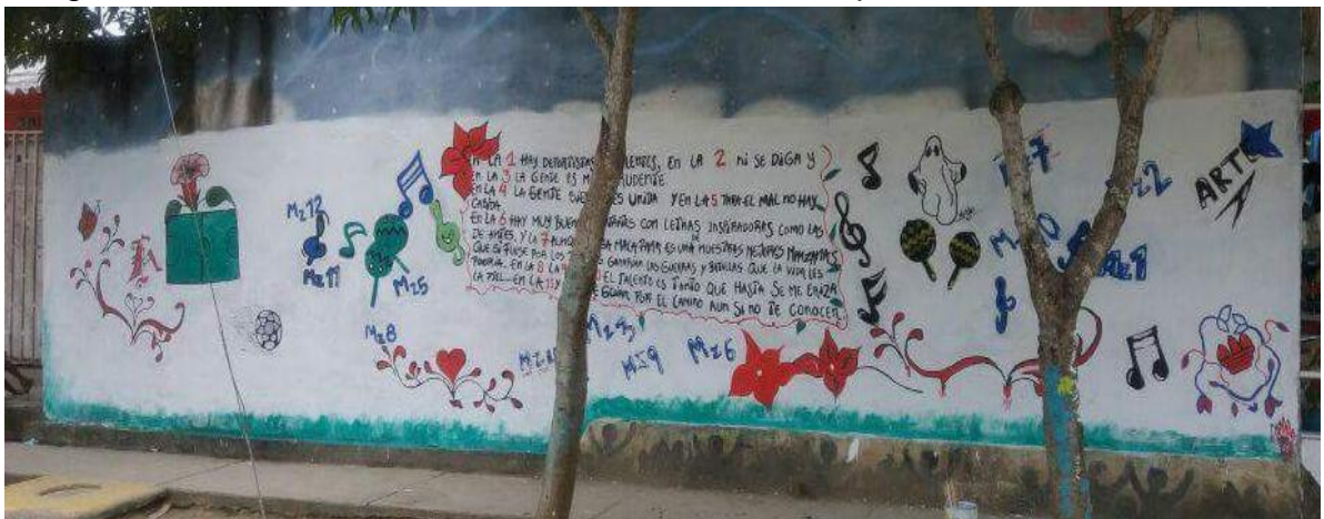
Imagen 3. Mural comunitario en el barrio Flor del Campo

En la elaboración del mural se observó cómo se conjugan el trabajo creativo con el desarrollo de mejores relaciones entre los habitantes de Flor del Campo. Mediante esta actividad se favoreció la transformación social y cultural de los espacios sociales y la construcción de una memoria histórica a futuro. Asimismo, conllevó a modificar la visión individualista de las personas jóvenes, se logró la reconstrucción de la comunidad y la oportunidad de expresar sus sentimientos y vivencias, de una forma libre y espontánea. A continuación se presenta el mural realizado por todos los jóvenes de la comunidad.