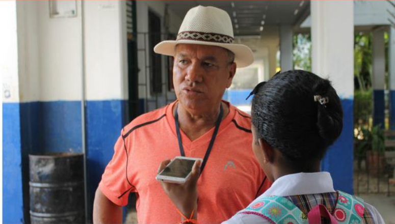
Estudiante realizando una entrevista durante los talleres de periodismo escolar.

Cabezote: nombre del periódico, fecha, número de la edición y lema.