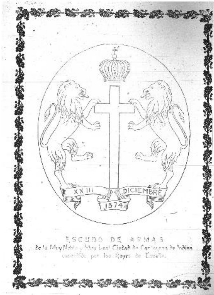
Imagen 3.

“(…) Año en que ebrio el espíritu al épico recuerdo de nuestra libertad, acalló el grito de dolor profundo y formó en las filas de la multitud que delirante de entusiasmo elevaba su clamor de pueblo libre y que sabe hacerlo (...)” 86 ”