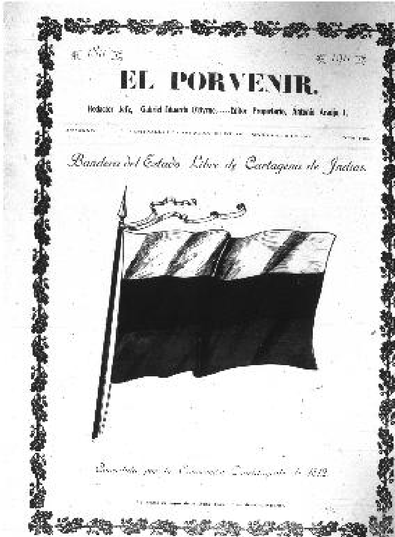
Imagen 1.

y uno sobre el centenario de 1911, discursos, héroes de independencia, entre otros 82 . Esta fecha tuvo gran impacto en la comunidad, no solo cartagenera, sino colombiana. Saludos y discursos llegaban de muchos lugares del país, recordando la importancia de la lucha, los mártires y como sinónimo de libertad a esta ciudad “Heroica” 83