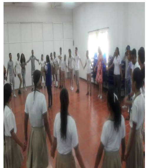
Actividad de Abrazo mientras cantamos Ronda de Canción y Comunicación