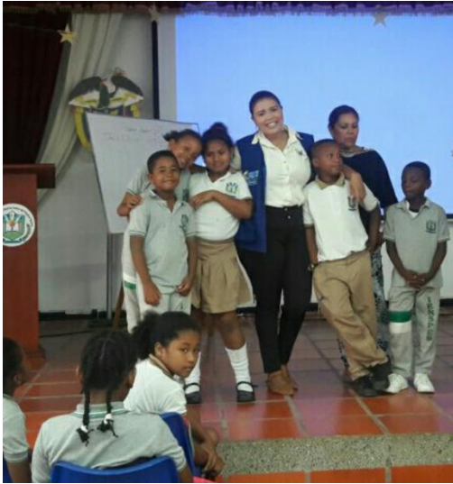
Taller con alumnos de cuarto grado