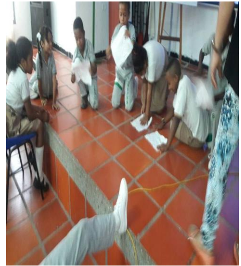
Actividad del Papel sin Arrugas