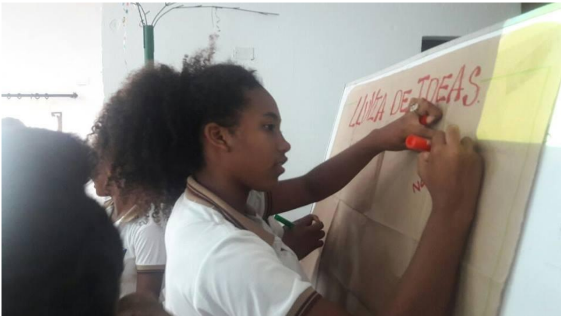
Lluvia de Ideas para canción, estudiantes de octavo grado