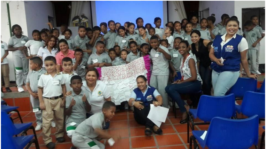
Equipo de Trabajo y Alumnos de tercero y cuarto grado