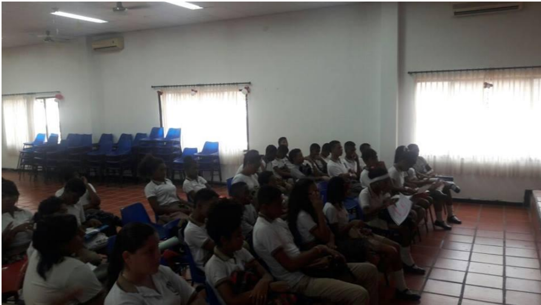
Taller con Estudiantes de décimo grado