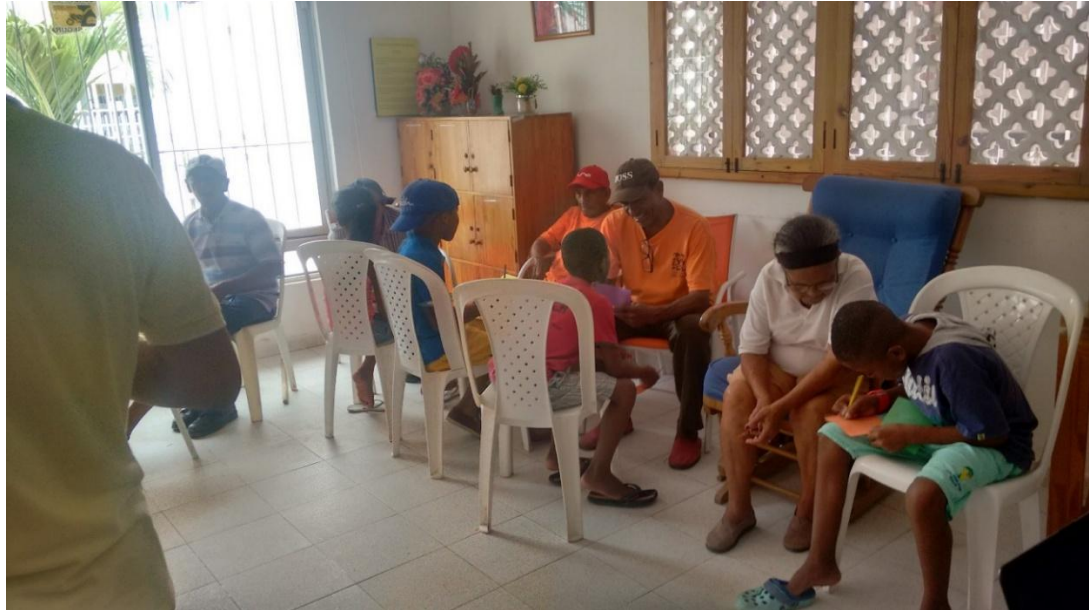
Lugar: Granitos de Paz