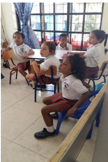
Ilustración 5Aplicando la estrategia de relajación musical instrumental