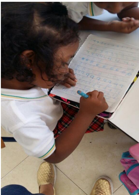
Ilustración 4 Realizando sus tareas en clases