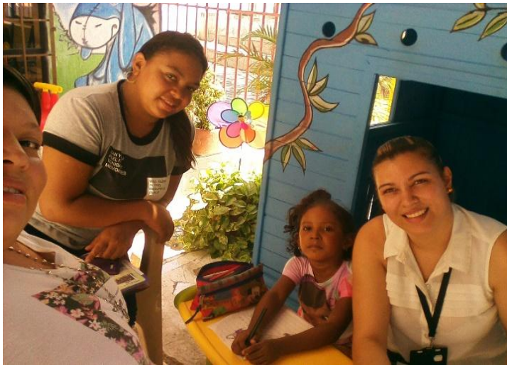
Ilustración 2 Entrevista a la niña