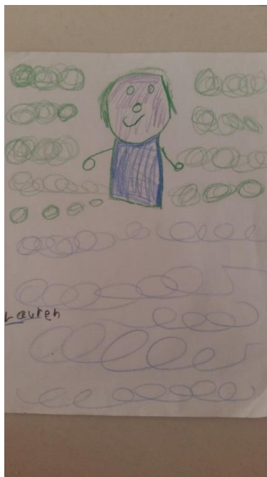
Ilustración 9 Dibujándose ella misma