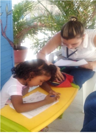
Ilustración 8 Pintando los miembros de su familia