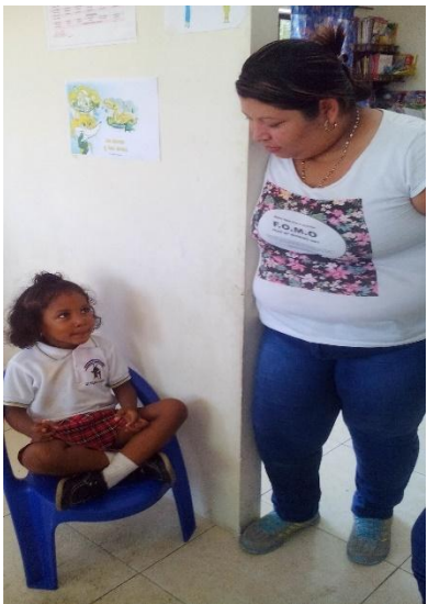
Ilustración 6Aplicando la estrategia tiempo fuera