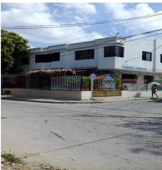
Ilustración 1 Plantafísica del Jardin Guarderia la Pulguita Traviesa