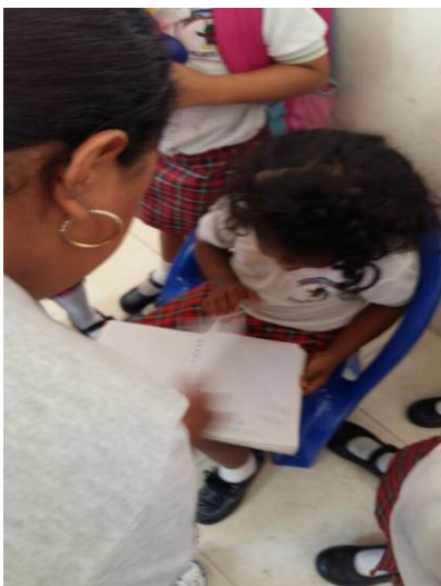
Ilustración 7Quitandole el cuaderno que estaba partiendo