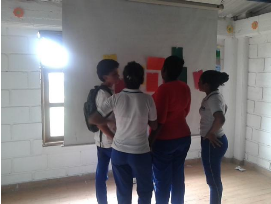
Fotografía 2. Lectura de los clasificados