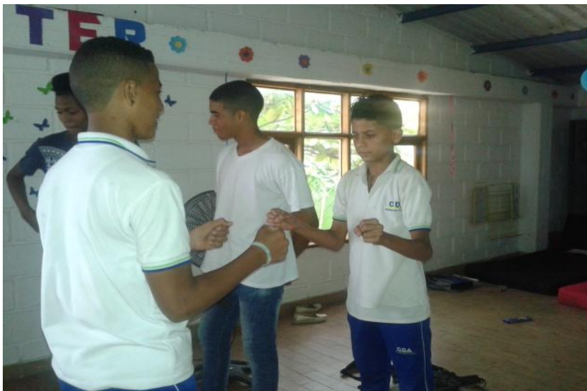
Fotografía 4. Actividad del espejo