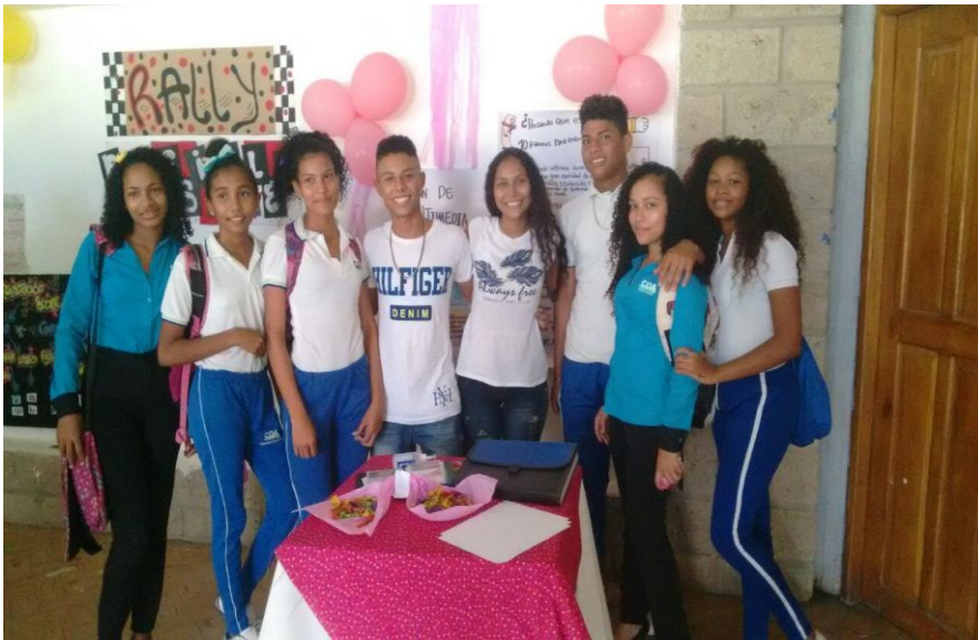
Fotografía 6. Rally de profesionales.