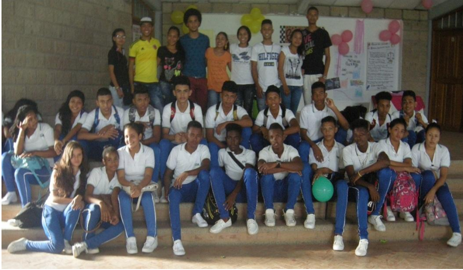
Fotografía 5. Rally de profesionales