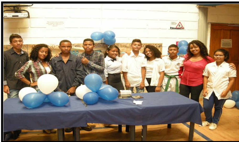
Fotografía 1. Grupo de orientación vocacional