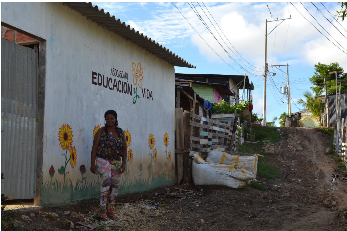
Imagen N° 14 Asociación Educación y vida. Lugar construido por las mujeres líderes del barrio.