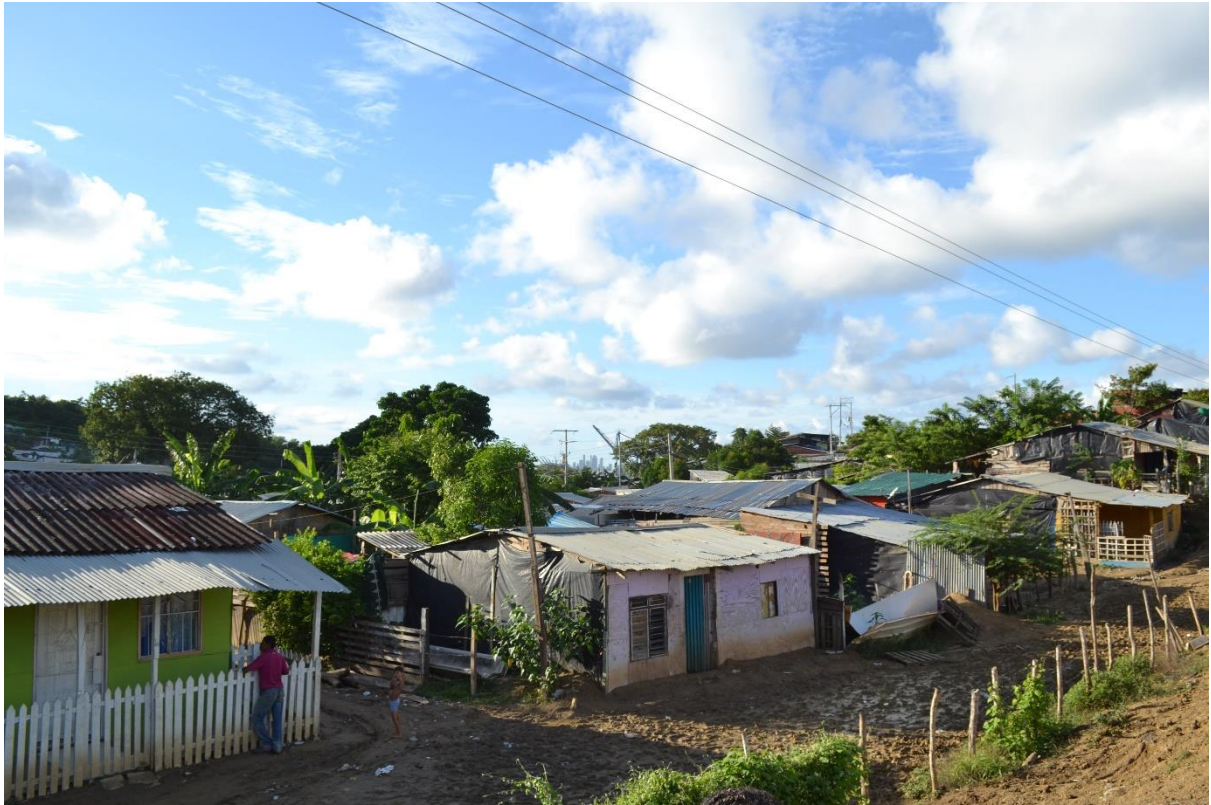
Imagen N° 9 Sector El Playón.