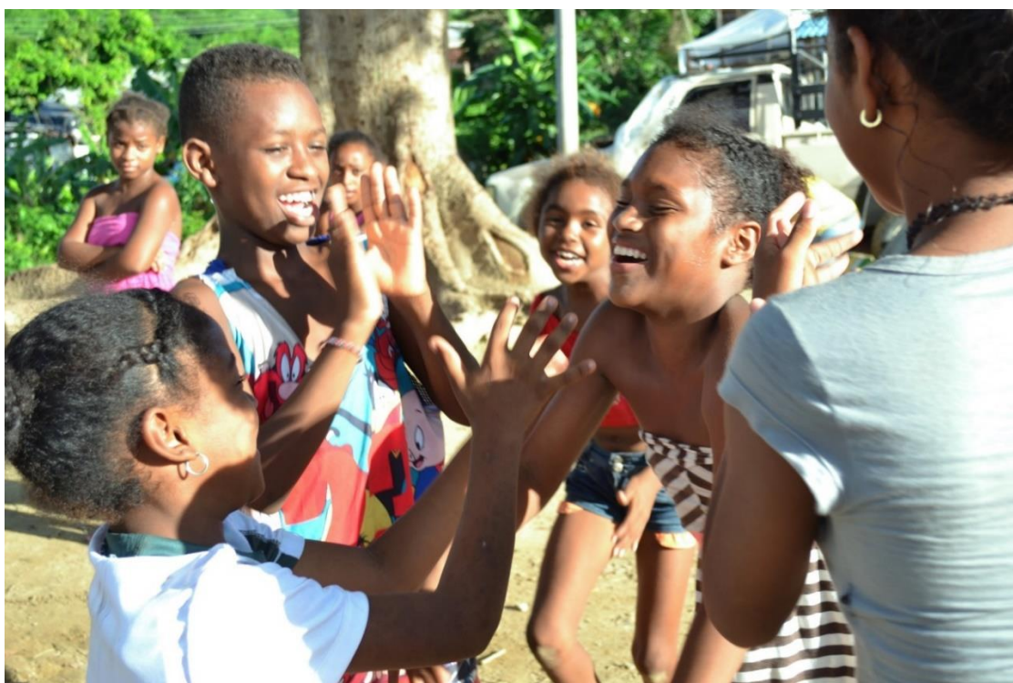
Imagen N° 4 Niños y niñas jugando en el parque de Las María Mulatas.