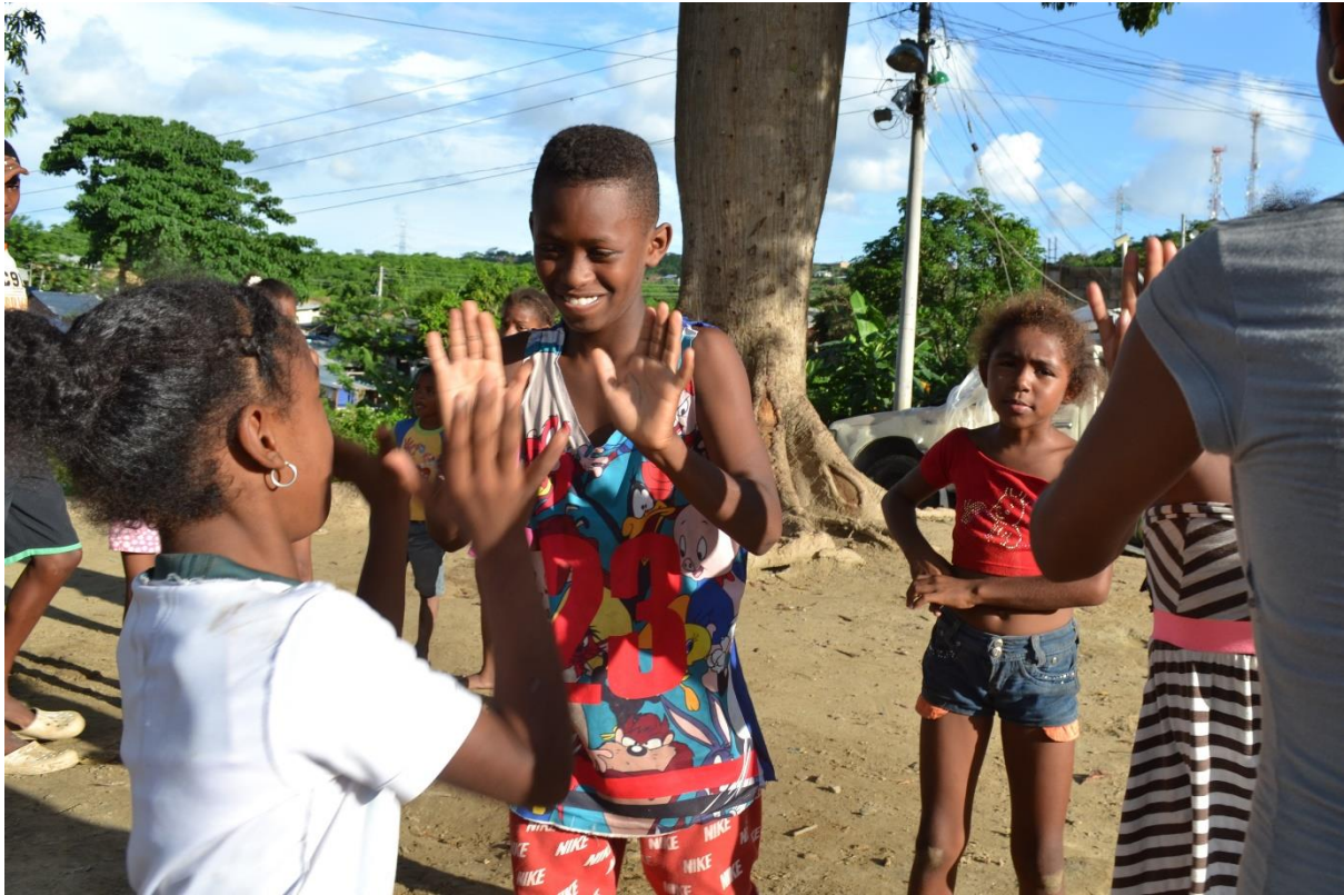
Imagen N° 5 Niños y niñas recreándose. Fotografía del grupo investigador.