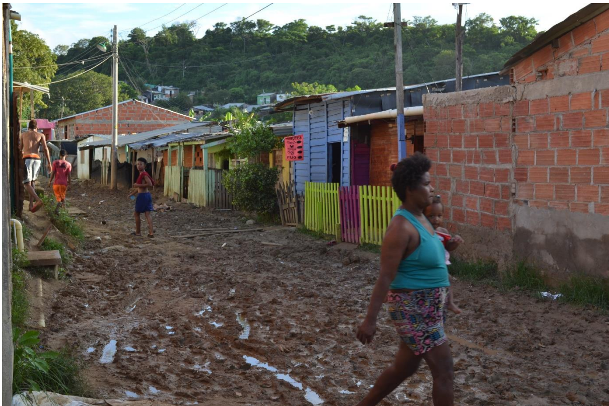
Imagen N° 22 Sector La Poza.