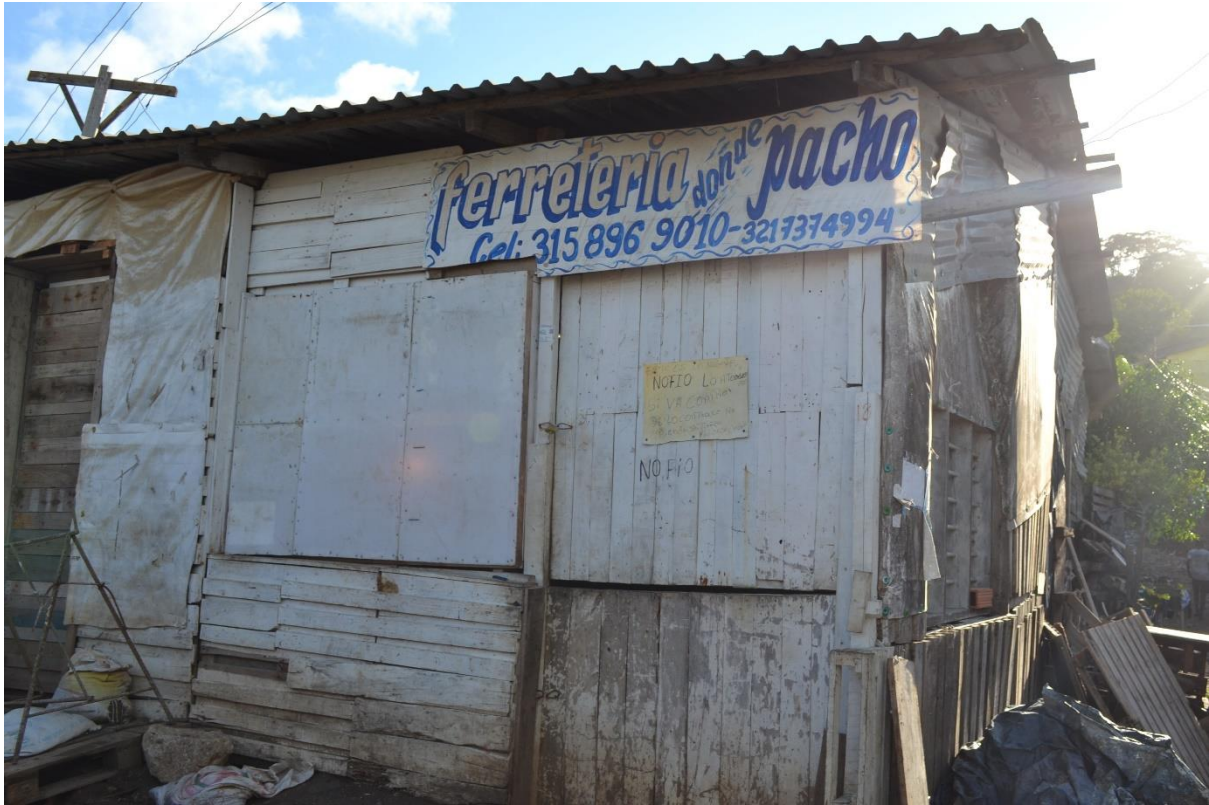
Imagen N° 7 Ferretería Donde Pacho.