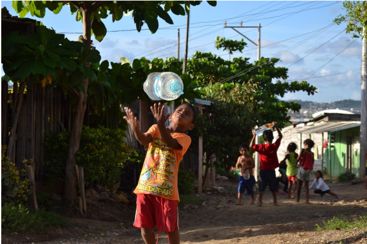
Imagen N° 17 Niños y niñas en busca de agua potable.