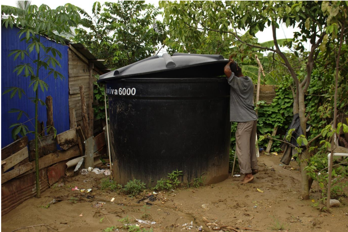
Imagen N° 1 Tanque comunitario para el abastecimiento de agua potable.