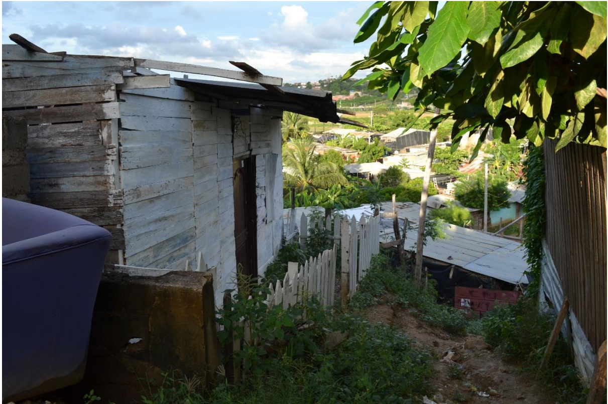
Imagen N°19 Callejón del sector La Bendición.