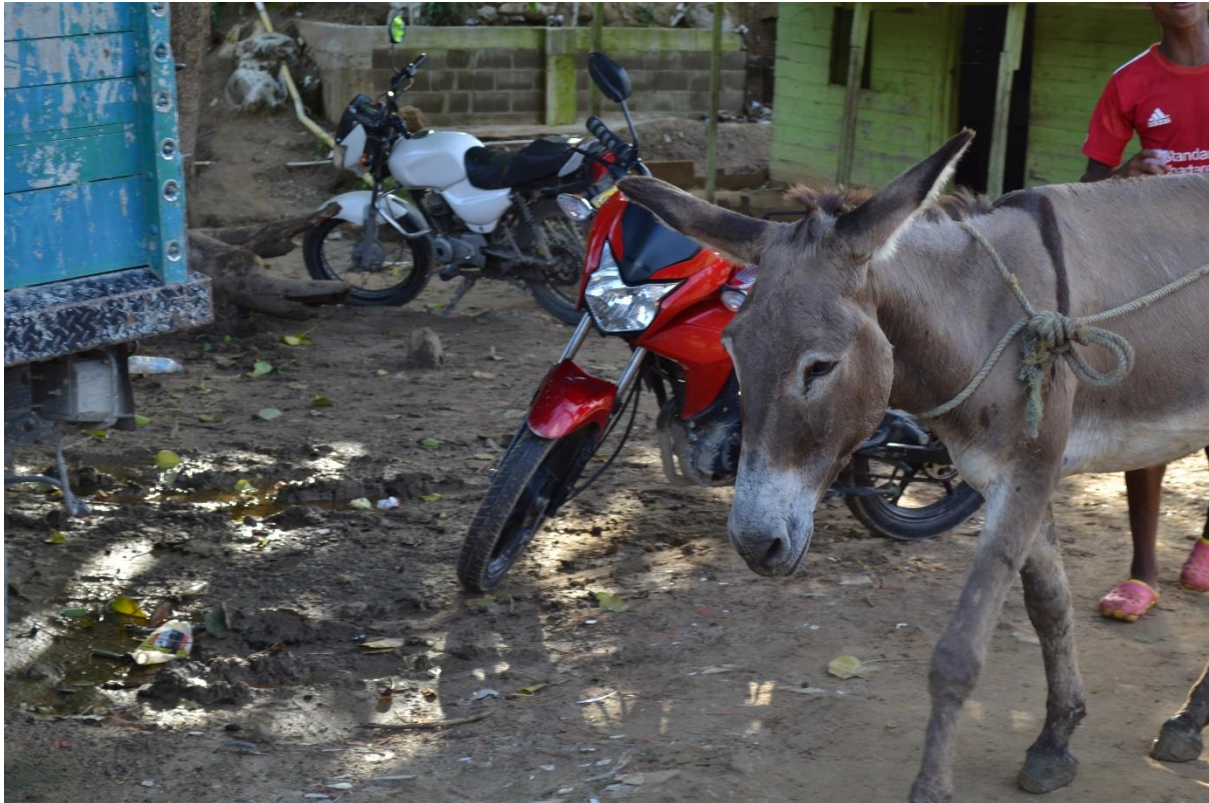
Imagen N° 13 Opciones de transporte. Moto o burro.