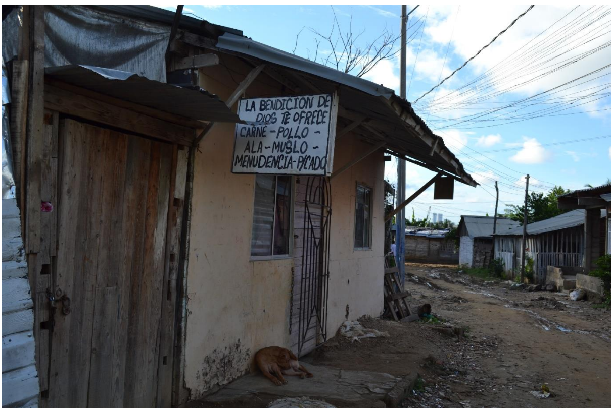
Imagen N° 12 Calle de la Bonga.