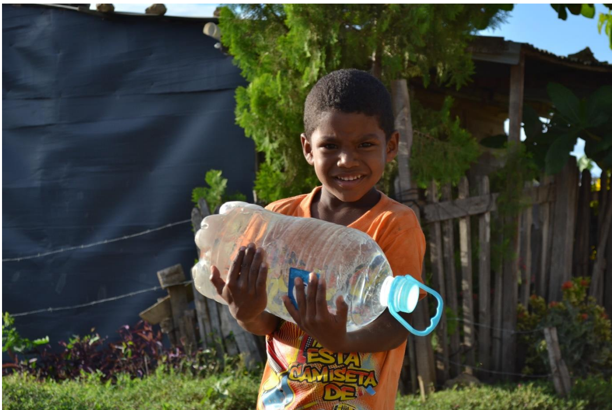
Imagen N° 18 Inocencia.