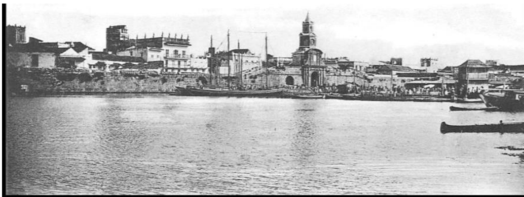
Cartagena, aislada por agua. Año 1732

Imagen: Cartagena, aislada por agua. Año 1732