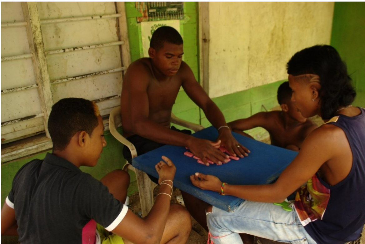
Imagen N° 2 Jóvenes jugando domino. Fotografía del grupo investigador.