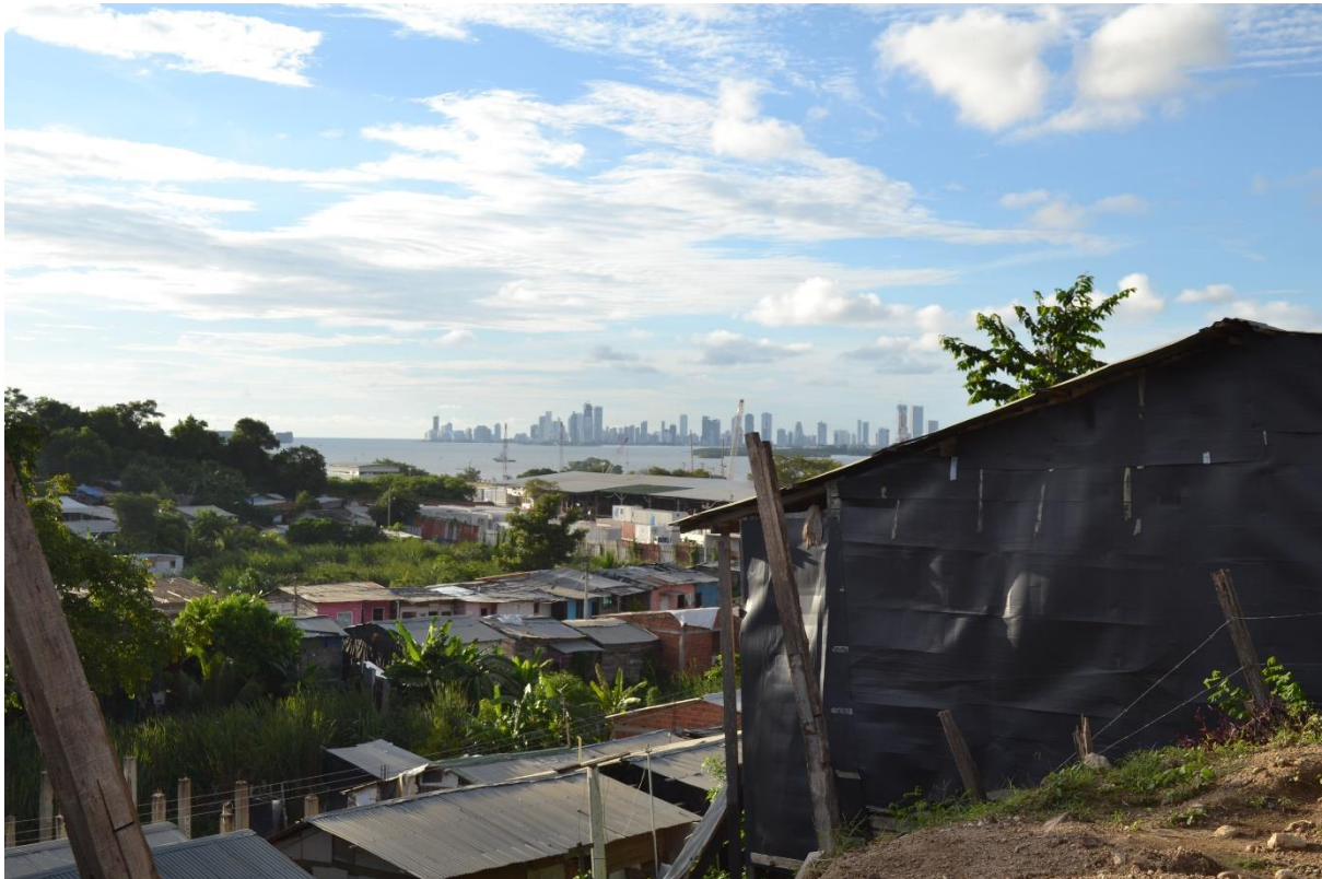
Imagen N° 16 Panorámica del barrio 2. Las dos caras de la ciudad. Fotografía del grupo investigador.