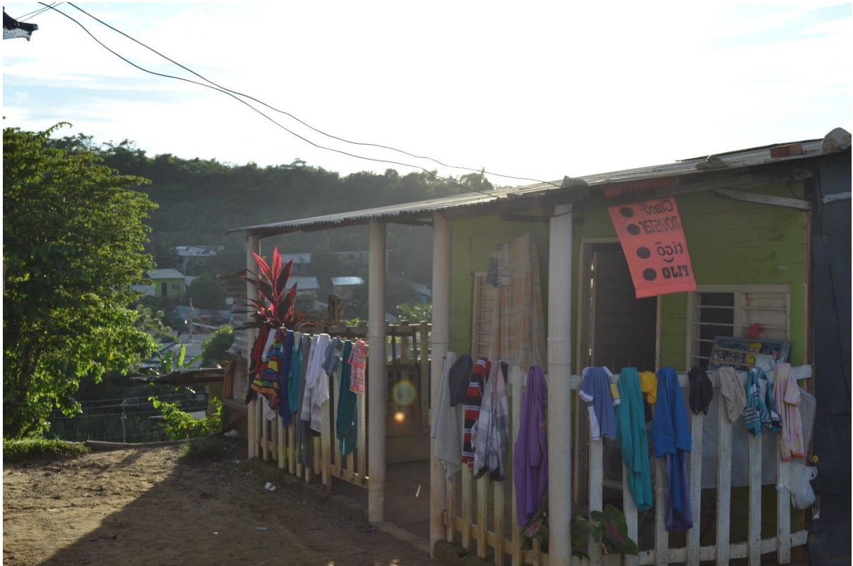
Imagen N° 20 Vivienda del sector.