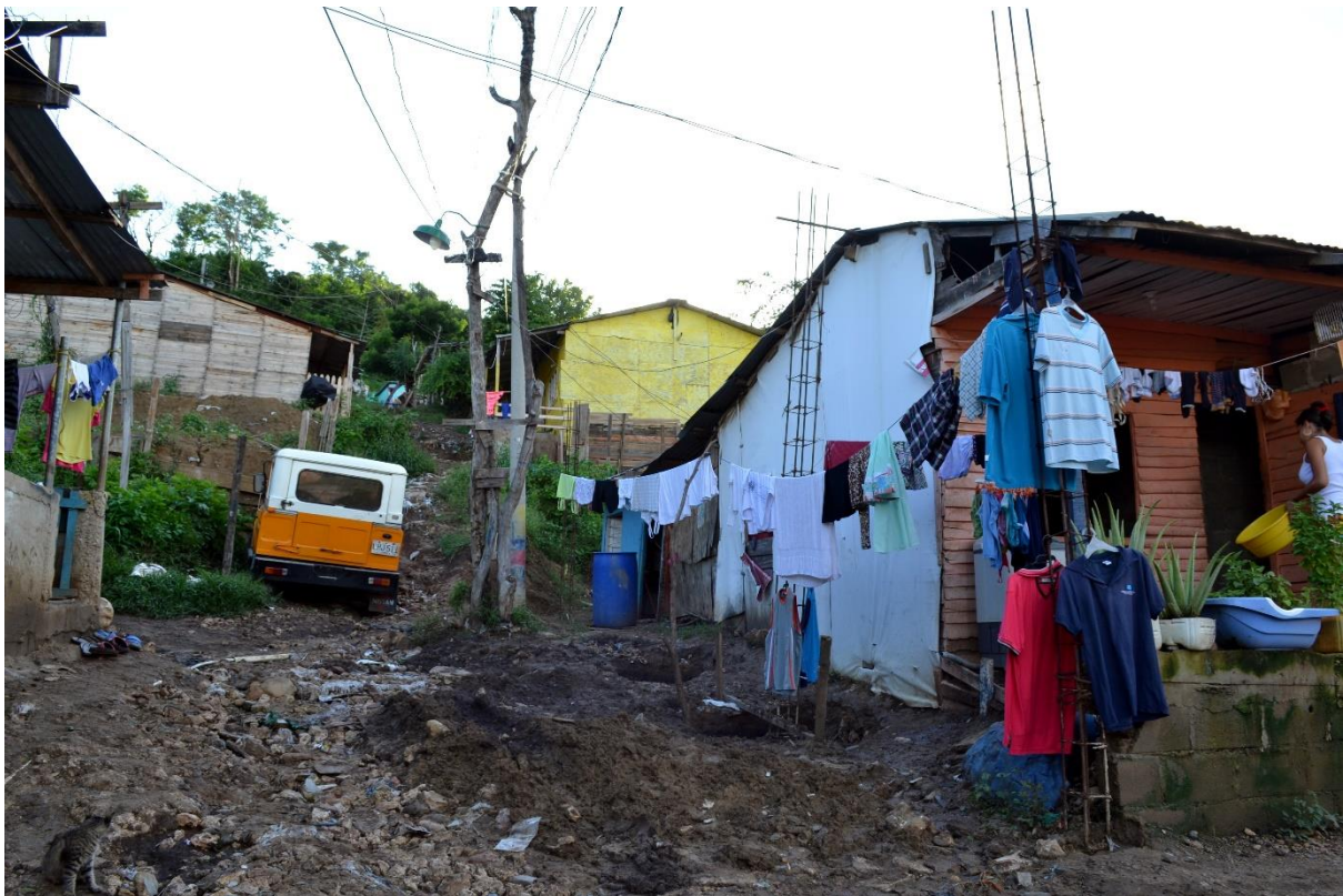
Imagen N° 6 Sector Las Lomas. Fotografía del grupo investigador.