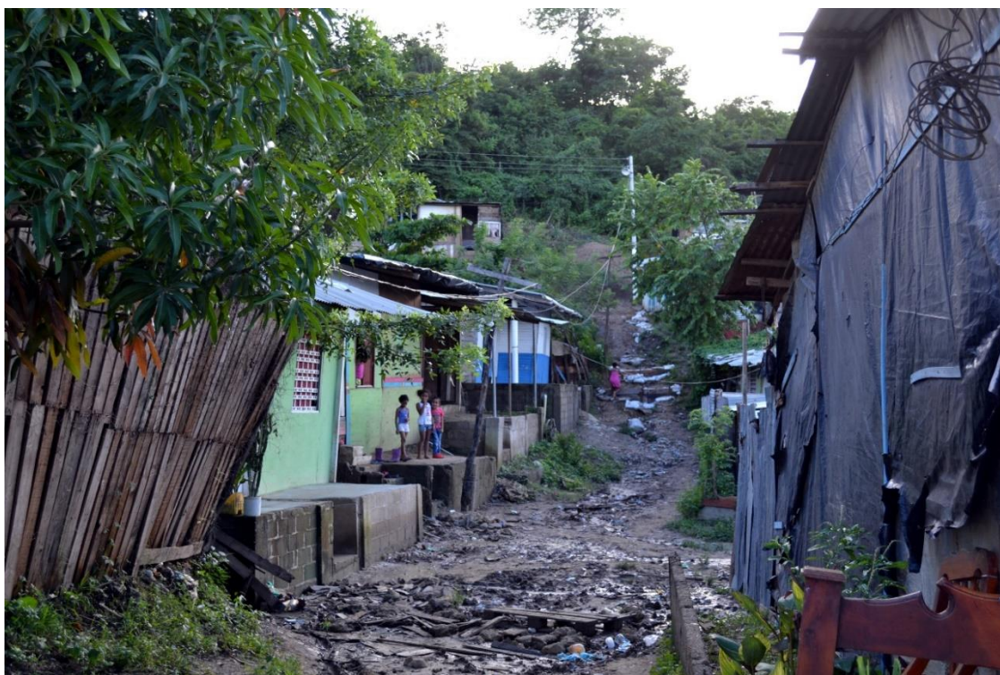
Imagen N° 3 Calle del sector Las María Mulatas.