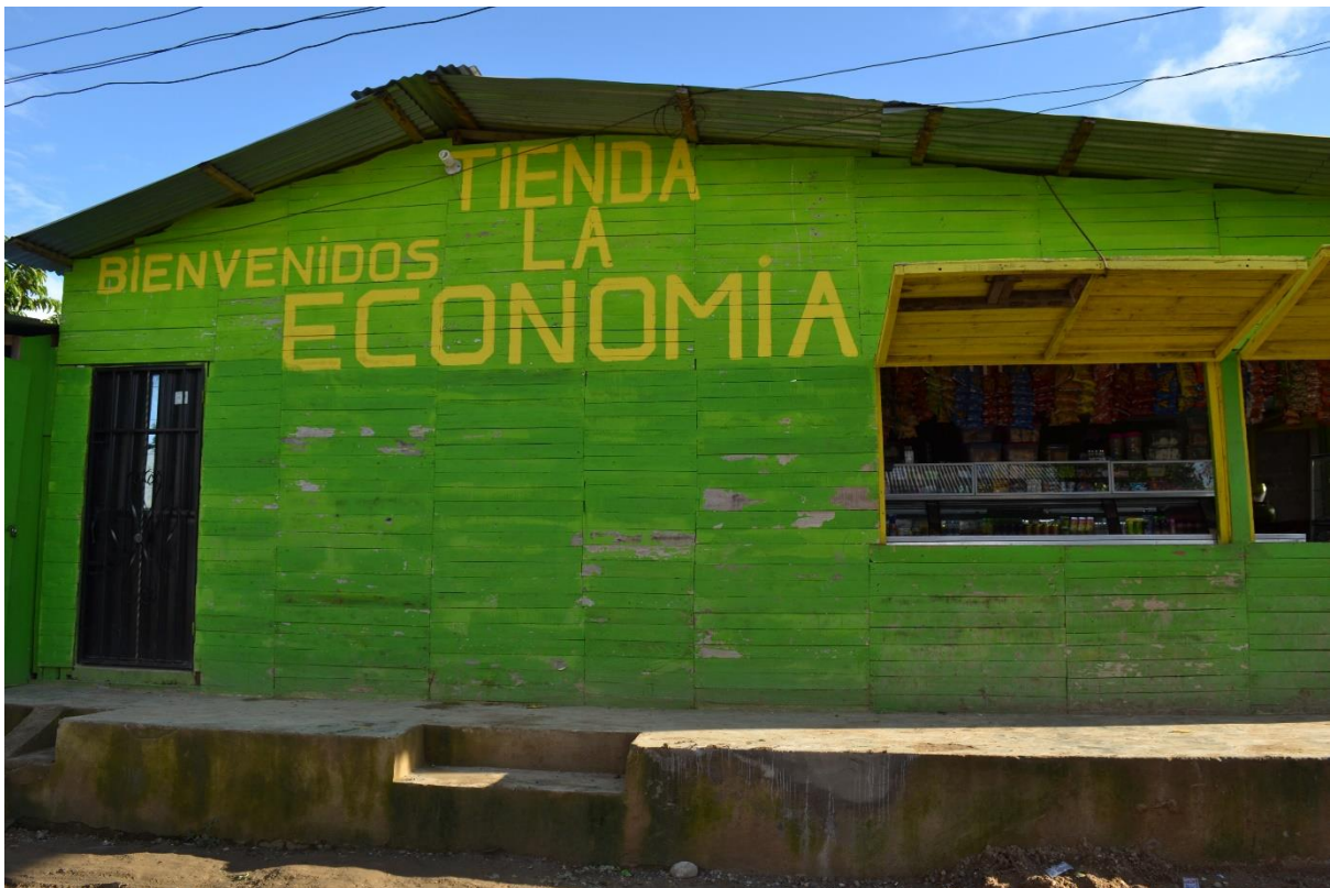
Imagen N° 8Tienda la economía. Primera tienda del sector.