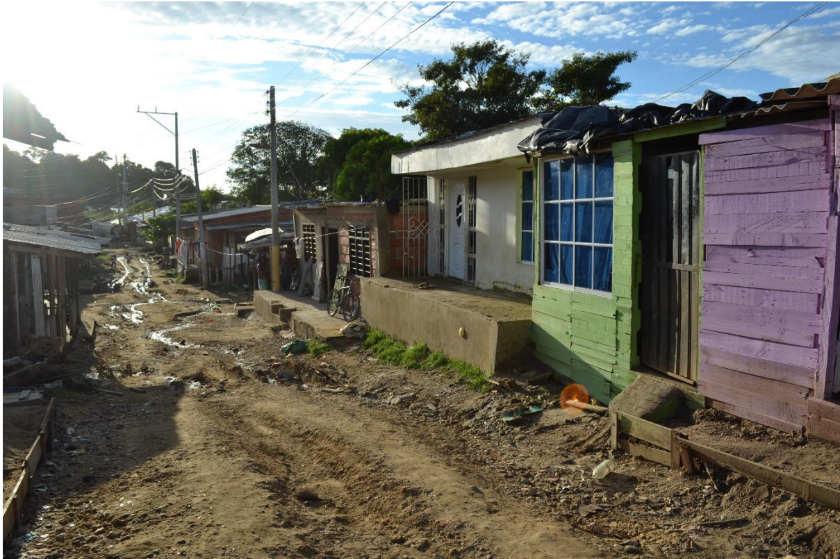
Imagen N° 21 Calle los girasoles.