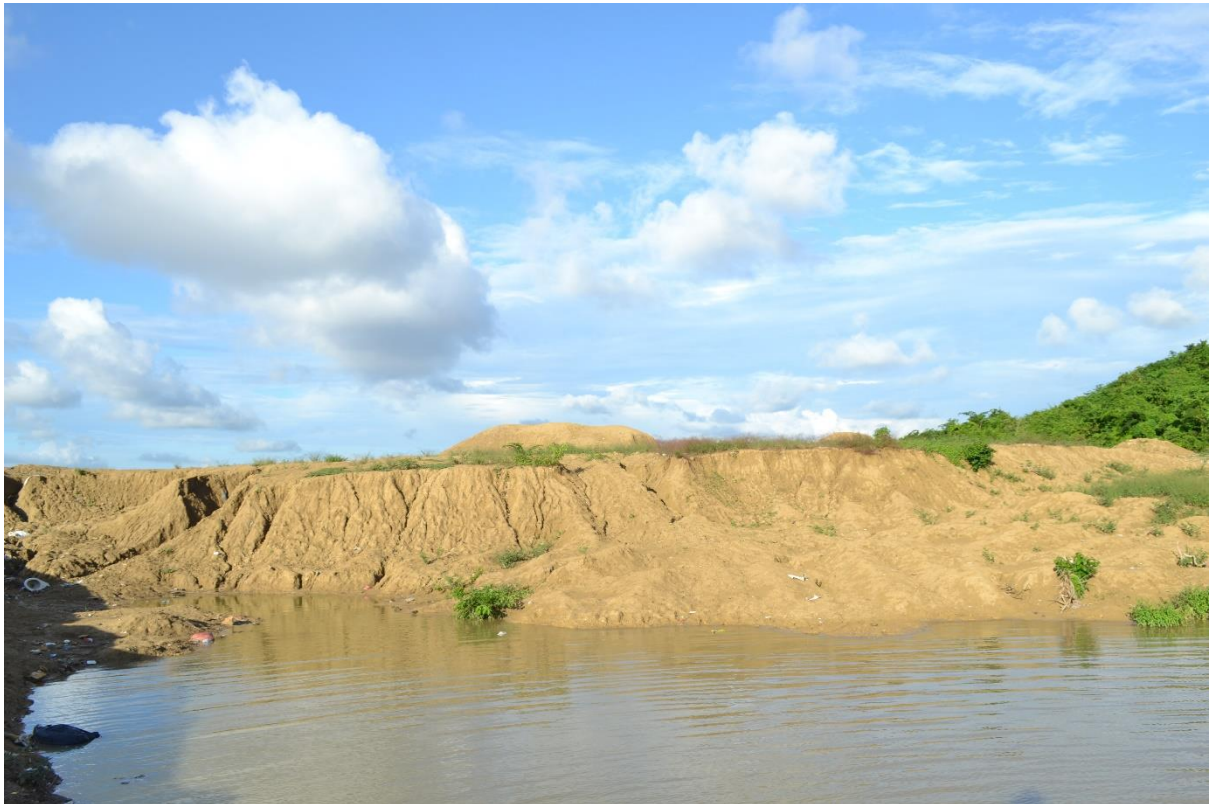
Imagen N° 10 Sector El Playón en tiempos de lluvia.