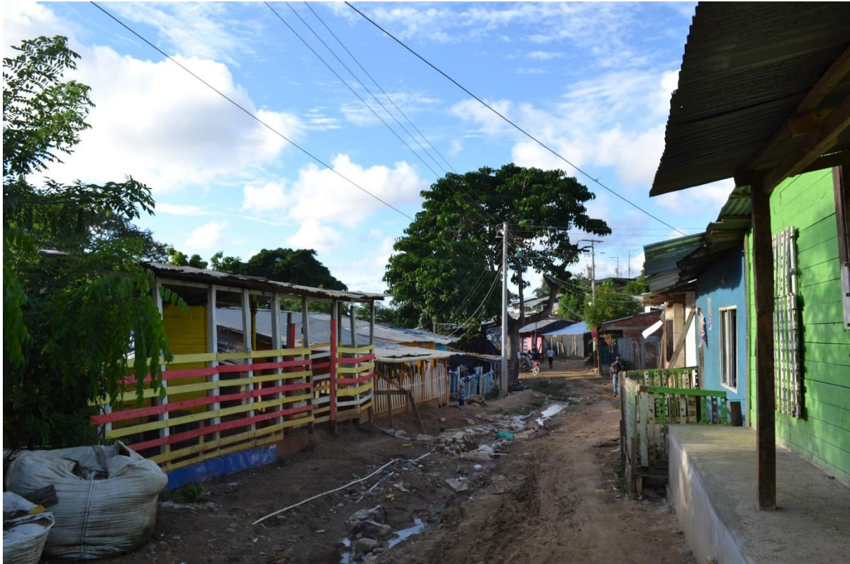
Imagen N° 11 Calle del Payaso. Fotografía del grupo investigador.