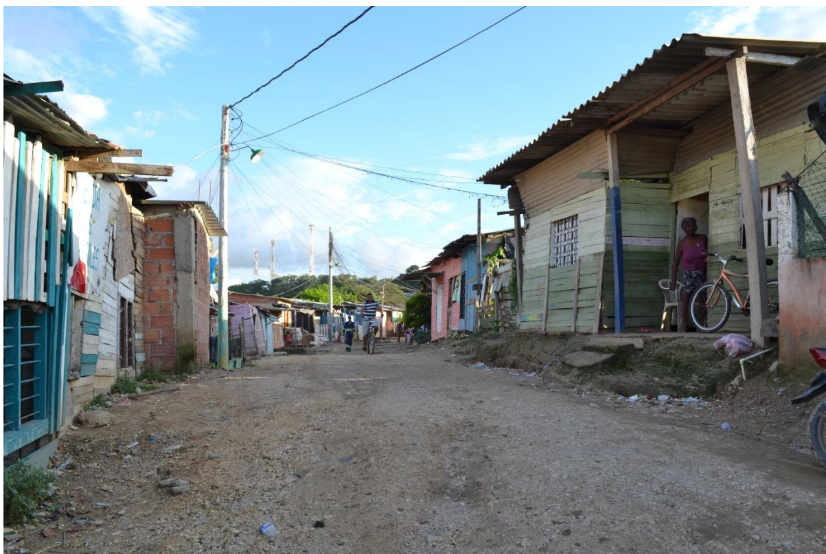
Imagen N° 23 Calle principal. Entrada al barrio Los Girasoles de Bethel.