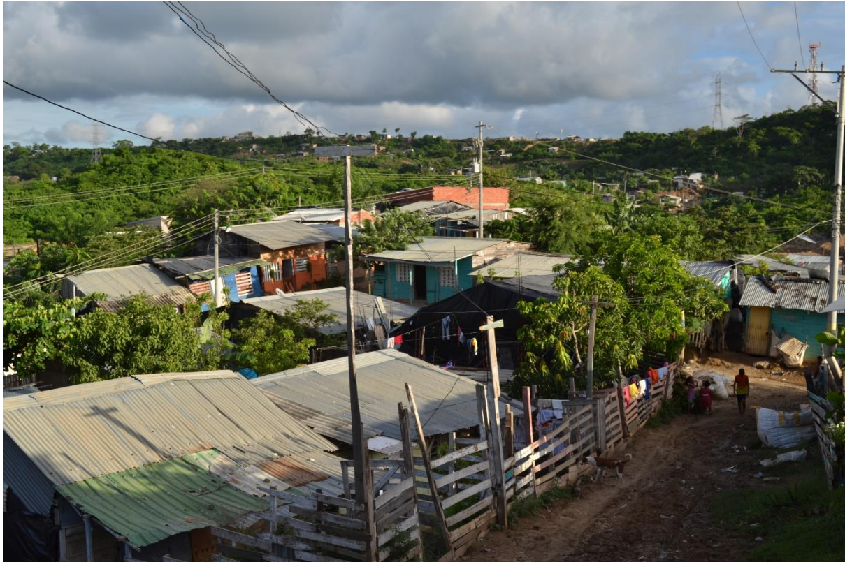
Imagen N° 15 Panorámica del barrio 1. Fotografía del grupo investigador.