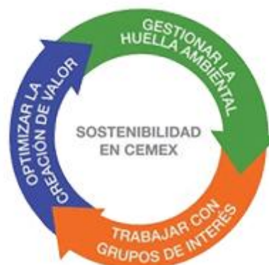
Gráfica 1. Modelo de sostenibilidad de Cemex

1.1.3 Área De Relaciones Comunitarias. Cemex a nivel mundial maneja una sola política de sostenibilidad y desarrollo sostenible así: