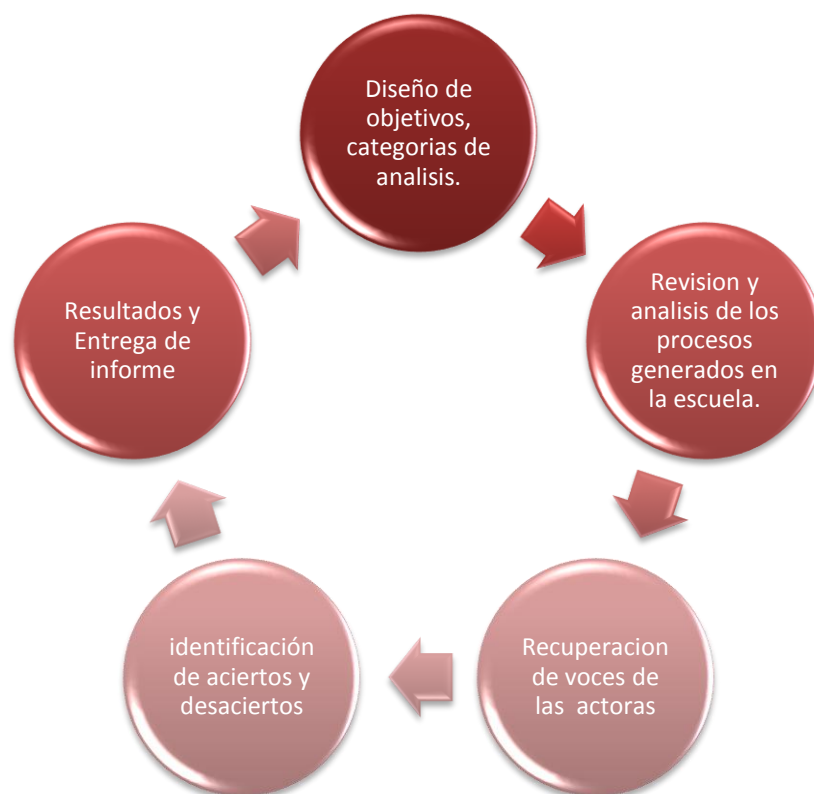
Gráfica 5. Ruta metodológica

actoras que involucran el análisis y organización de la información, descripción de los aciertos y desaciertos y divulgación de los resultados y entrega del informe.