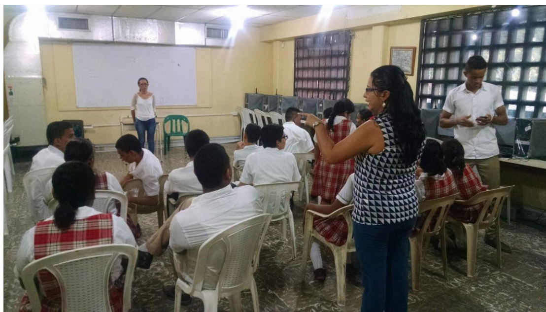
Segundo Taller-Institución Educativa Olga González Arraut