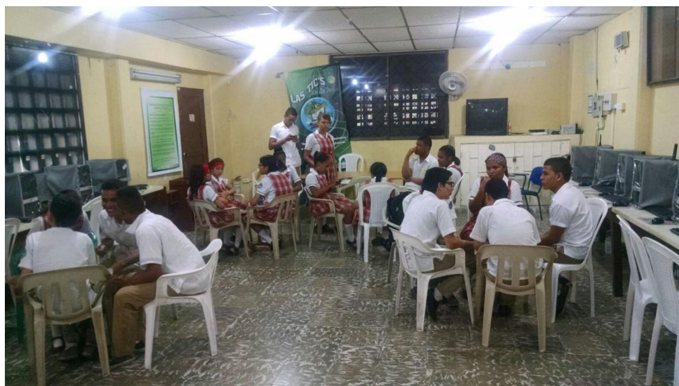
Primer Taller –Institución Educativa Olga González Arraut