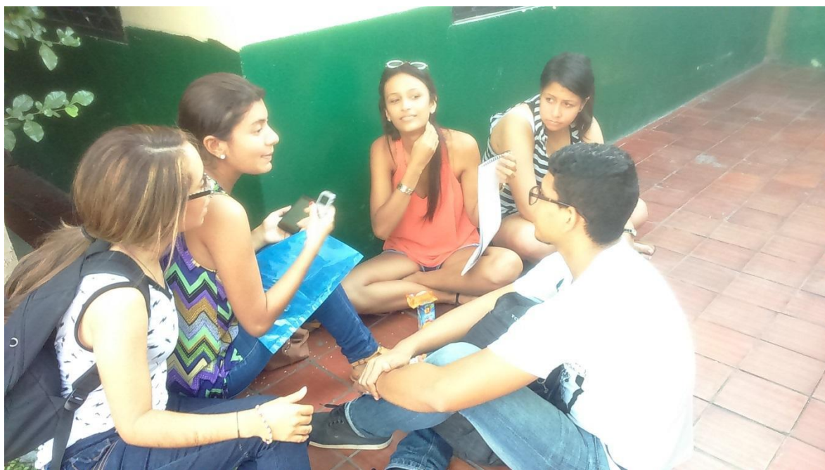
Entrevista- Percepción de los estudiantes sobre la construcción del periódico escolar en sistema Tinta-Braille