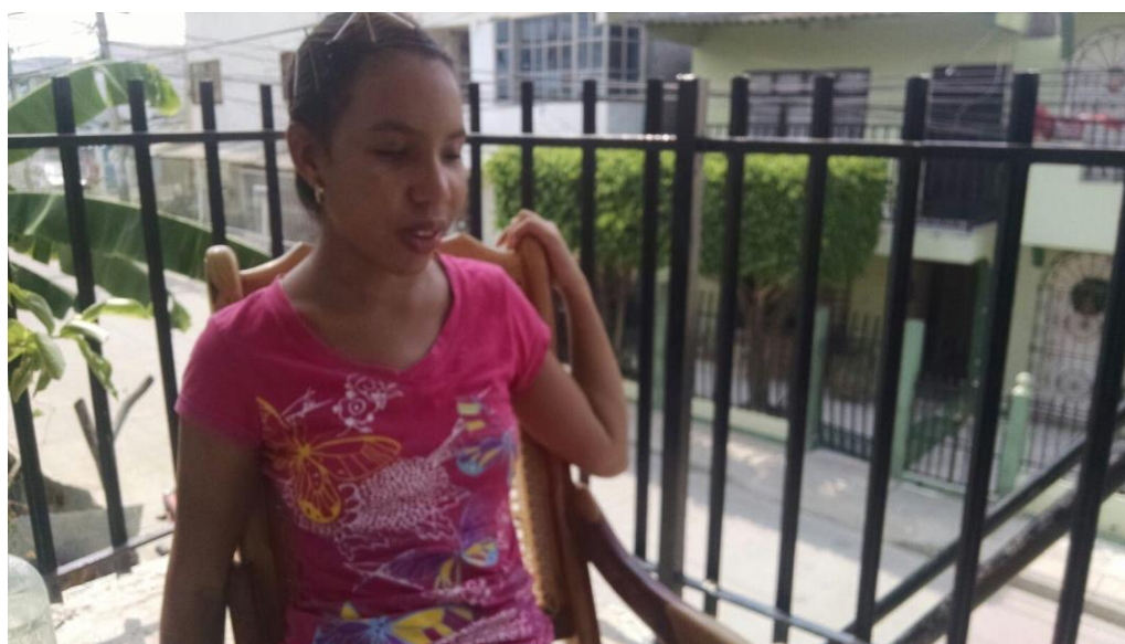
Entrevista- Percepción de los estudiantes sobre la construcción del periódico escolar en sistema Tinta-Braille