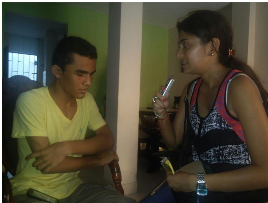
Entrevista- Percepción de los estudiantes sobre la construcción del periódico escolar en sistema Tinta-Braille