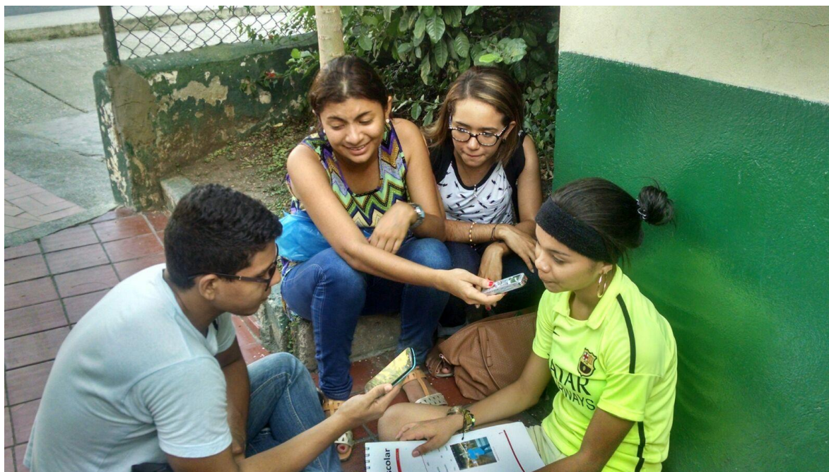
Entrevista- Percepción de los estudiantes sobre la construcción del periódico escolar en sistema Tinta-Braille