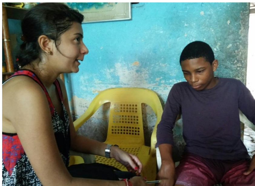
Entrevista- Percepción de los estudiantes sobre la construcción del periódico escolar en sistema Tinta-Braille