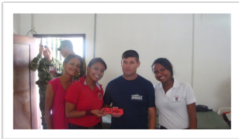
Foto 12. Celebración de fechas especiales