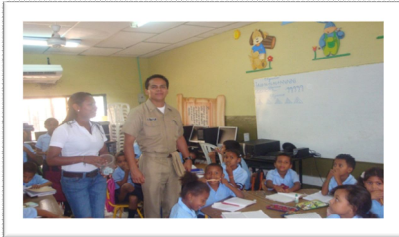
Foto 13. Entrega de Kits escolares