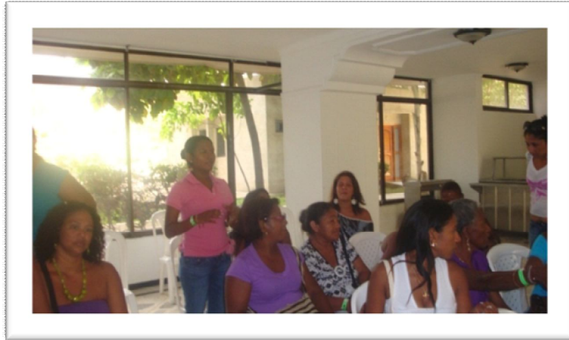
Foto 7. Taller de fortalecimiento personal con las madres y viudas de Héroes caídos en acción