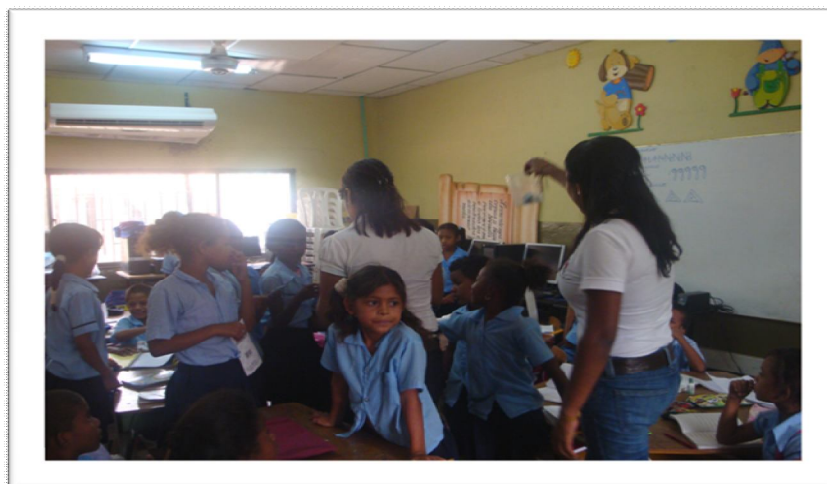
Foto 15. Entrega de Kits escolares