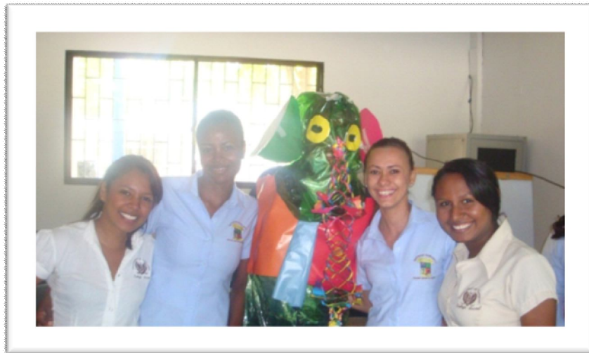
. Foto 10. Taller trabajo en equipo