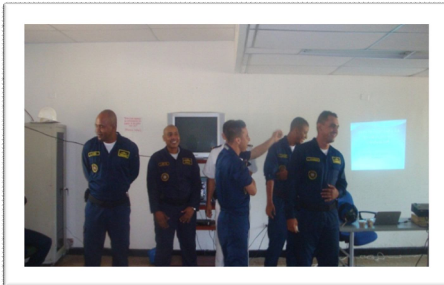
Foto 8. Taller de Liderazgo