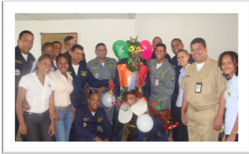
Foto 9. Taller trabajo en equipo