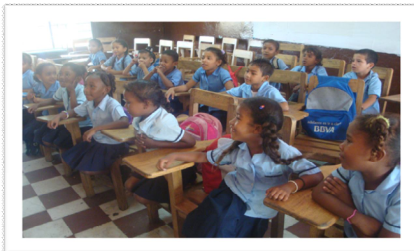
Foto 16. Entrega de Kits escolares