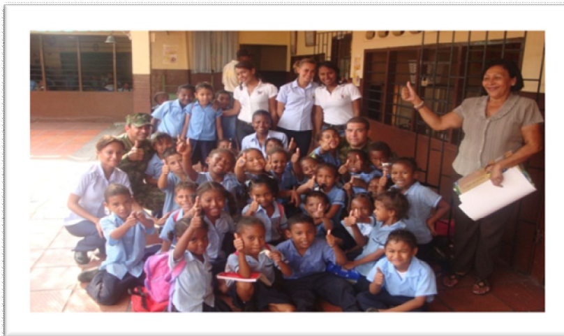
Foto 14. Entrega de Kits escolares