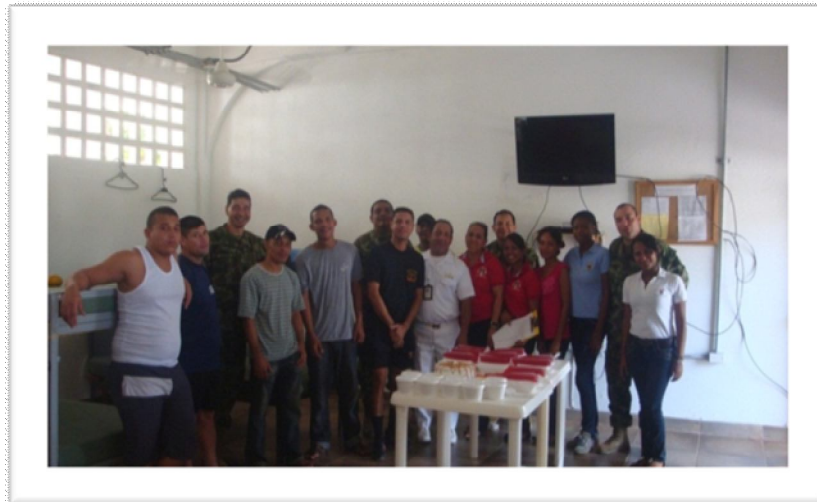
Foto 11. Celebración de fechas especiales