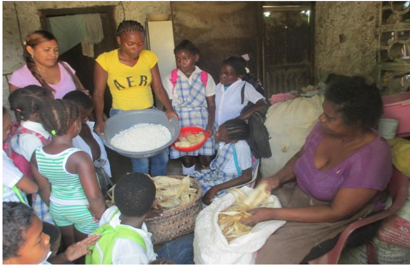
Niños aprendiendo a hacer bollos.