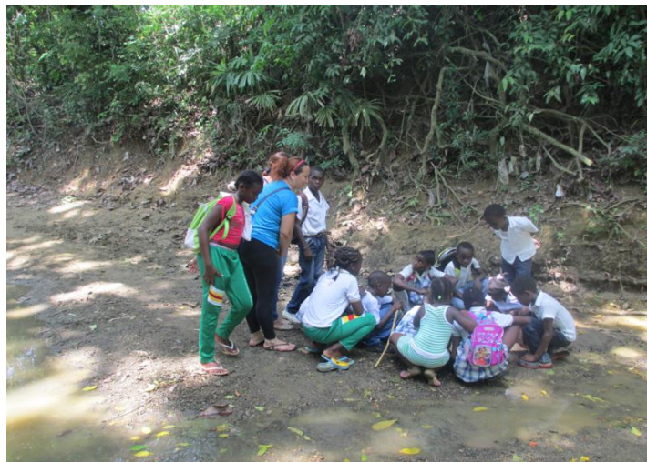
Niños jugando en el arroyo.