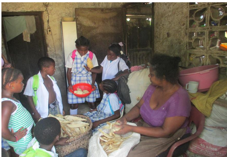
Niños aprendiendo a hacer bollos.