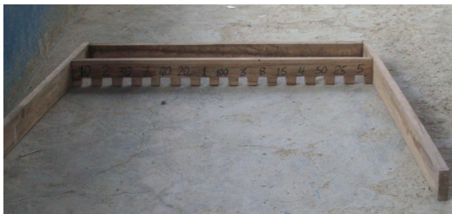
Cancha de madera para el juego de cucuruba.

juego de “bolita de uñita”, pueden participar 10 o más jugadores. Se debe hacer una cancha con 2 tablas de 85 centímetros de ancho, que se unen paralelamente con otra tabla de un metro, a 50 centímetros del borde del marco se coloca una de las tablas con varias ranuras, por donde pasan la bolita de cristal ubicadas y marcadas, para indicar el valor del puntaje, que varía según la ubicación. Entre cada ranura hay una pulgada de separación. Cada partida tiene una ronda de todos los participantes que tienen 3 posibilidades de tiros. Cada tirada permite acumular puntos según la casilla donde se ubique la bolita de cristal, el puntaje va de 1 a 100 puntos.