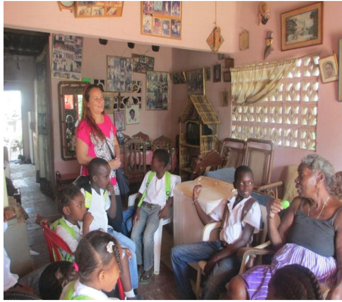
Estudiantes escuchando las historias narradas por la abuela invitada.