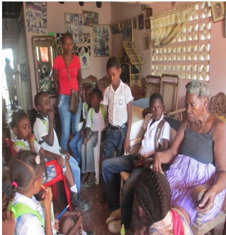
Estudiantes escuchando las historias narradas por la abuela invitada.