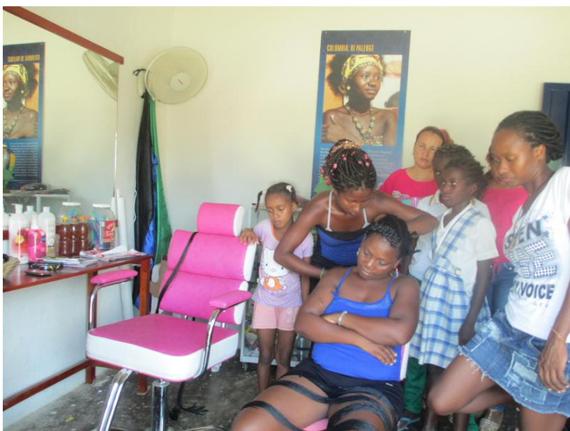
Niñas practicando peinados.