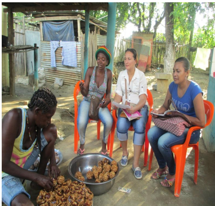
Integrantes del grupo de investigación