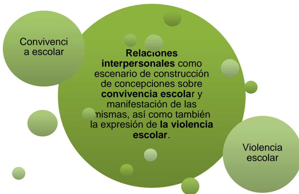
Gráfico 2. Relación entre convivencia escolar y violencia escolar en el plano de las relaciones interpersonales.

Siguiendo esta línea, un punto clave a hacer visible corresponde al papel central que juegan las relaciones interpersonales como categoría de análisis. Es a través de éstas que los estudiantes se acercan a los significados que construyen tanto de la convivencia como de la violencia escolar, aludiendo al hecho de que ambas se expresan en lo cotidiano de sus interacciones desde el hecho básico de comunicarse para transmitir qué tipo de trato les gustaría recibir, o la forma en la que deben ser sus amistades dentro de la convivencia para con recaer en actos violentos.