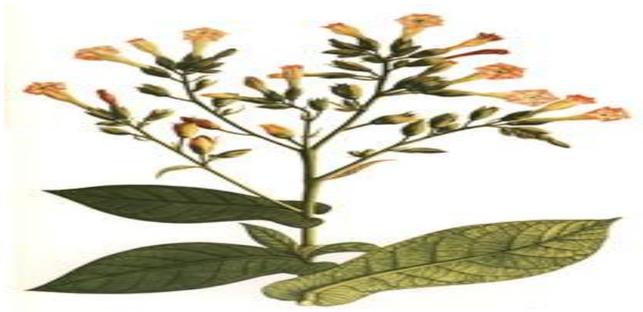
Hoja de tabaco: lamina de la expedición botánica 10 .

Tabaco =en el mercado, elemento básico que hace valioso al tabaco como articulo de consumo o materia prima industrial es la nicotina. Esta es una sustancia alcaloide que como tal, en cantidades moderadas actúa como estimulante del sistema nervioso y produce toxicomanía; pero en fuertes cantidades se convierte en un potente veneno. 9