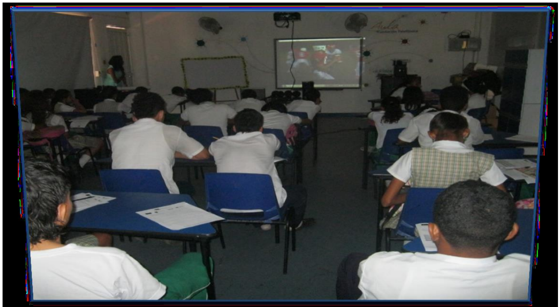
FOTO 3. Estudiantes de la Institución Educativa Rafael Núñez sede Martínez Martelo con los cuales se replicó el cine foro

Los resultados de esta actividad fueron muy positivos en la medida que posibilito el reconocimiento de aspectos negativos a nivel personal o grupal, promoviendo la mejora de las relaciones entre ellos como estudiantes y amigos, por lo cual se decidió replicar esta actividad en otras instituciones educativas como es el caso de la Institución Educativa Rafael Núñez como se evidencia en la imagen a continuación.