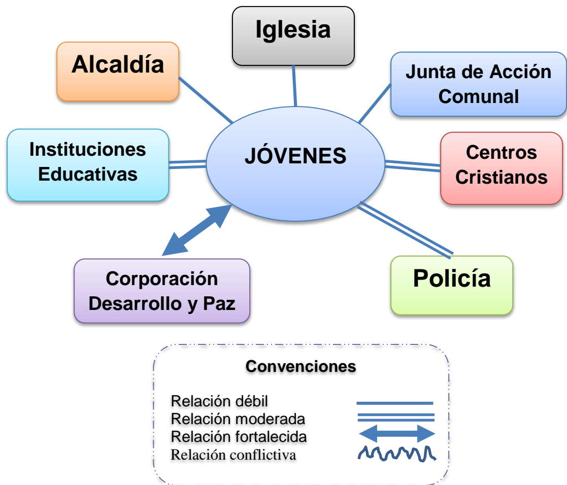
GRAFICA 2. Mapa de Relaciones, Barrio Líbano

Así como en el anterior barrio las peleas de pandillas, consumo de sustancias alucinógenas, maltrato infantil, maltrato intrafamiliar, Robos, son parte de diario de esta comunidad, además se pone de manifiesto las preocupaciones de padres de familia y estudiantes por los constates hurtos que se presentan al dirigirse a la escuela o de camino a sus casas luego de su jornada académica, en los días lluviosos no pueden ir a la escuela debido a que son días en los que se incrementan los hurto ya que la mayoría de las calles se encuentran despejadas y el transito del personal es muy poco.