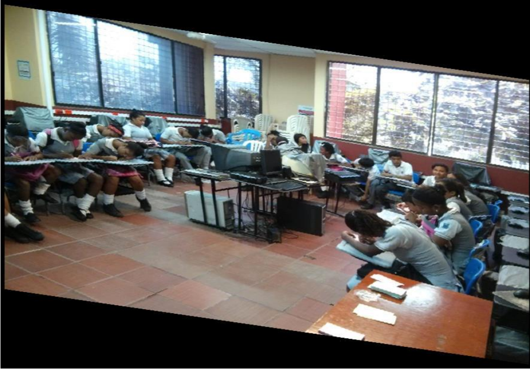
FOTO 2. Registro fotográfico del encuentro entre estudiantes