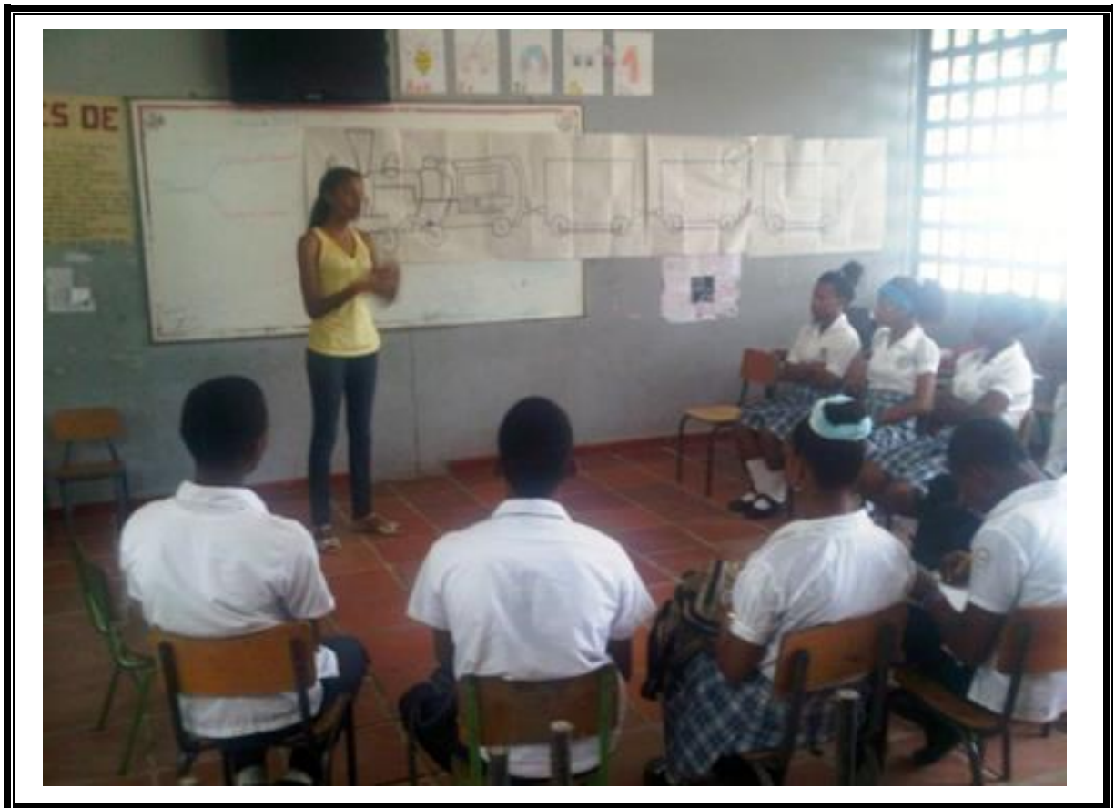
FOTO 1. Registro fotográfico del encuentro denominado Tren de la información

Como anhelos y expectativas puntualizaron en que sería para ellos muy significativo que los programas que dirigen para los jóvenes del barrio sean sostenibles en el tiempo y se les dé continuidad hasta el final; pues mucho de estos programas son dejados a medias por parte de las entidades que los dirigen. Agregaron lo importante que es para ellos contar con su comunidad libre de pandillas, peleas garantizando así el mejoramiento de la calidad de vida de los habitantes de la comunidad.