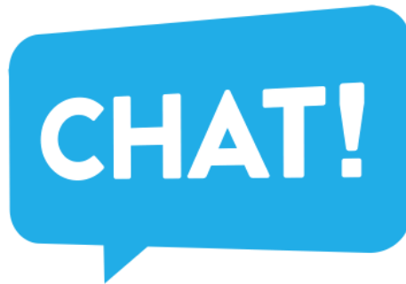
Figura 8. Chats educativos