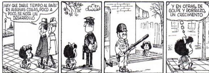
Figura 11. Historieta.