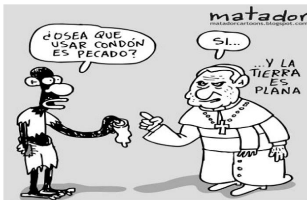
Figura 12. Caricatura.