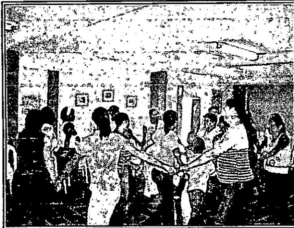
Dinámica de ambientación