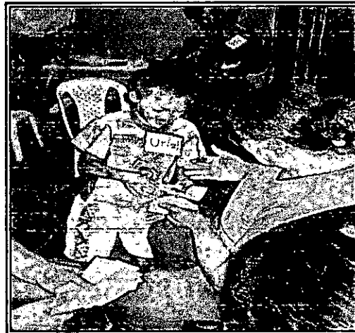
Dramatizado de un caso de trabajo infantil